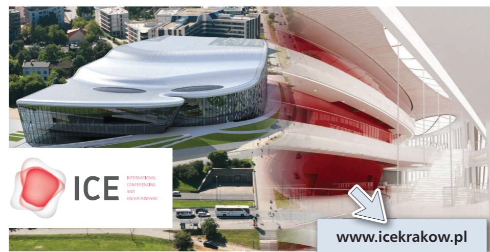
Wizualizacje ICE: © INGARDEN & JACEK EWY - ARCHITEKCI, KRAKÓW ORAZ ARATA ISOZAKI & ASSOCIATES, TOKIO

Uczestnictwo w Programie Ambasadorów Kongresów Polskich upoważnia do: