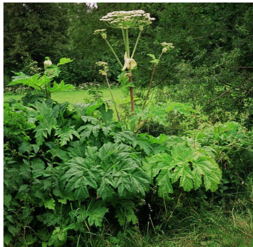
Fot. 1. Kwitnąca roślina barszczu Sosnowskiego