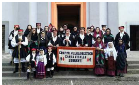
Zespół Santa Vitalia (Włochy)