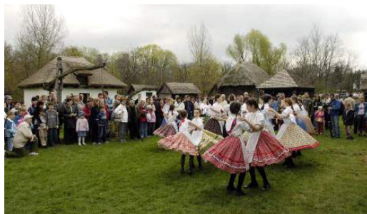
Skansen - Nyíregyháza