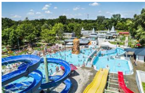
Kapeliisko Parkowe - Nyíregyháza

Prezentacja sztuki ludowej i rękodzieła artystycznego oraz produktów regionalnych