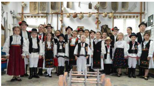
Zespół Jucausii de pe Somes

Prezentacja członków Stowarzyszenia Rzemieślników w Cluj. Celem którego jest ożywienie tradycyjnego rzemiosła, promocja wyrobów rękodzielniczych charakterystycznych dla tego rejonu, szkolenie młodzieży, organizowanie targów i wystaw oraz programów wymiany z rzemieślnikami z innych krajów.