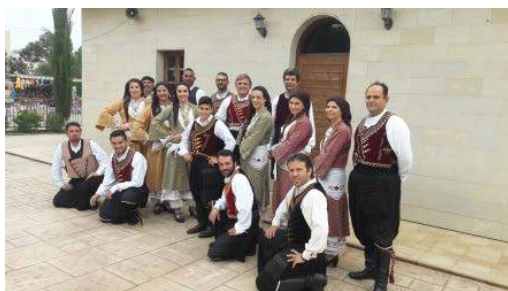
Zespół Taneczny z Larnaki (Cypr)