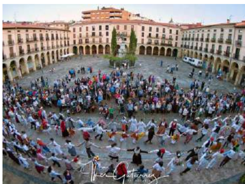
Zespół Taldea (Kraj Basków, Hiszpania)