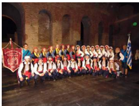
Zespół z Kawali (Grecja)