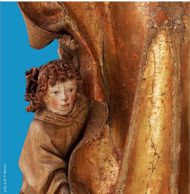
proj. graf. P. Bynar