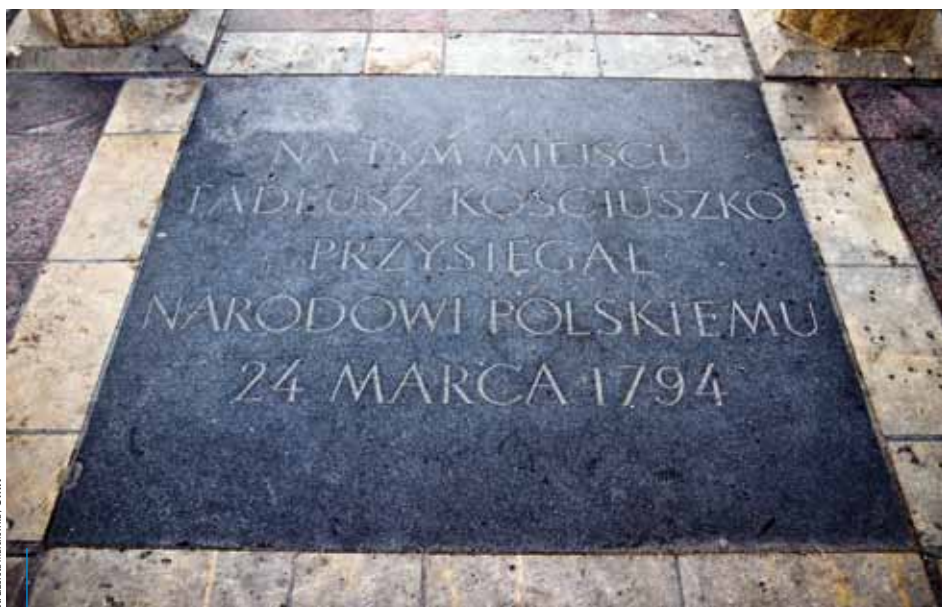
Tadeusz Kościuszko złożył swoją przysięgę rankiem 24 marca 1794 r.