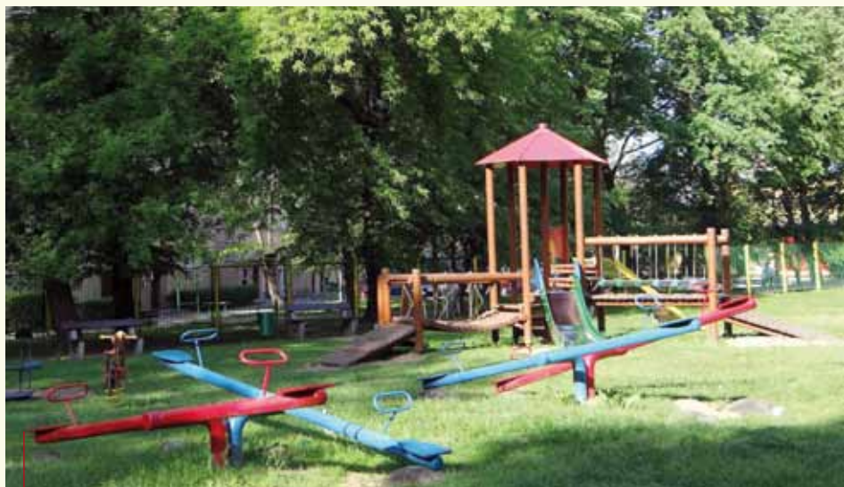
Nowe statuty dzielnic mają sprawić, że mieszkańcy będą mieli większy wpływ na to, co się dzieje w ich „małych ojczyznach”. Czy powstanie w nich np. więcej placów zabaw?