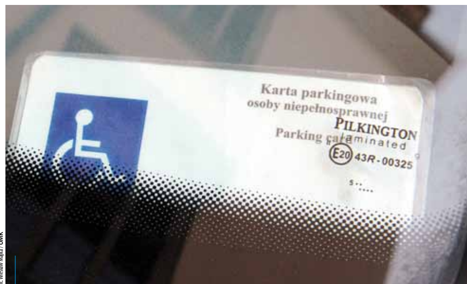
Dzięki dofinansowaniu osoby niepełnosprawne ruchowo mogą liczyć na pomoc w uzyskaniu prawa jazdy kategorii B

To nie wszystkie możliwości w ramach „Aktywnego Samorządu”. O szczegóły najlepiej zapytać u źródeł, czyli w Miejskim Ośrodku Pomocy Społecznej (Dział Rehabilitacji, ul. Józefińska 14, 30-529 Kraków, tel. 12 616-54-08, e-mail: dr@mops.krakow.pl) lub znaleźć je na stronie internetowej placówki: www.mops.krakow.pl .