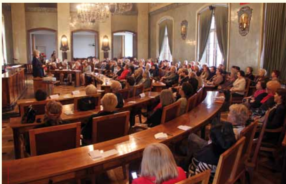
Krakowianki 50+ w Sali Obrad Rady Stołecznego Królewskiego Miasta Krakowa