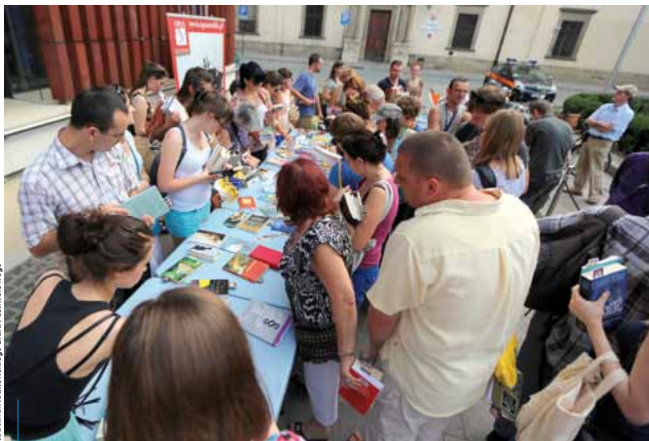
W dziewięciu edycjach akcji wzięło udział blisko 2 tys. osób, a nowych właścicieli znalazło ponad 3 tys. książek

Drugie życie książki to wspólna akcja portalu Bookeriada i Krakowskiego Biura Festiwalowego, organizowana co miesiąc od lutego tego roku. Zorganizowano także dwie edycje specjalne: podczas Targów Książki dla Dzieci oraz podczas konwentu miłośników fantastyki Krakon. W dotychczasowych dziewięciu edycjach wzięło udział blisko dwa tysiące osób, a nowych właścicieli znalazło ponad trzy tysiące książek. Kilkaset tomów trafiło także do zaprzyjaźnionych bibliotek.