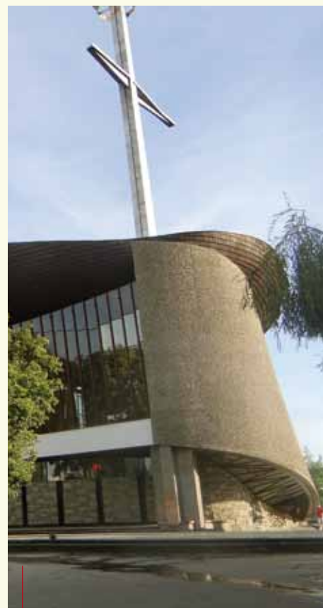
Budową świątyni osobiście opiekował się ks. kard. Karol Wojtyła, który 18 maja 1969 r. wmurował kamień węgielny

W 2012 r. zbiega się kilka ważnych rocznic związanych z życiem parafii Matki Bożej Królowej Polski: 60-lecie parafii, 55-lecie poświęcenia krzyża na placu budowy, 35-lecie konsekracji kościoła, 20-lecie koronacji Matki Bożej Fatimskiej koroną papieską.