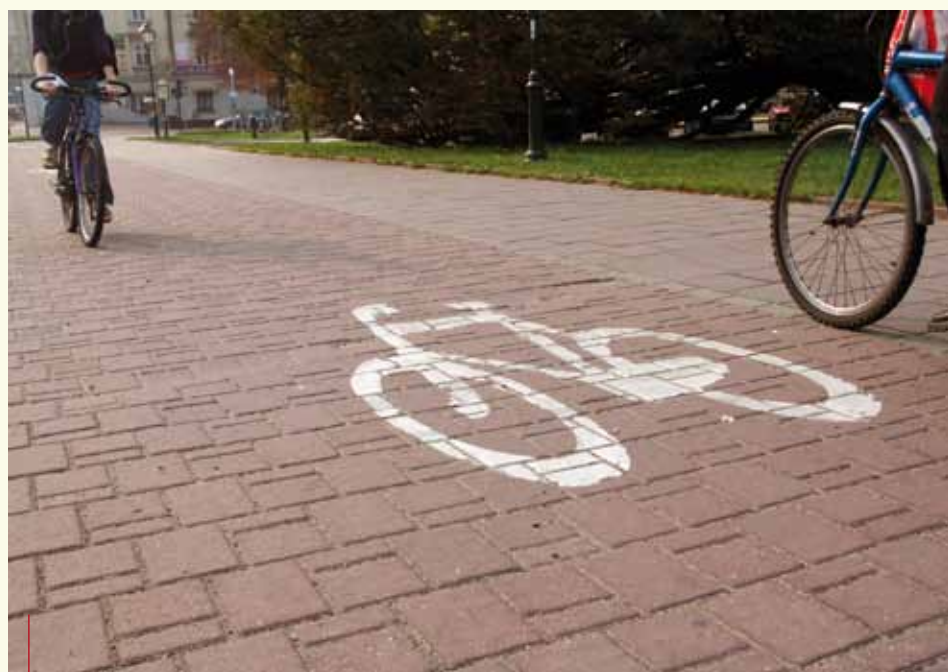
Za unijne dotacje ma powstać w Małopolsce zintegrowana sieć tras rowerowych

– Sukcesem jest przede wszystkim fakt, że nie spotykamy się zbyt późno, że zrywamy z tradycją przesypania szans na unijne dotacje. To spotkanie miało charakter techniczny. Na kolejnych powinny zapaść decyzje w sprawie podziału środków. Przed nami długa droga, ale zrobiliśmy już pierwszy krok – kwituje Marcin Hyla.