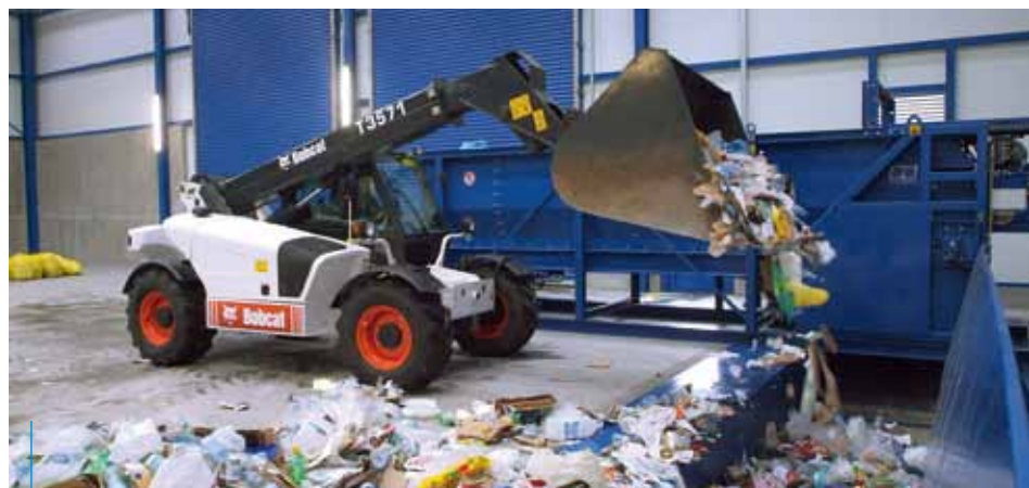
Nowy system gospodarki odpadami będzie obowiązywał od lipca 2013 r.

Szczegółowe informacje dotyczące nowego systemu gospodarki odpadami już wkrótce pojawią się na stronach: www.ekocentrum.krakow.pl oraz www.krakow.pl .