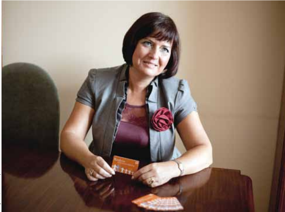
Paneliści UMJK