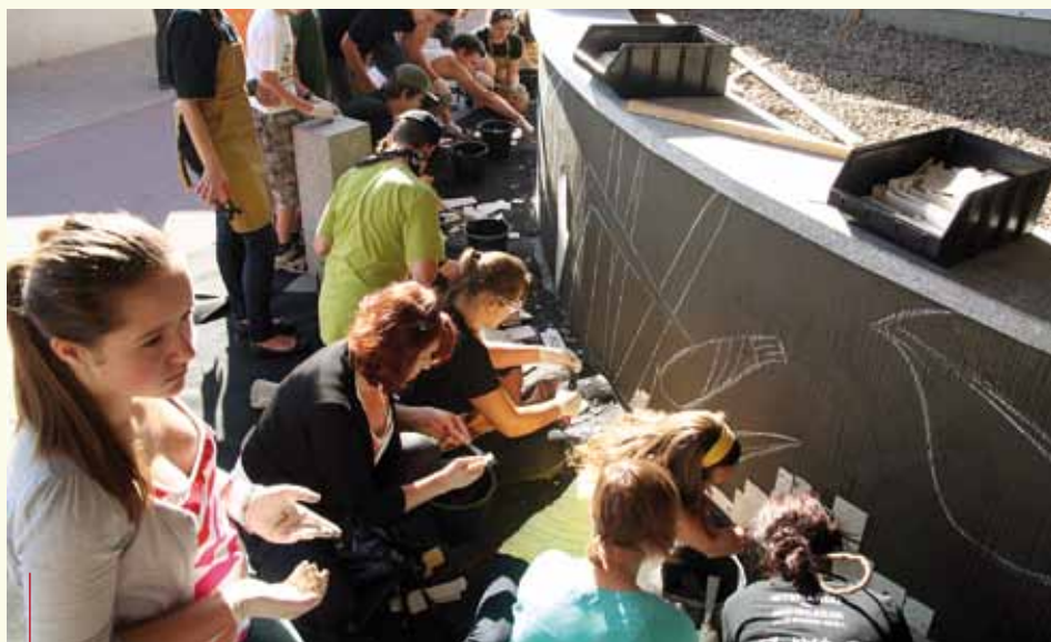
Rondo Mogilskie upiększy mozaika z motywami zaczerpniętymi z twórczości Wyspiańskiego