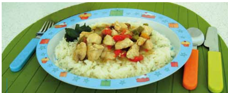
Zjedzenie ciepłego obiadu jest ważne dla prawidłowego rozwoju dziecka

*rzecznik prasowy Miejskiego Ośrodka Pomocy Społecznej w Krakowie