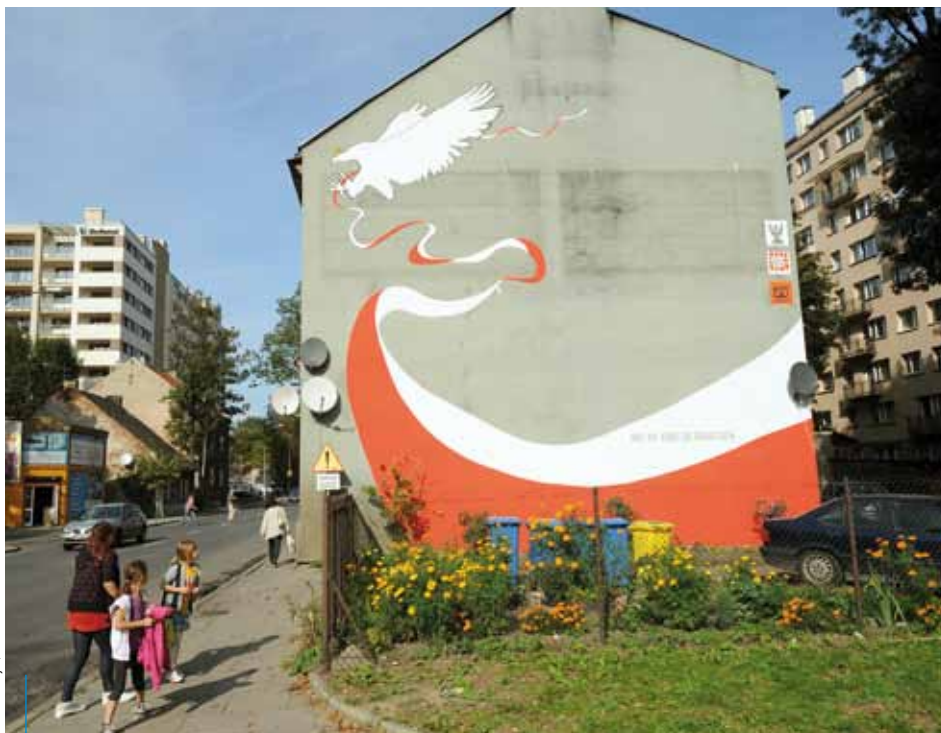
Wraz z otwarciem stałej wystawy w Muzeum AK powstał mural na ścianie kamienicy przy al. Kijowskiej 50 dedykowany pamięci żołnierzy AK

Więcej informacji na temat Muzeum AK można znaleźć na: www.muzeum-ak.pl , www.facebook.com/muzeumAK .