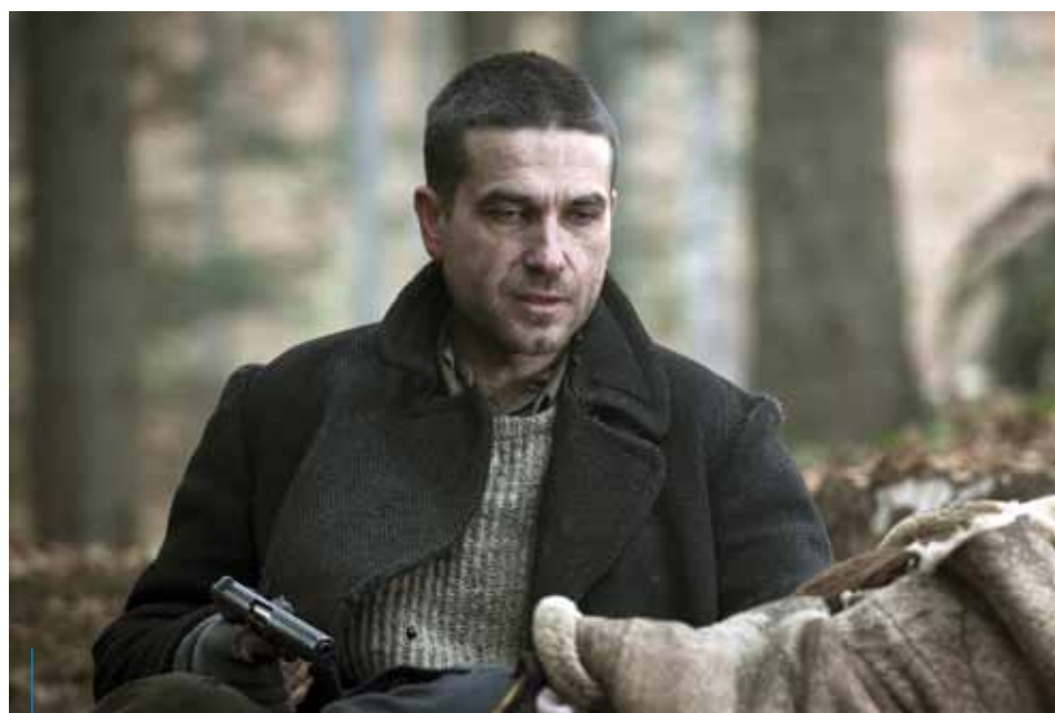
Główną rolę w „Obławie” zagrał Marcin Dorociński, laureat nagrody dla najlepszego aktora na ostatnim Festiwalu Polskich Filmów Fabularnych

Warto przypomnieć, iż Krakowska Komisja Filmowa działa w strukturach Krakowskiego Biura Festiwalowego i wspiera realizację produkcji filmowych: pomaga przy uzyskiwaniu wszelkich wymaganych zezwoleń, a także dostępie do lokacji publicznych na terenie całego regionu. Koordynuje kontakty producentów z urzędami, policją, strażą miejską, strażą pożarną oraz pogotowiem ratunkowym. Dzięki wypracowanym procedurom wszystko dzieje się w najszybszym możliwym terminie. KKF pomaga partnerom również na wcześniejszych etapach produkcji m.in. w znalezieniu odpowiednich lokacji filmowych, co ułatwia baza danych prezentująca kilkaset atrakcyjnych miejsc zdjęciowych na terenie całego województwa. Pomaga także w udostępnianiu dla potrzeb ekip filmowych obiektów znajdujących się na terenie miasta. Partnerzy KKF mogą ponadto korzystać ze stale aktualizowanej bazy specjalistów zajmujących się produkcją filmową i telewizyjną oraz doświadczonych firm działających w tej branży. Dodatkowym atutem Krakowskiej Komisji Filmowej jest możliwość dofinansowania produkcji filmowej zlokalizowanej w Małopolsce za pośrednictwem Regionalnego Funduszu Filmowego, którym zarządza Krakowskie Biuro Festiwalowe. Więcej na: www.film-commission.pl .