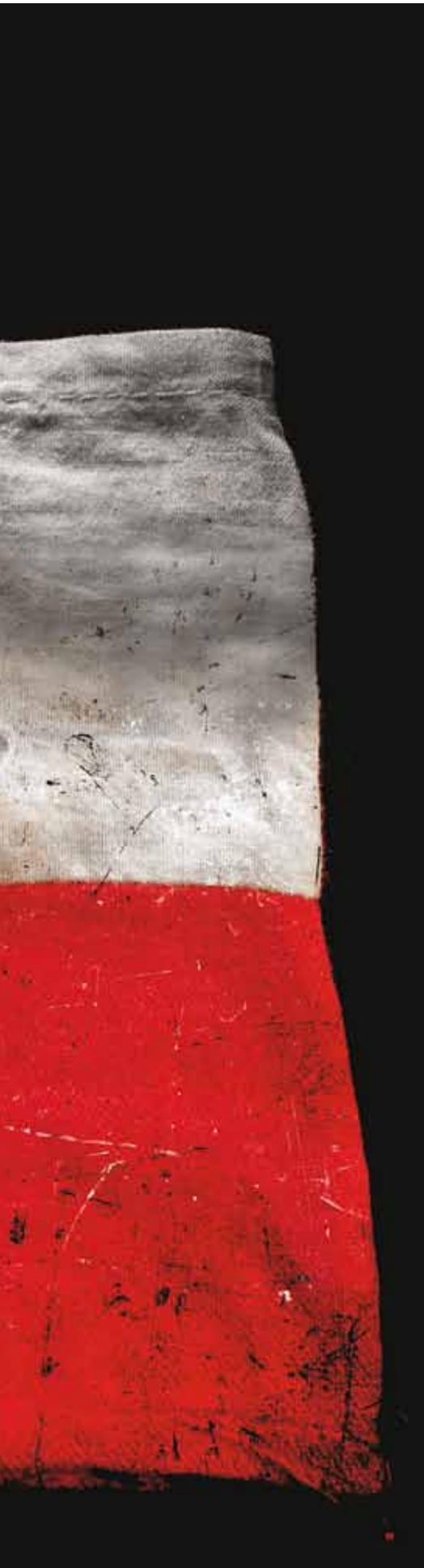
fragment płaszcza Włodka Semaszówicza