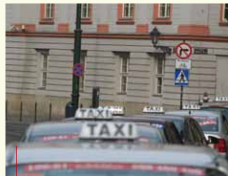
Czy uda się uporządkować rynek przewozów osobowych?

Wynikiem spotkania komisji było skierowanie do Prezydenta Miasta Krakowa wniosku o doprowadzenie do uporządkowania rynku przewozów osobowych na terenie Krakowa, a także zwrócenie się do przedstawicieli służb kontrolujących o dalsze prowadzenie działań w tej sprawie.