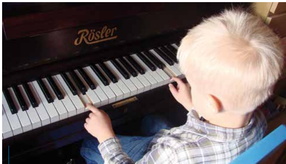
Dzięki pomocy ludzi wielkiego serca utalentowane dzieci mają możliwość rozwijania swoich umiejętności

Bez zaangażowania mieszkańców Krakowa, bez pomocy lokalnych przedsiębiorców, darczyńców, nie uda się zrealizować wielu dziecięcych marzeń. Zachęcamy wszystkich, którzy chcą wesprzeć artystyczne, naukowe i sportowe talenty, aby zapoznali się z szczegółami projektu na stronach: www.mecenasdzieciecyhtalentow.pl , www.sprawyspoleczne.pl oraz www.czasdzieci.pl . Znajdziemy tam sylwetki dzieci zgłoszonych do projektu, informacje dotyczące form wsparcia oraz numer konta, na który można przekazywać pieniądze.