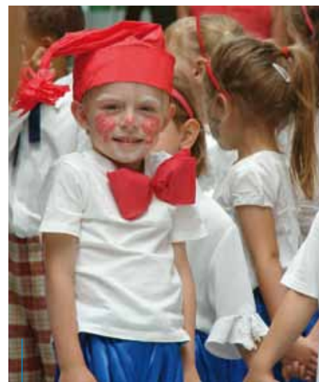
W Krakowie przybywa miejsc, w których dzieci są mile widzianymi gośćmi