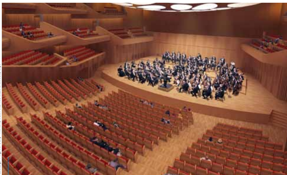
wizualizacja: © Ingarden & Ewy – Architektura, Kraków oraz Herta i Pauli & Associates, Tokyo

Projekt współfinansowany przez Unię Europejską w ramach Małopolskiego Regionalnego Programu Operacyjnego na lata 2007–2013