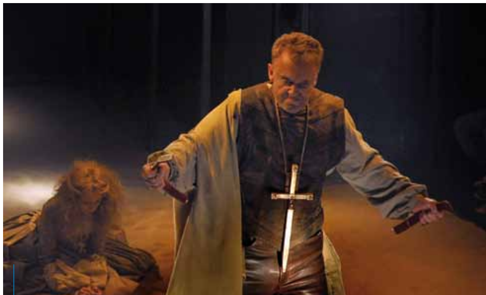
Noc Teatrów cieszy się nieustannie popularnością wśród krakowian

W rejonach rdzennej muzyki romansującej z jazzem porusza się także zespół Rdzeń, któ-