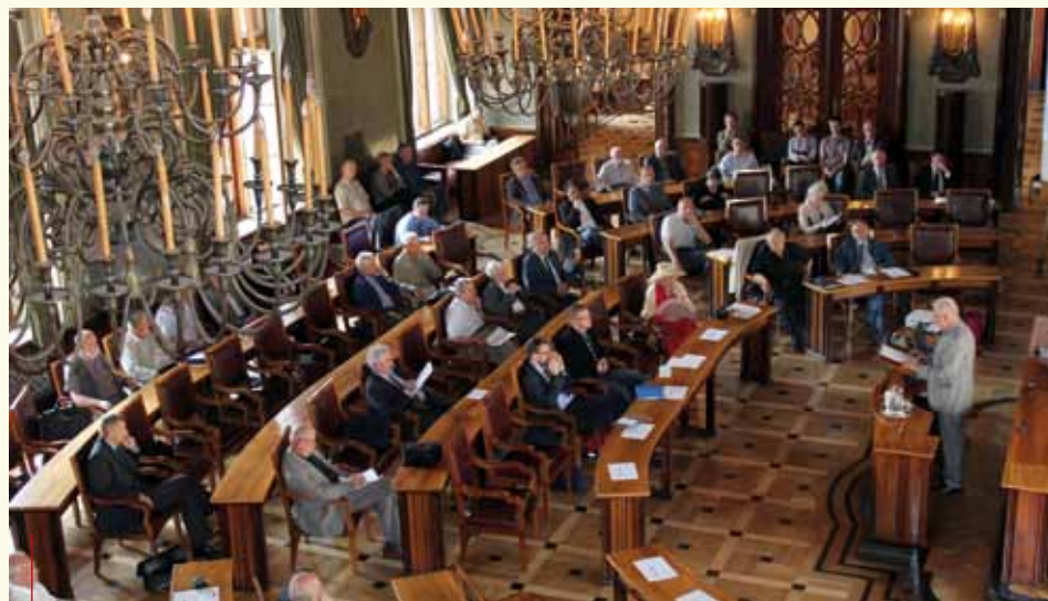
Dyskusja panelowa pt. „Oleandry – Pomnik Historii” toczyła się w Sali Obrad RMK

*Sekretarz Obywatelskiego Komitetu na rzecz Oleandrów