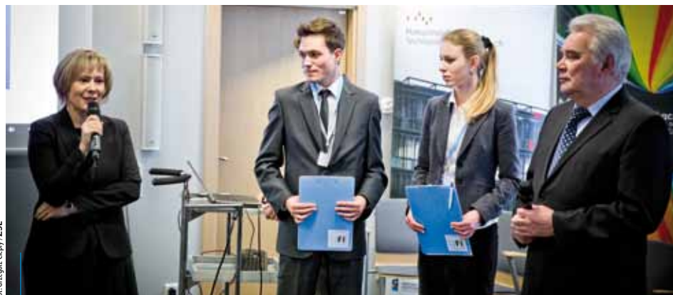
Tegoroczna 7. edycja festiwalu, podobnie jak w zeszłym roku, odbyła się w Krakowskim Parku Technologicznym w Zabierzowie

Do tej pory w konkursie wzięli udział uczniowie siedmiu szkół: Zespołu Szkół Energetycznych (Kraków, ul. Loretańska 16), Zespołu Szkół nr 1 (Kraków, ul. Ułanów 3), Zespołu Szkół Techniczno-Ekonomicznych (Skawina, ul. Kopernika 13), Zespołu Szkół Elektrycznych nr 1 (Kraków, ul. Kamieńskiego 49), Zespołu Szkół Huty im. Tadeusza Sendzimira (Kraków, os. Złotej Jesieni 2), Zespołu Szkół Zawodowych Polskiego Górnictwa Naftowego i Gazownictwa (Kraków, ul. Brzozowa 5) oraz Zespołu Szkół Łączności (Kraków, ul. Monte Cassino 31).