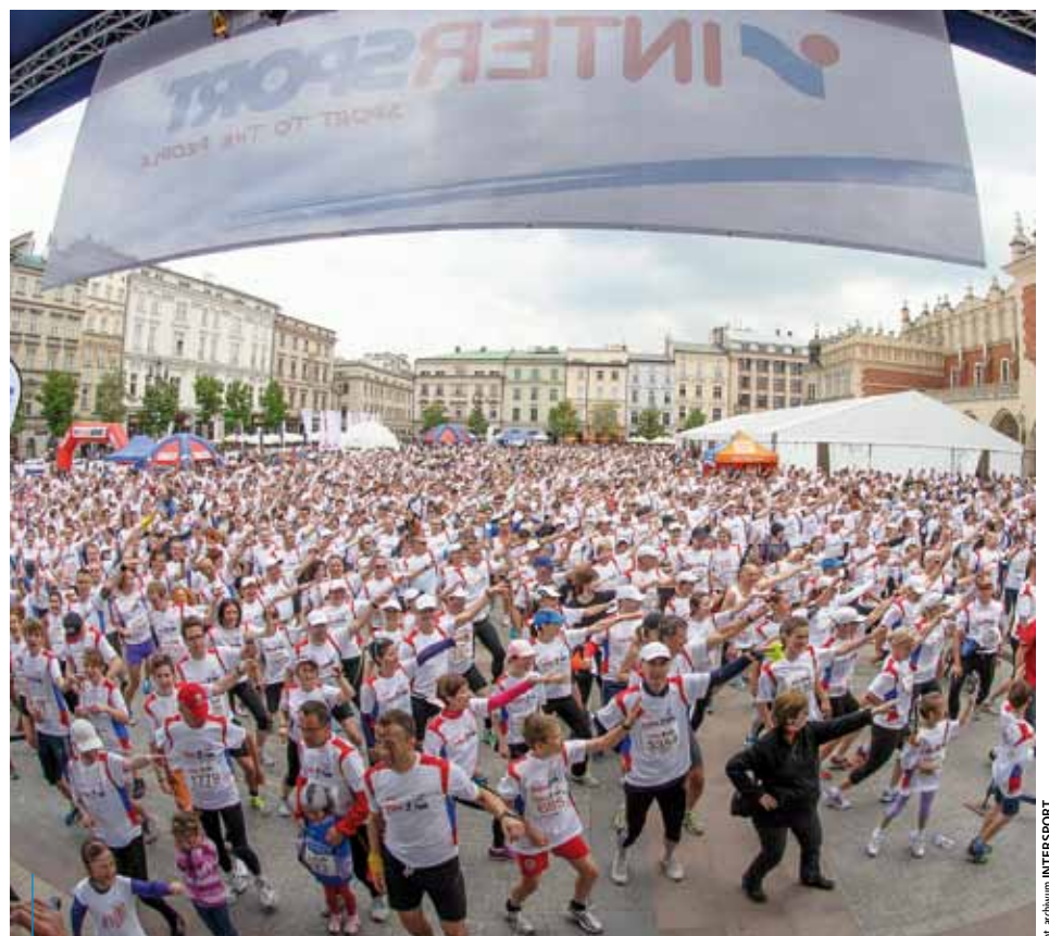
W ubiegłorocznej edycji biegu na starcie stanęło prawie 3500 uczestników

Szczegółowe informacje o VII Pro Touch Cracovia Interrun 2014 można znaleźć na stronie: www.interrun.pl , a także bezpośrednio w Biurze Obsługi Klienta tel. 801-500-502 (stacjonarny), 12 444-88-88 oraz e-mail: interrun@intersport.pl .