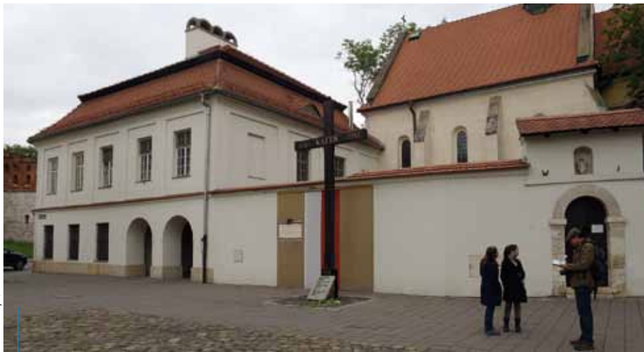
Dzięki Franciszkowi Ferdynandowi ocalał budynek w otoczeniu kościoła św. Idziego – w którym dziś mieści się żłobek

Zabity przed stu laty w Sarajewie arcyksiążę Franciszek Ferdynand nie cieszy się dobrą opinią wśród publicystów piszących o monarchii habsburskiej. Piszą, że strzelał do sarenek z karabinu maszynowego, że tak zaprawił się do mordowania wszelkiej zwierzyny, iż będąc chorym i leżąc w łóżku, miał pod ręką sztucer, którym polował na muchy. Jeszcze sto lat po śmierci zarzuca mu się skąpstwo i... pobożność.