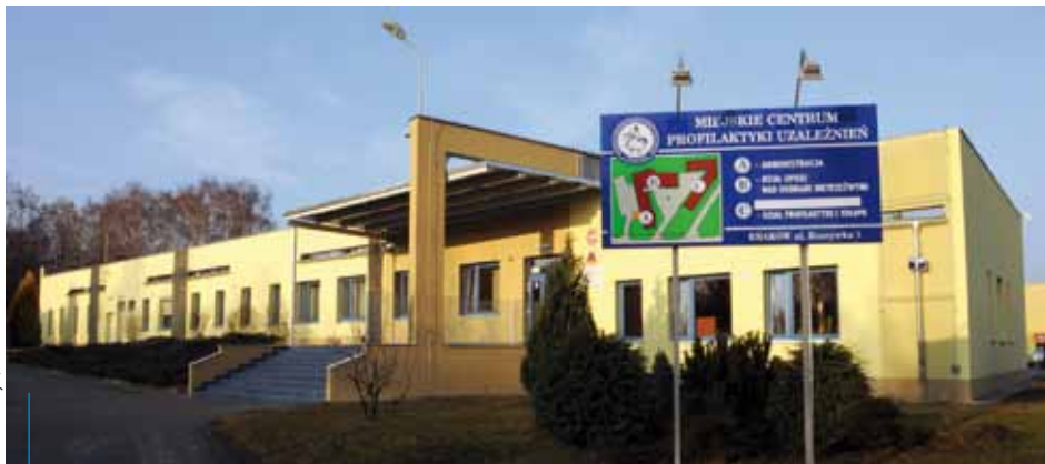
Miejskie Centrum Profilaktyki Uzależnień mieści się w Krakowie przy ul. Rozrywka 1

W „Kalendarzu Djabelskim na 1886 r.” – nosił on taką nazwę, gdyż przygotowywała i wydawała go redakcja krakowskiego pisma satyrycznego „Djabeł” – opublikowano listę podwawelskich „godnych widzenia osobliwości”. Jedną z pozycji tej listy były „Stacje ratunkowe dla pijaków – pod telegrafem”.