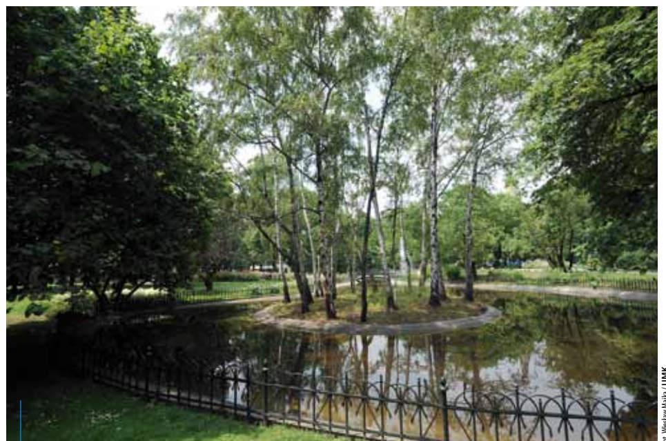
Tereny zielone są wielkim skarbem dla miasta, ale jednocześnie olbrzymim wyzwaniem

Zarządzanie zielenią w mieście jest procesem bardzo złożonym, wymagającym współpracy różnych jednostek miejskich i wydziałów urzędu miasta z organizacjami pozarządowymi i lokalnymi społecznościami. Działania podejmowane w Krakowie na rzecz zieleni obejmują wiele zagadnień i zmiernają w kierunku rozwoju i utrzymania tych terenów, a co za tym idzie – poprawy komfortu życia mieszkańców.