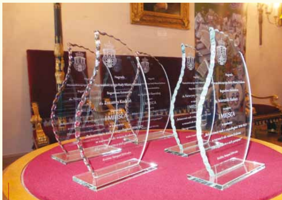
Grawerowane statuetki to wyróżnienia od Przewodniczącego Rady Miasta Krakowa dla pięciu zdobywców pierwszych miejsc w trzech kategoriach

Jest to już trzeci konkurs dotyczący patronów ulic przeprowadzony przez Radę Dzielnicy III i rosnące grono współpracujących z nią instytucji.