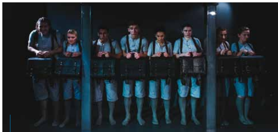
Teatr Łaźnia Nowa, „Quo vadis”