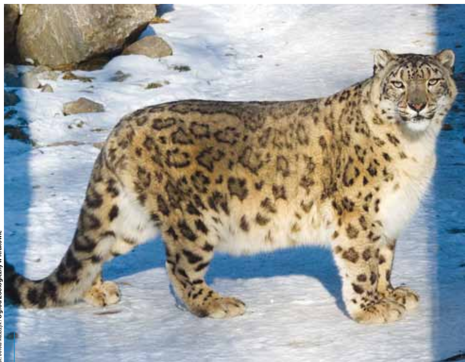
Zima to ulubiona pora roku pantery śnieżnej

Trudniej jest natomiast pomagać psom, które często są nieufne i zagubione. Tęsknota za dawnym, niekoniecznie dobrym panem, na ogół paraliżuje ich instynkty. Wyglądnięte, bląkające się w miejscu, w którym je zostawiono, z nadzieją wypatrują swych dawnych właścicieli. Zaczynając dokarmiać czworonoga, musimy mieć świadomość, że łatwo możemy zyskać jego sympatię. Samo dokarmianie jednak nie da mu domu. Jeżeli nie jesteśmy w stanie przyciągnąć i zapewnić ciepłego kąta bezdomnemu psu, najrozsądniejszą decyzją jest prośba o pomoc skierowana do krakowskiego Schroniska dla Bezdomnych Zwierząt. Schronisko, choć może być trudnym przystankiem na drodze psiego losu, zawsze jest lepszym miejscem niż śmietnik czy ulica.