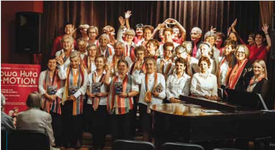
Radość na scenie – seniorzy śpiewają gospel

Ktoś, kto oglądał amerykański film „Zakonnica w przebraniu”, zapewne pamięta Whoopi Goldberg w roli siostry zakonnej dyrygującej chórem gospel. Początkowo nieśmiali chórzyści porywają swoim śpiewem sceptycznie nastawioną do ich występu publiczność. Coś podobnego wydarzyło się w ostatnich dwóch miesiącach w Krakowskim Centrum Seniora (KCS) w Nowej Hucie.