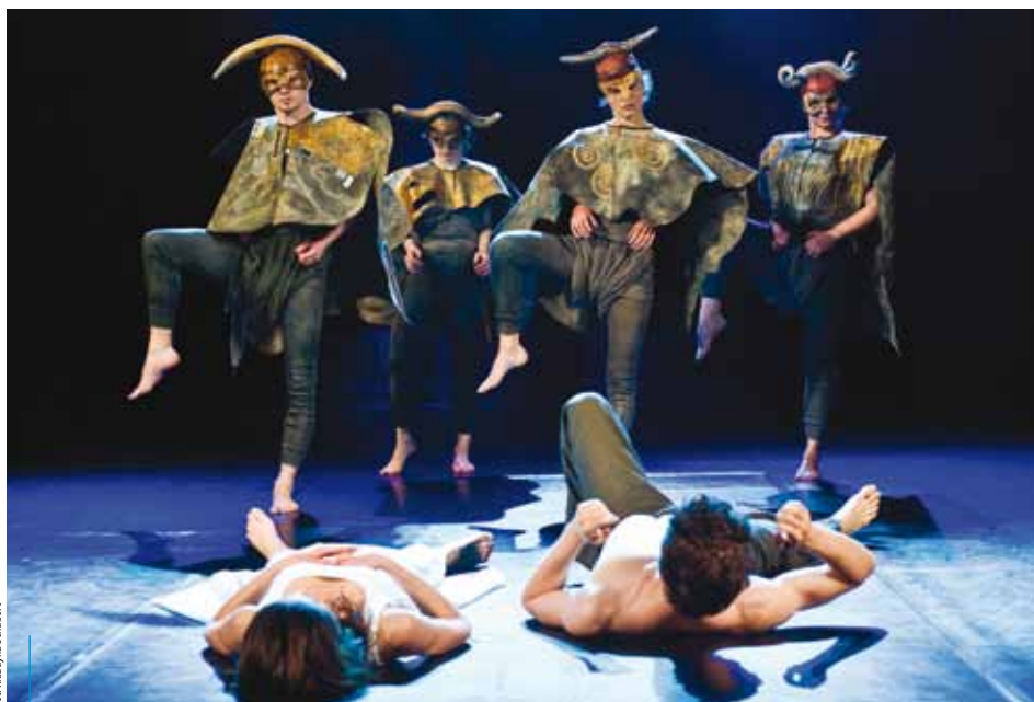
Teatr Groteska, „Przemiany”

Rusza IV edycja Nagrody Teatralnej im. Stanisława Wyspiańskiego. Już teraz każdy może zgłosić swojego ulubionego aktora, reżysera, scenografa lub spektakl. Spośród zgłoszonych nominacji Kapituła Nagrody wyłoni zwycięzcę, który otrzyma 30 tys. zł.