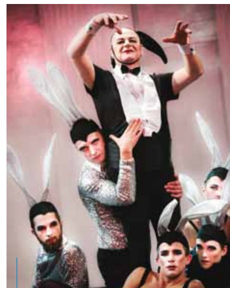
Teatr Bagatela, „Mefisto”