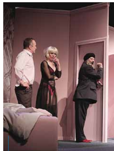
Teatr Ludowy, „Hotel Westminster”

Nagroda Teatralna im. Stanisława Wyspiańskiego zostanie wręczona tradycyjnie podczas Nocy Teatrów, która w 2015 r. odbędzie się z 13/14 czerwca. Dodatkowe informacje dotyczące zgłoszeń i nagrody można uzyskać pod nr tel.: 12 616-19-17. Szczegółowy regulamin konkursu oraz formularz wniosku (procedura KD-09) jest dostępny na stronie www.bip.krakow.pl .