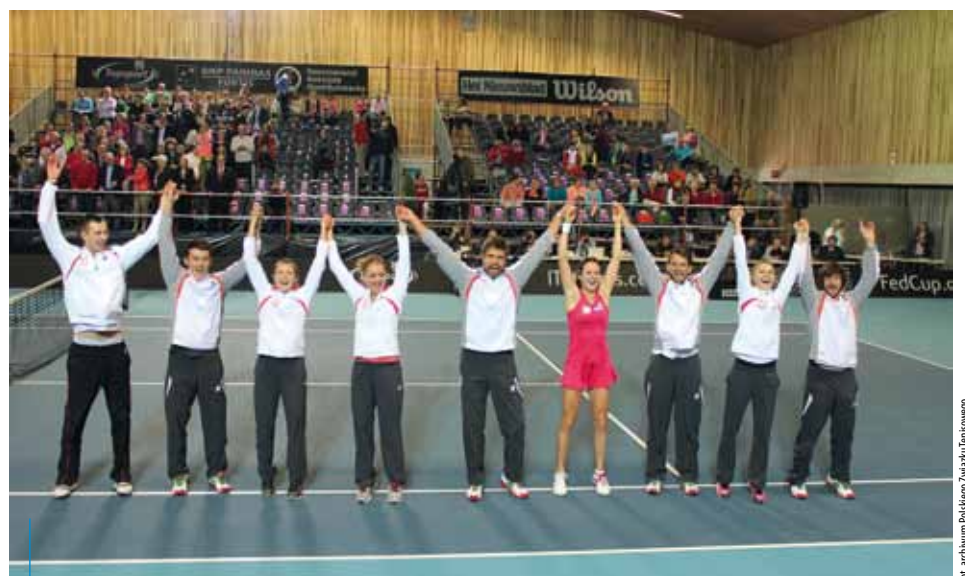
7 i 8 lutego trzymamy kiuki za biało-czerwonych!

*rzecznik prasowy / PR manager Fed Cup & Davis Cup