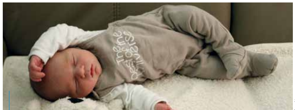
Bolek urodził się 10 października 2014 r. w Szpitalu Specjalistycznym im. S. Żeromskiego

W księgach zgonu w ubiegłym roku zarejestrowano 9402 akty.