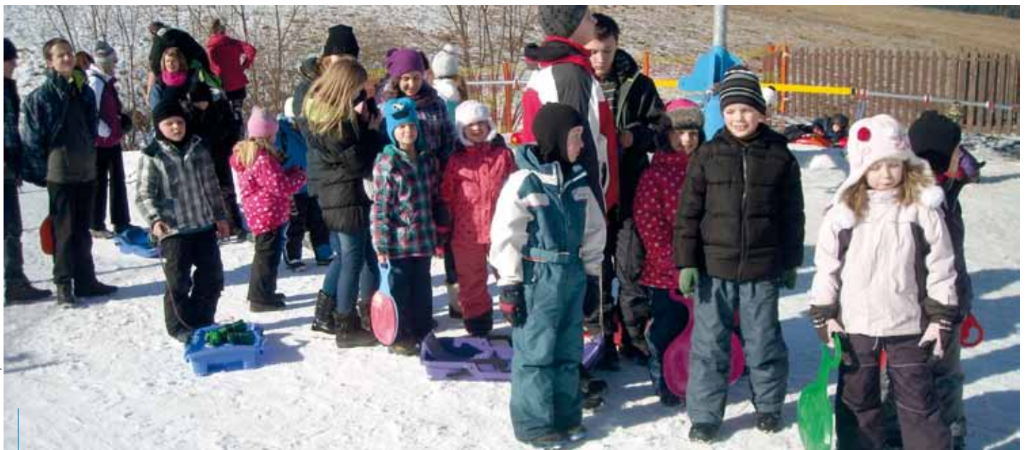
Jeśli tylko pogoda dopisze, dzieci mogą liczyć na zabawy na śniegu