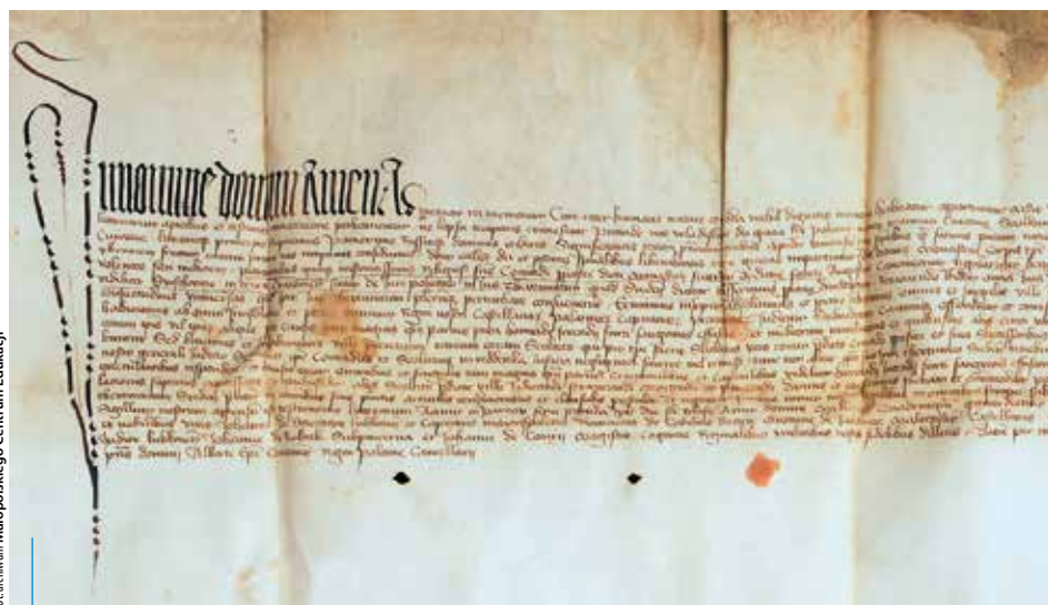
Akt lokacji Swoszowic