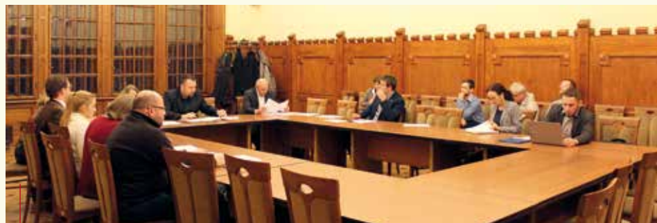
Termin głosowania to nie jedyna zmiana w budżecie obywatelskim