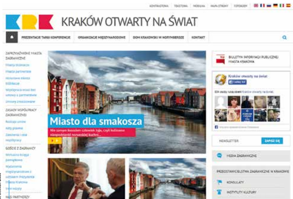
Na wortalu można znaleźć wiele ciekawostek dotyczących miast, z którymi Kraków współpracuje

Ma już sześć lat i spore grono przyjaciół. Poza tym jest ciekawski i otwarty na nowe wyzwania. Młodszy brat Magicznego Krakowa – wortal „Kraków Otwarty na Świat” – świętuje kolejne urodziny i prezentuje nową porcję ciekawostek na temat współpracy międzynarodowej naszego miasta.