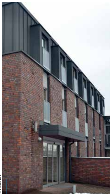
Dom Pomocy Społecznej przy ul. Łanowej 1b