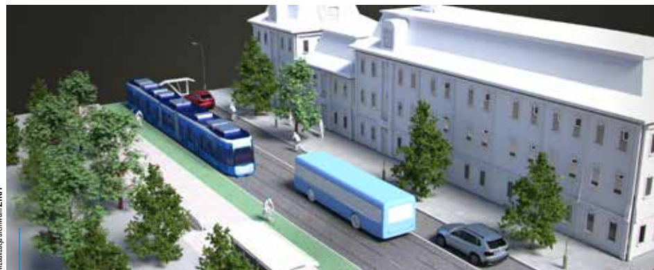
Przebudowa torowiska wokół Plant będzie przebiegała w kilku etapach