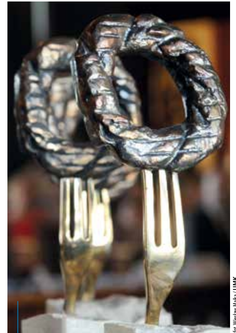
Laureaci konkursu otrzymują m.in. pamiątkowe statuetki

Restauracje wyróżnione podczas akcji promowane będą m.in.: w przewodniku po restauracjach „Kraków na Widelcu 2015”, w wyszukiwarce restauracji na stronie Miejskiej Platformy Internetowej „Magiczny Kraków”, w aplikacji mobilnej My KRK, na stronach www.krakow.travel.pl . Dodatkowe informacje: (regulaminy, karta zgłoszenia, formularze oceny, adres itp.) można znaleźć też na stornie: www.bip.krakow.pl .