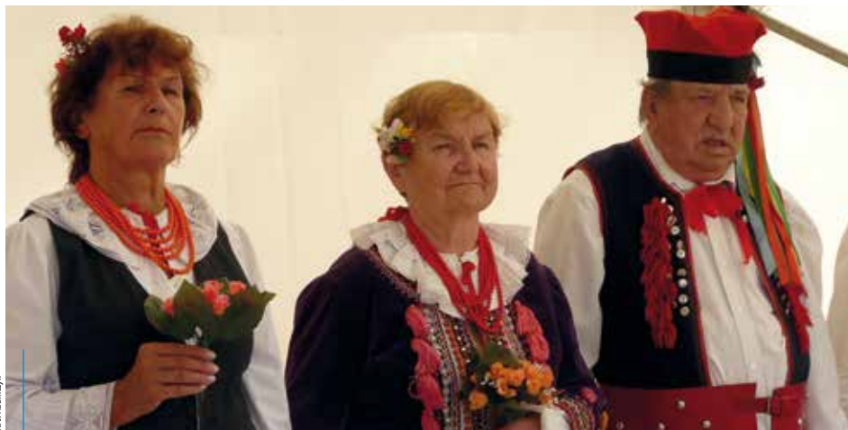
Zespół Pogodna Jesień istnieje już 43 lata

*wolontariuszka KCS, radna i zastępca przewodniczącego Rady Dzielnicy IX Łagiewniki – Borek Fałęcki