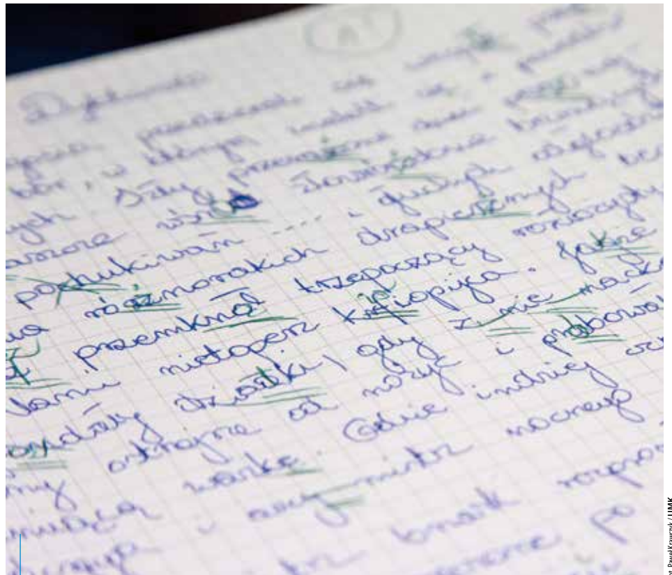
I Dyktando Krakowskie odbędzie się 14 marca

*adiunkt w Katedrze Współczesnego Języka Polskiego Wydziału Polonistyki UJ