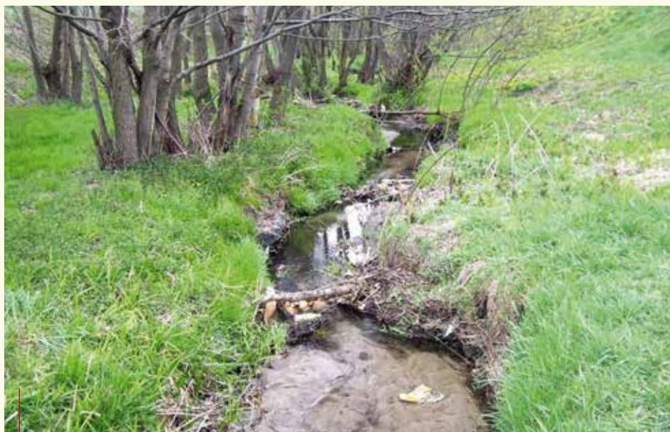
Pierwszy plan dla Drwinki powstał w 2009 r.

nienia większej ochrony dla obszarów ważnych przyrodniczo, wchodzących w skład przyszłego