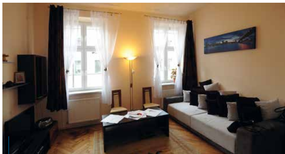
Dorastający wychowankowie pieczy zastępczej mogą liczyć m.in. na pomoc mieszkaniową