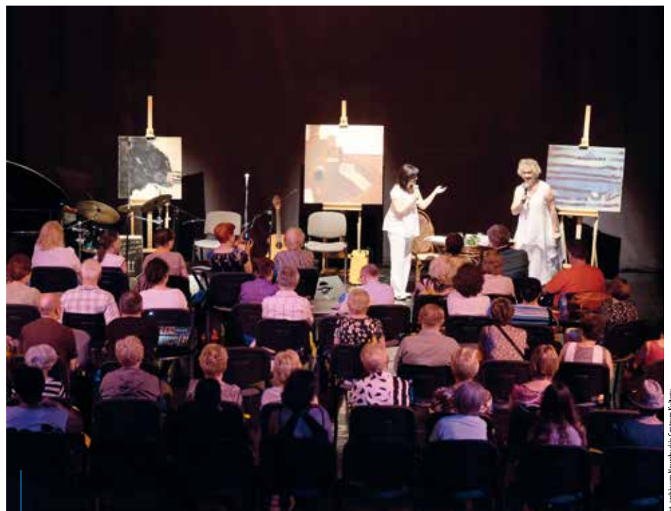
Seniorzy podczas spotkania w Nowohuckim Centrum Kultury

skie instytucje kultury równie chętnie otwierają swe podwoje dla osób starszych, a informacji o ich ofercie można szukać w internecie na stronach: www.krakow.pl oraz www.dlaseniora.krakow.pl .