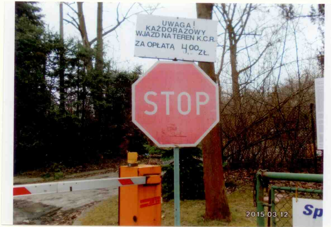
ul. Modnewiowa 22

wjazd na parking (ponad 100 miejsc parkingowych) na terenie KCR, ~ 100 m od ul. Yeleniowej. Parking ogólnodostępny.