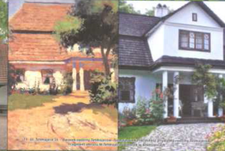
5. Pałac w Mydlnikach. Budowa w 1880 r. przez Pijarów. W 1915 r. przejęty przez Polaków. W 1945 r. zniszczony przez Niemców. W 1946 r. odbudowany. W 1950 r. konsekrowany przez biskupa Józefa Eljasza.