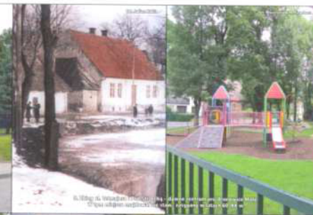
2. Pałac w Mydlnikach. Budowa w 1880 r. przez Pijarów. W 1915 r. przejęty przez Polaków. W 1945 r. zniszczony przez Niemców. W 1946 r. odbudowany. W 1950 r. konsekrowany przez biskupa Józefa Eljasza.