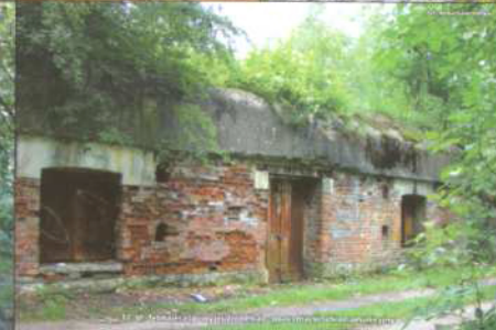
8. Pałac w Mydlnikach. Budowa w 1880 r. przez Pijarów. W 1915 r. przejęty przez Polaków. W 1945 r. zniszczony przez Niemców. W 1946 r. odbudowany. W 1950 r. konsekrowany przez biskupa Józefa Eljasza.