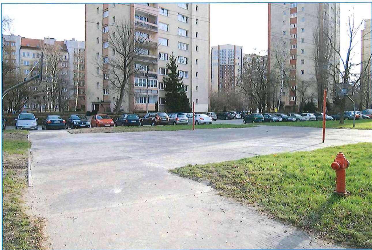
WIDOK NA BOISKO OD STRONY ULICY

LOKALIZACJĘ BOISKA PRZY ULICY BOBRZECKIEJ /ZDROWEJ ZAZNACZONO NA MAPIE KOLOREM NIEBIESKIM BOISKO ZNAJDUJĘ SIĘ NA WPROST MYJNI SAMOCHODOWEJ, TUŻ PRZY ULICY I PARKINGU(DZIAŁKA 278/19).