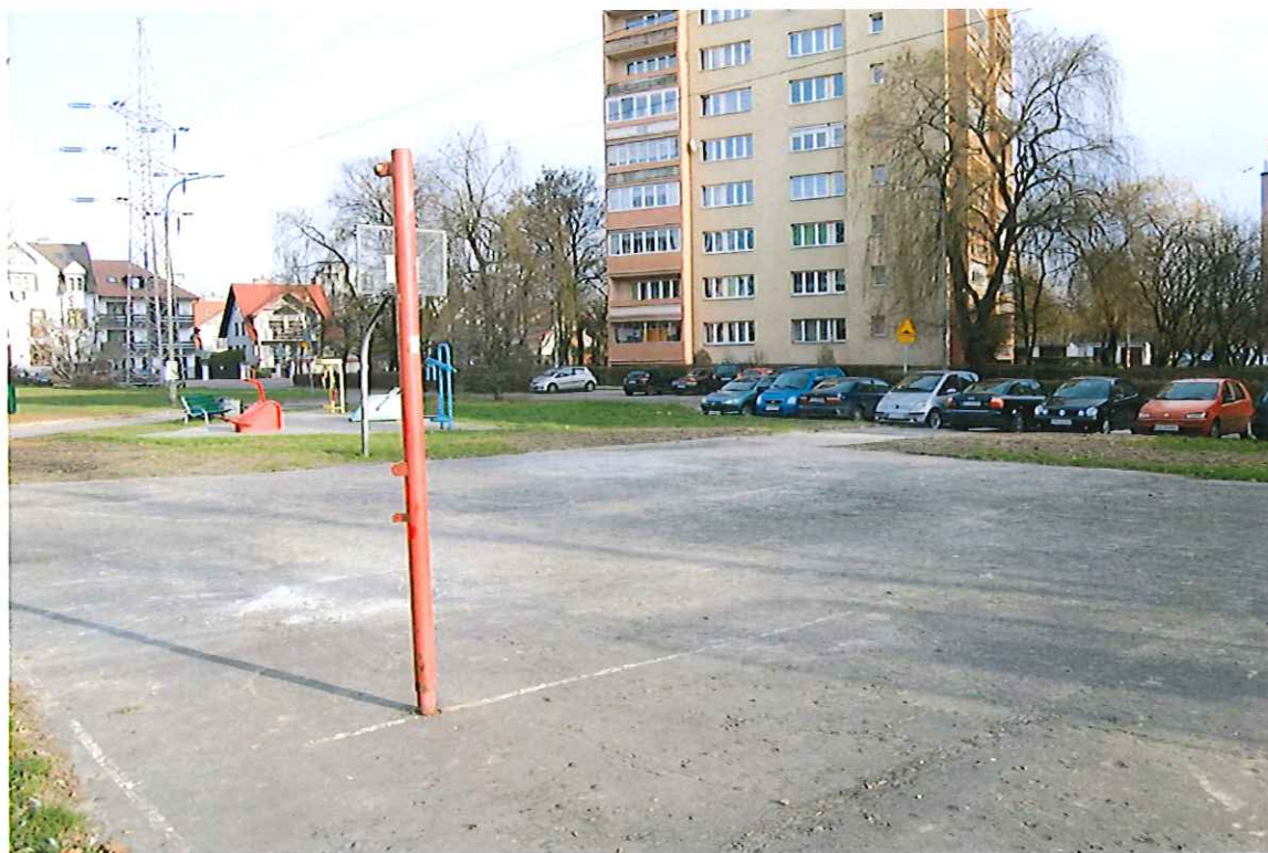
ZEPSUTE SŁUPKI UNIEMOZLIWIAJĄ GRĘ W SIATKÓWKĘ, TENISA ORAZ BADMINTONA