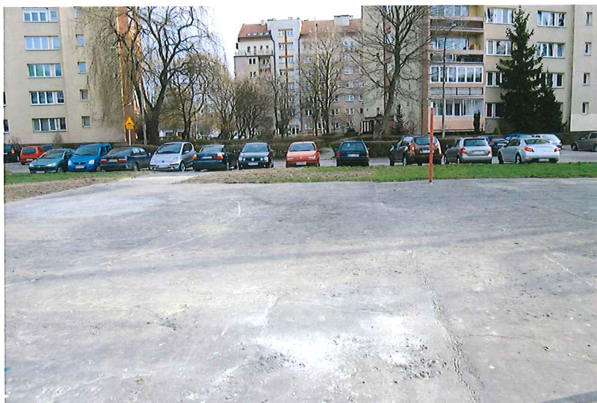
BRAK OGRODZENIA BOISKA, PARKING ZNAJDUJĄCY SIĘ TUŻ PRZY BOISKU, ZŁY STAN TECHNICZNY NAWIERZCHNI