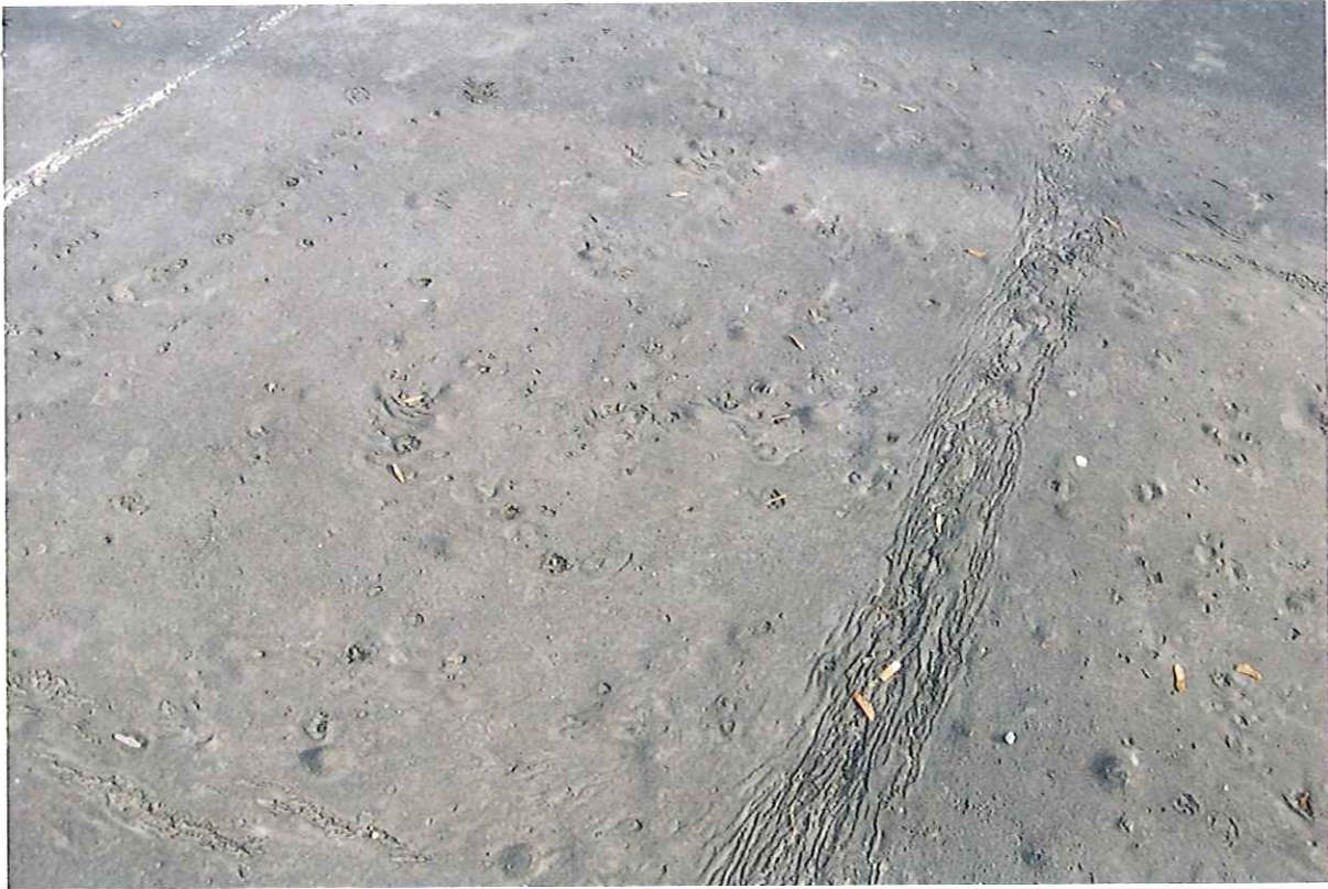
ASFALTOWA NAWIERZCHNIA BOISKA STAN OBECNY