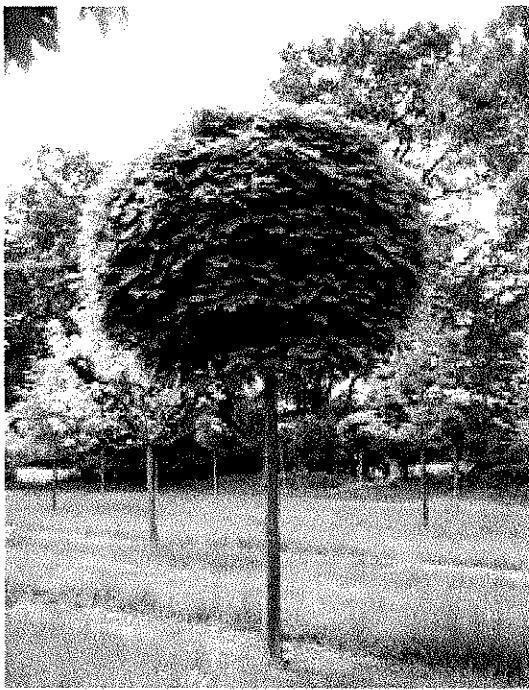
Lat. 3 Patrou slaveni - Franciseli Szeleruik