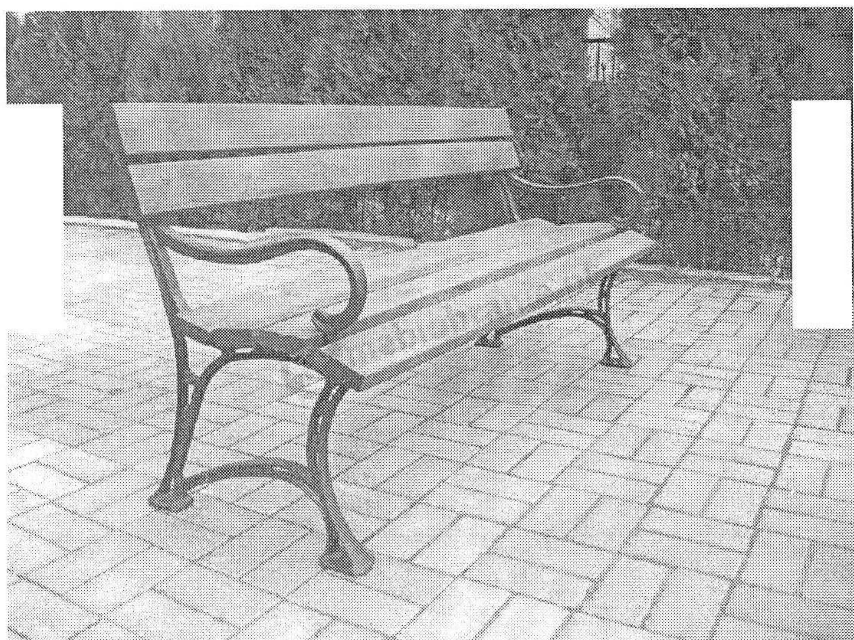
Ławka ogrodowa Królewska z podłokietnikami