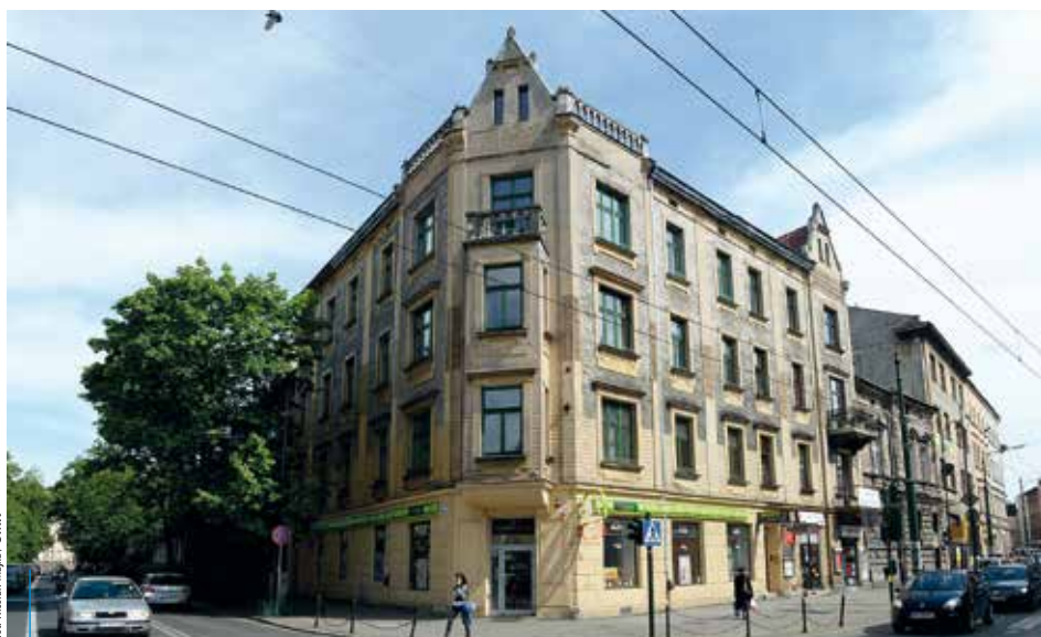
W tej kamienicy 16 maja 1911 r. popełniono morderstwo

Kamienica numer 27 przy ul. Szlak na początku ubiegłego stulecia nie odznaczała się niczym szczególnym. Dwupiętrowy budynek, o którym „Ilustrowany Kuryer Codzienny” pisał, że jest „starszego typu, bez nowoczesnego komfortu i bez tej sympatycznej schludności, do której w ostatnich czasach przywykliśmy”, zamieszkiwali ludzie raczej niezamożni.