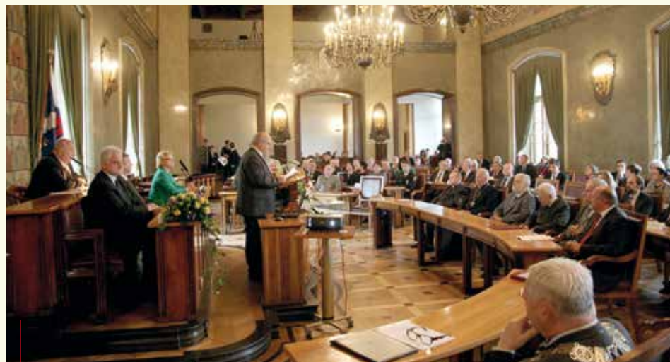
Podczas uroczystej sesji 3 czerwca wręczone zostaną medale wybite z okazji 25-lecia samorządu

prawiona zostanie tradycyjna msza za miasto. Półtorej godziny później rozpocznie się