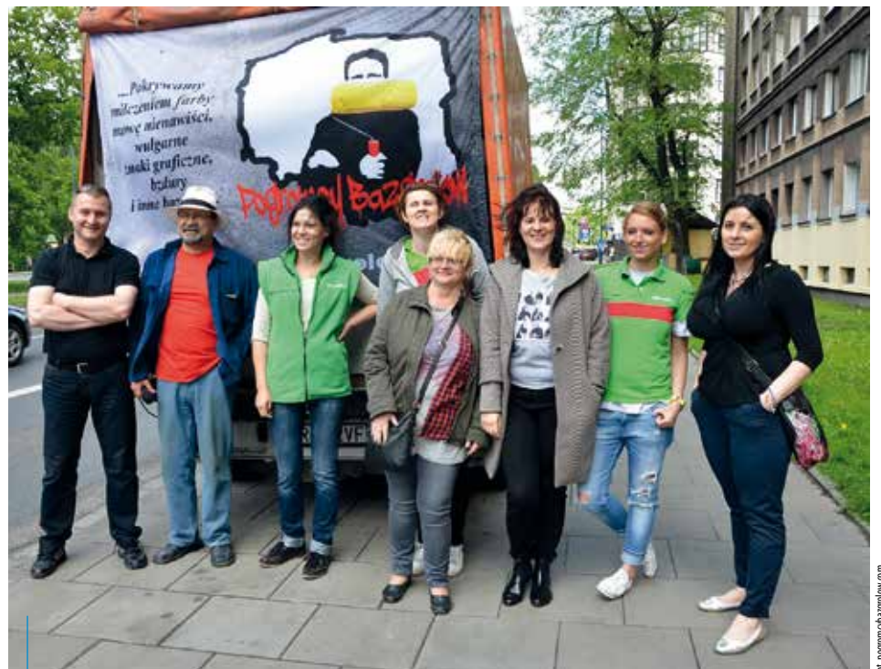
Koalicja ludzi dobrej woli: sąsiadów, artystów, a także urzędników i pracowników instytucji miejskich walczą ze szpecącym nasze miasto nielegalnym graffiti

Wszystkich, którzy chcieliby włączyć się w akcję Pogromców Bazgrołów, zapraszamy na stronę: pogromcybazgrolow.com.