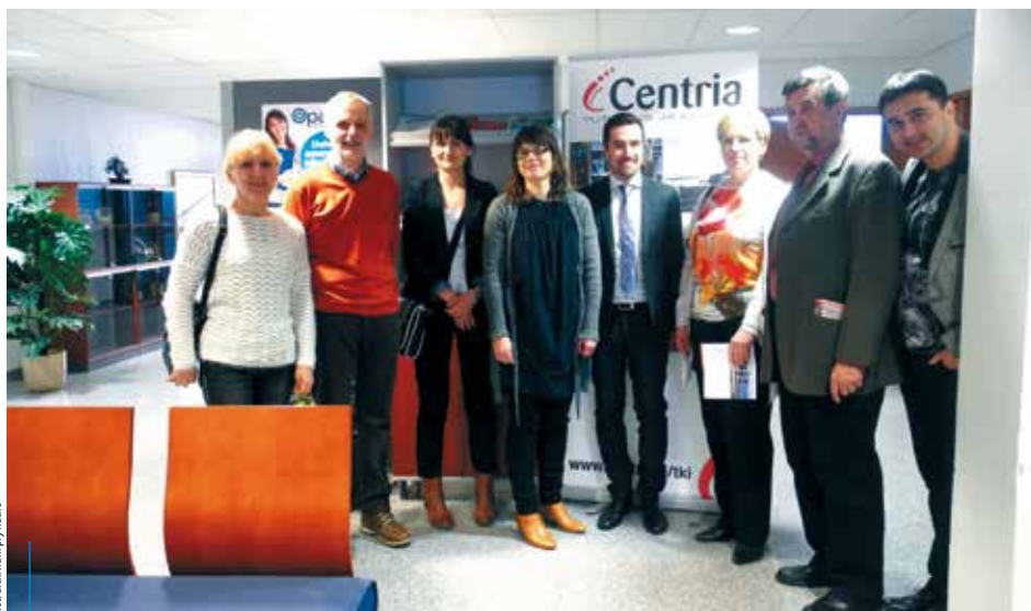
Uczestnicy wyjazdów studyjnych do Finlandii

Miasto Kraków w latach 2013–2014 realizowało przedsięwzięcie pn. „Europejski wymiar kształcenia zawodowego w Gminie Miejskiej Kraków” w ramach projektu systemowego MEN współfinansowanego przez Unię Europejską pn. „Zagraniczna mobilność szkolnej kadry edukacyjnej w ramach projektów instytucjonalnych”. Wartość dofinansowania z Europejskiego Funduszu Społecznego to aż 33 213 euro.