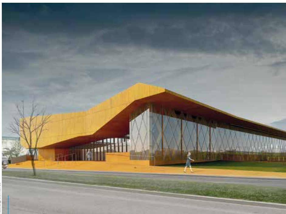
wizualizacja archiwum ZIS

Nowoczesna, kameralna z przeznaczeniem dla zawodników, ale i dla wszystkich mieszkańców Krakowa – taka ma być Hala 100-lecia KS Cracovia, która zostanie otwarta w połowie 2017 r. Obiekt w całości będzie dostosowany do potrzeb osób niepełnosprawnych i ma się stać centrum przygotowań sportowców do Igrzysk Paraolimpijskich w Tokio w 2020 r.