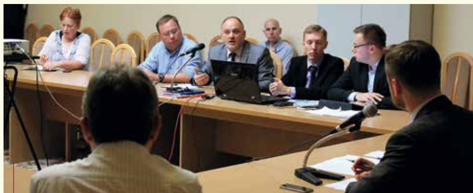
Radni z Komisji Promocji i Turystyki dyskutowali o start-upach