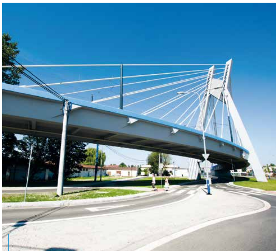
Nowa estakada tramwajowa łącząca ulice Lipską i Wielicką ma długość 2,19 km

Cały projekt na dostawę 36 fabrycznie nowych, niskopodłogowych wagonów tramwajowych ma zostać zamknięty w tym roku. Firma PESA Bydgoszcz SA zobowiązała się do dostarczenia wszystkich wagonów do połowy listopada 2015 r. Wartość kontraktu z firmą PESA to 291 240 000 zł netto. Przewidywane dofinansowanie do 36 wagonów z Funduszu Spójności to 171 831 600 zł.