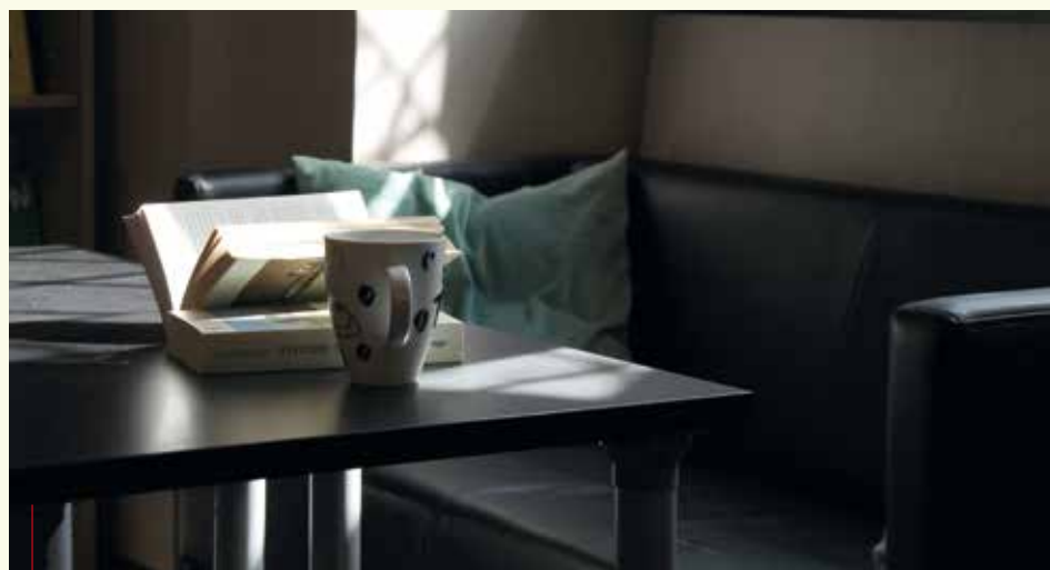
W księgarzarniach oprócz kupna książki będzie można napić się kawy lub coś przekąsić

ny Tomasz Urynowicz, który jest jednym z pomysłodawców akcji.