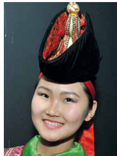
W czasie spotkania opłatkowego studenci często pokazują się w narodowych strojach