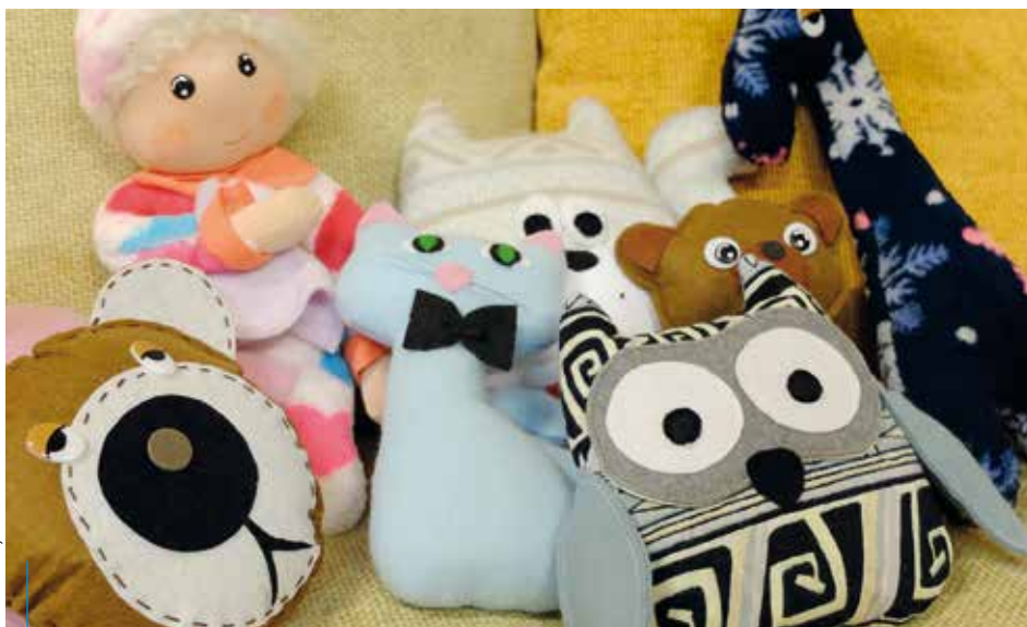
Rękodzieła w wykonaniu rodziców i nauczycieli SP im. bł. Celiney Borzęckiej