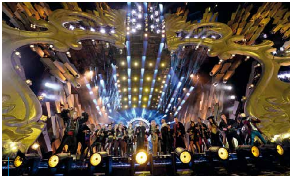
Powitaj Nowy Rok na krakowskim Rynku!