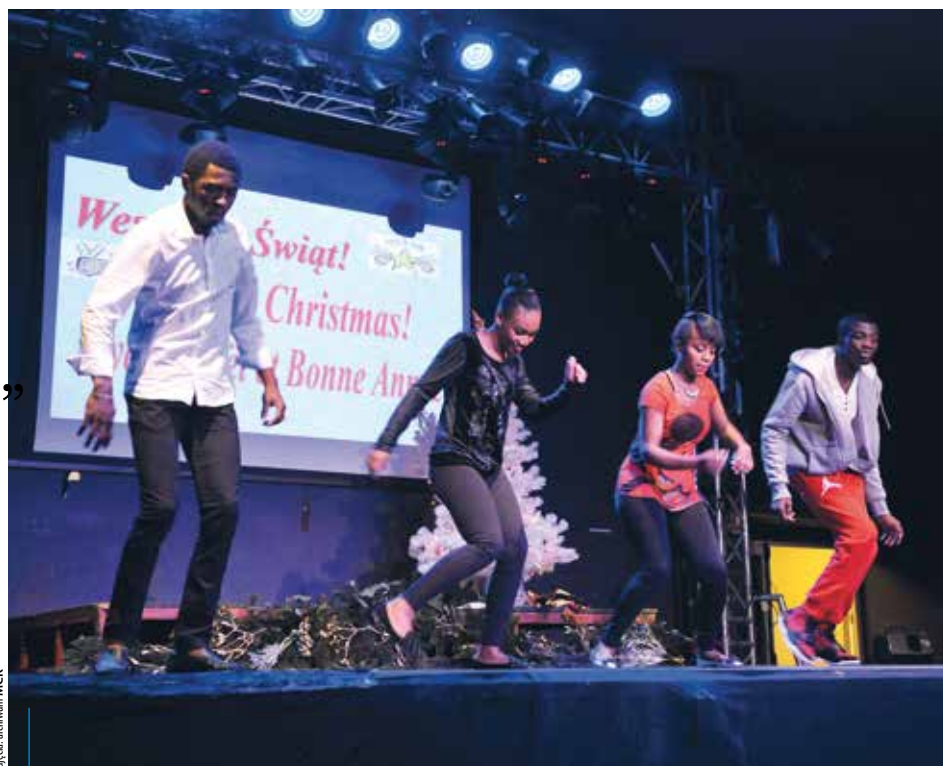
Na spotkania świąteczne studenci przygotowują specjalny program artystyczny

– Zanim trafiłam do MCK, studiowałam w Krakowie stosunki międzynarodowe. Po roku zorientowałam się, że nie odpowiada mi ten kierunek, i doszłam do wniosku, że nie chcę przez całe życie robić tego, czego nie lubię. Zrezygnowałam i postanowiłam iść na architekту-