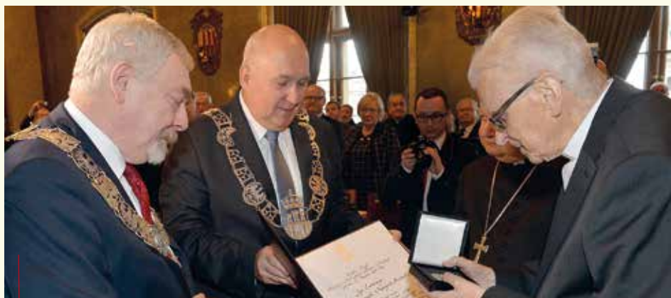
Ks. kardynał Franciszek Macharski otrzymał srebrny medal Cracoviae Merenti

czył studia na Wydziale Teologicznym Uniwersytetu Jagiellońskiego, natomiast tytuł doktora teologii pastoralnej uzyskał w 1961 r. na katolickim uniwersytecie we Fryburgu (Szwajcaria). Święcenia biskupie otrzymał w 1979 r.,