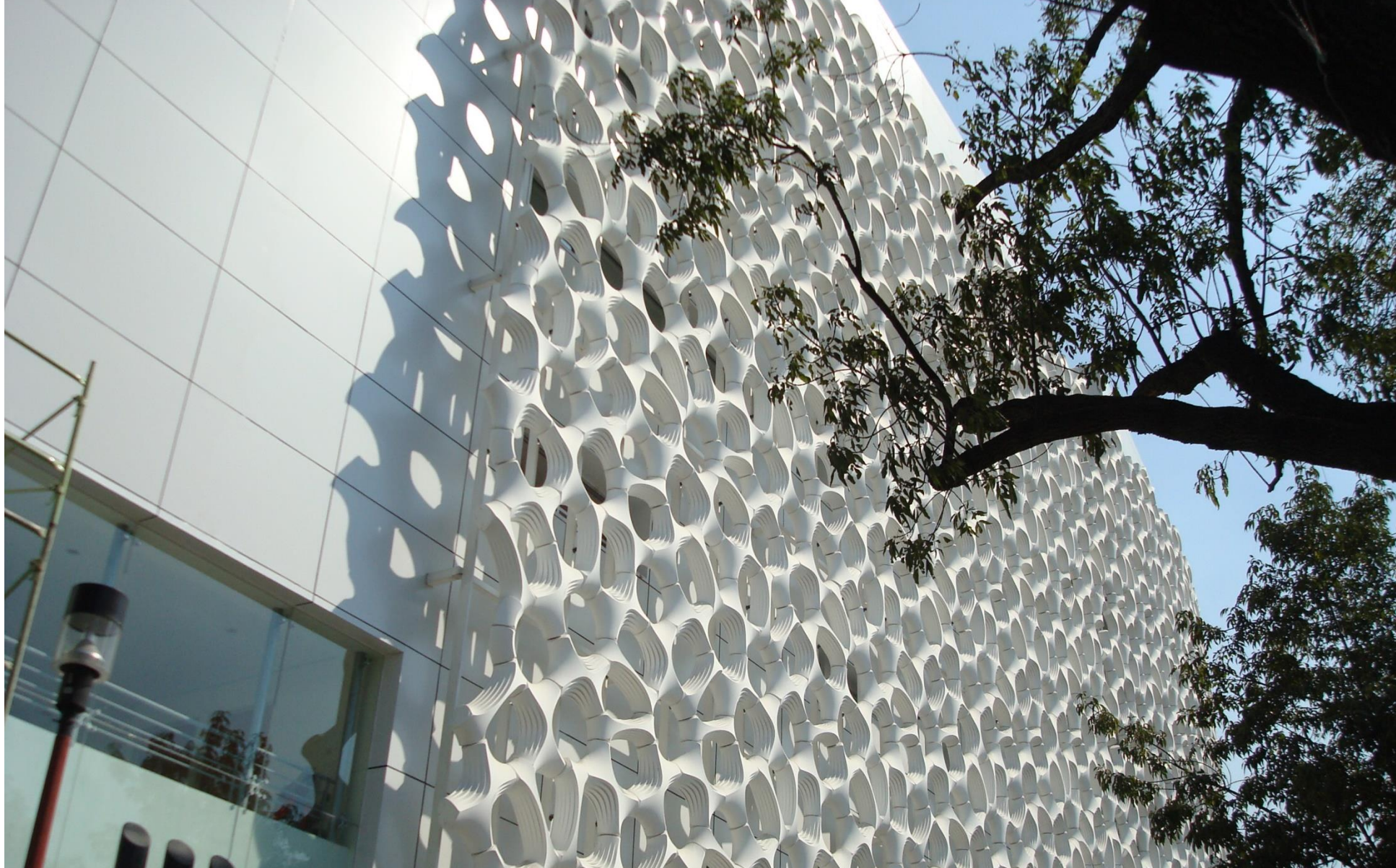
Manuel Gea Gonzalez Hospital w Mexico City