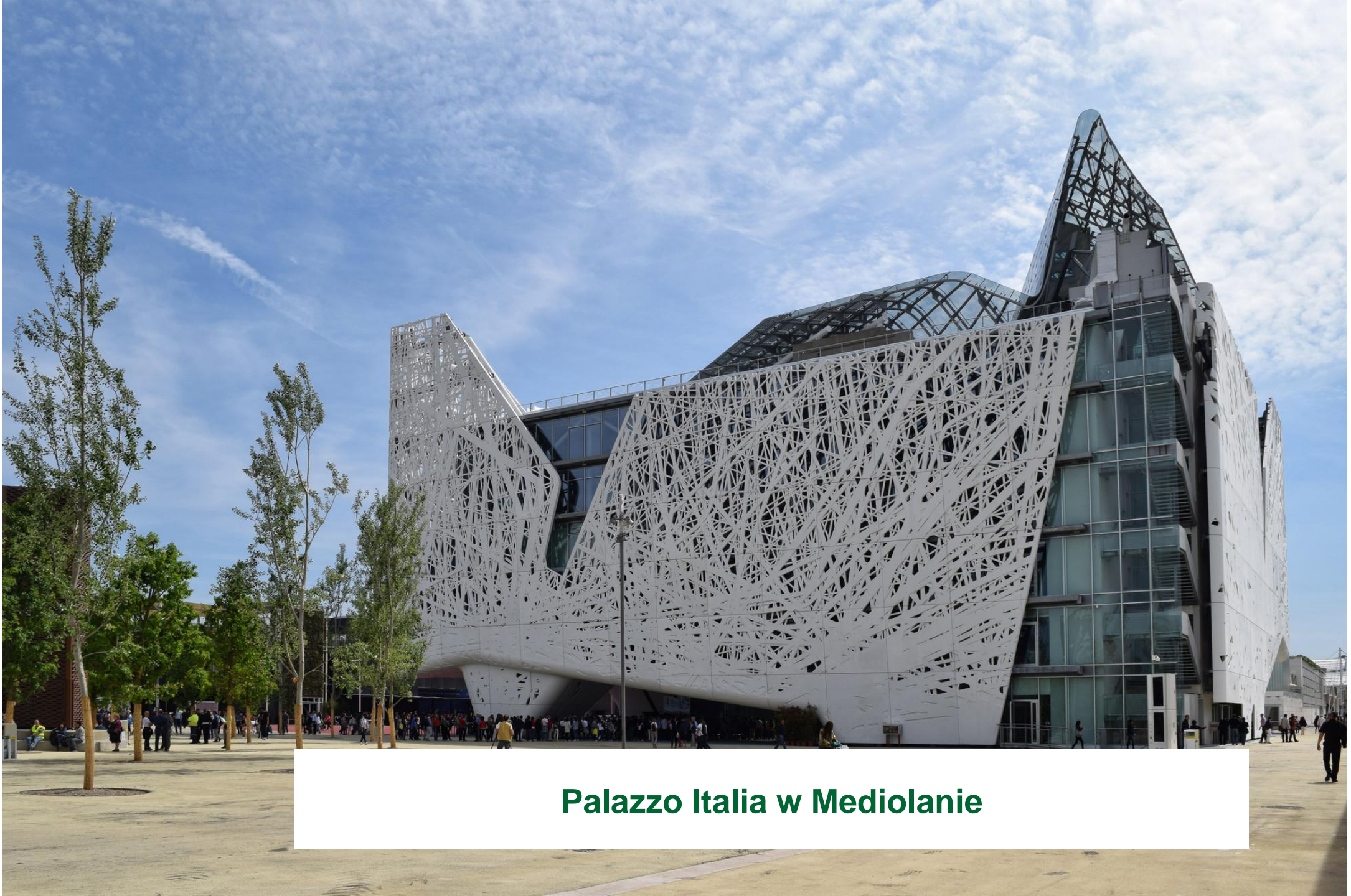
Palazzo Italia w Mediolanie