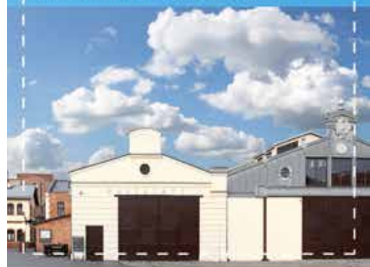
Muzeum Inżynierii Miejskiej w Krakowie