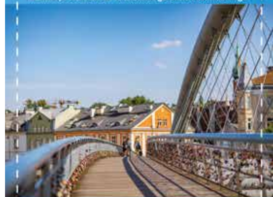
Kładka Bernardka