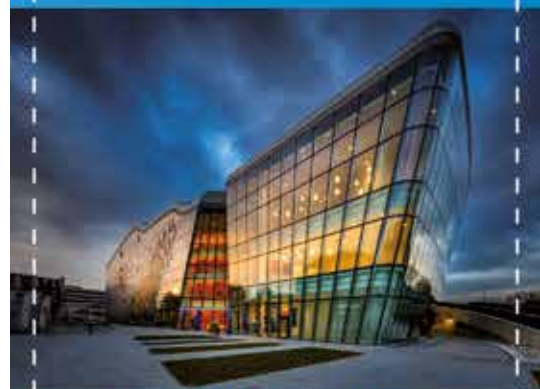
Centrum Kongresowe ICE Kraków

Wystawę będzie można oglądać na Rynku Podgórskim od 13 października do 26 października br.