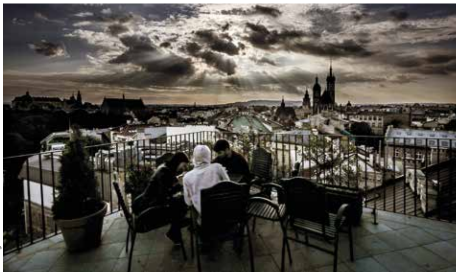
Fot. Bogusław Świerżowski