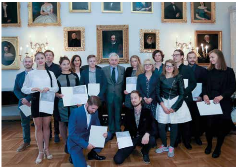
Laureaci tegorocznych Stypendiów Twórczych Miasta Krakowa