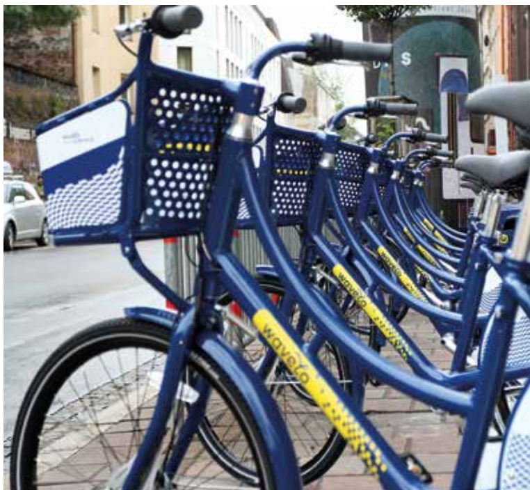
100 jednośladów oraz 15 stacji – krakowianie mogą korzystać z pierwszej pilotażowej partii rowerów „Wavelo”