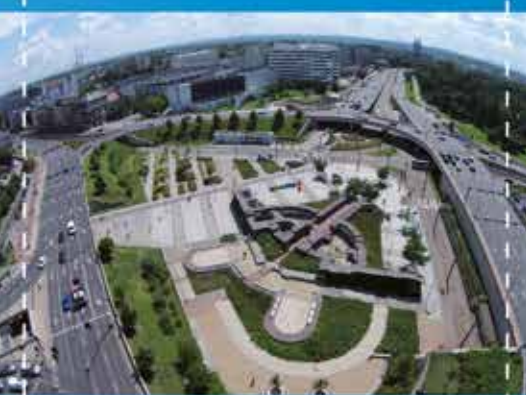
Rondo Mogiłskie

Wystawę będzie można oglądać na Rondzie Mogiłskim w dniach od 27 października do 9 listopada br.