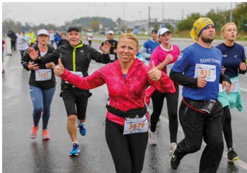
III Królewski Półmaraton ukończyło 7079 zawodników!