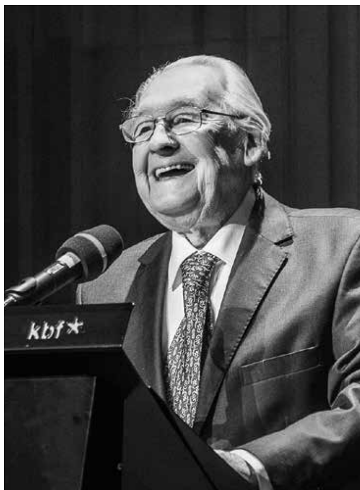
Andrzej Wajda (1926–2016)

Wraz z Nim utraciliśmy ważną cząstkę naszego życia...”