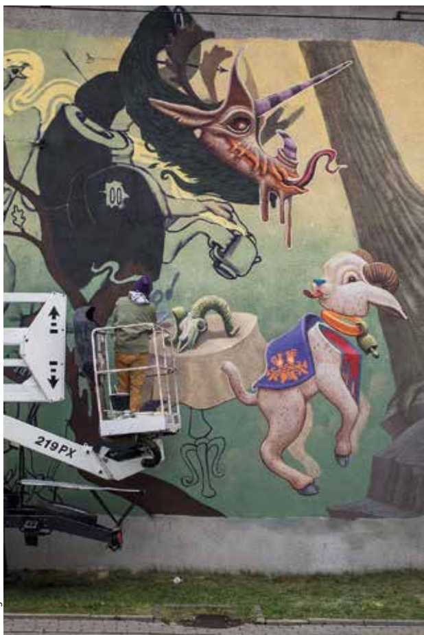
Hiszpański smok na rondzie Mogilskim