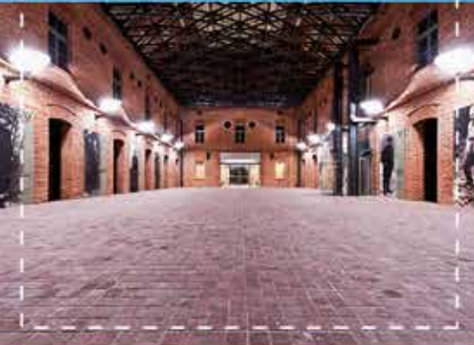
Muzeum Armii Krajowej, fot. ze zbiorów MAK