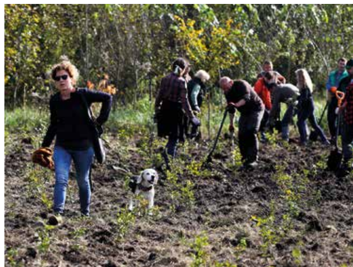
Jesienne zalesianie w Toniach