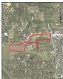
ul. Księcia Józefa