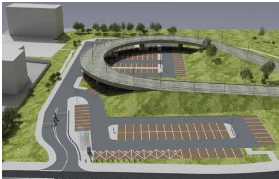
Parking P&R Kurdwanów

Jakie jeszcze inwestycje zaplanowano w Krakowie na najbliższy czas? Lista jest długa i różnorodna. Kilka pozycji to projekty budowy bloków mieszkalnych. Budynki wielorodzinne mają powstać przy ulicach Fredry, Przyby i Zalesie oraz Wańkowicza. W pierwszym przypadku chodzi o 50 lokali o łącznej powierzchni 1800 m kw. Przy ulicach Przyby i Zalesie powstanie 10 bloków z 350 lokalami mieszkalnymi – łączna powierzchnia to 15 630 m kw. – i dwoma lokalami użytkowymi o powierzchni 580 m kw. Plan dotyczący ul. Wańkowicza zakłada siedem bloków, a w nich 170 mieszkań o łącznej powierzchni użytkowej 6910 m kw.