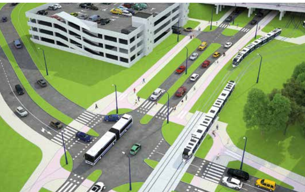
Linia tramwajowa KST (os. Krowdrza Górka – Azory)