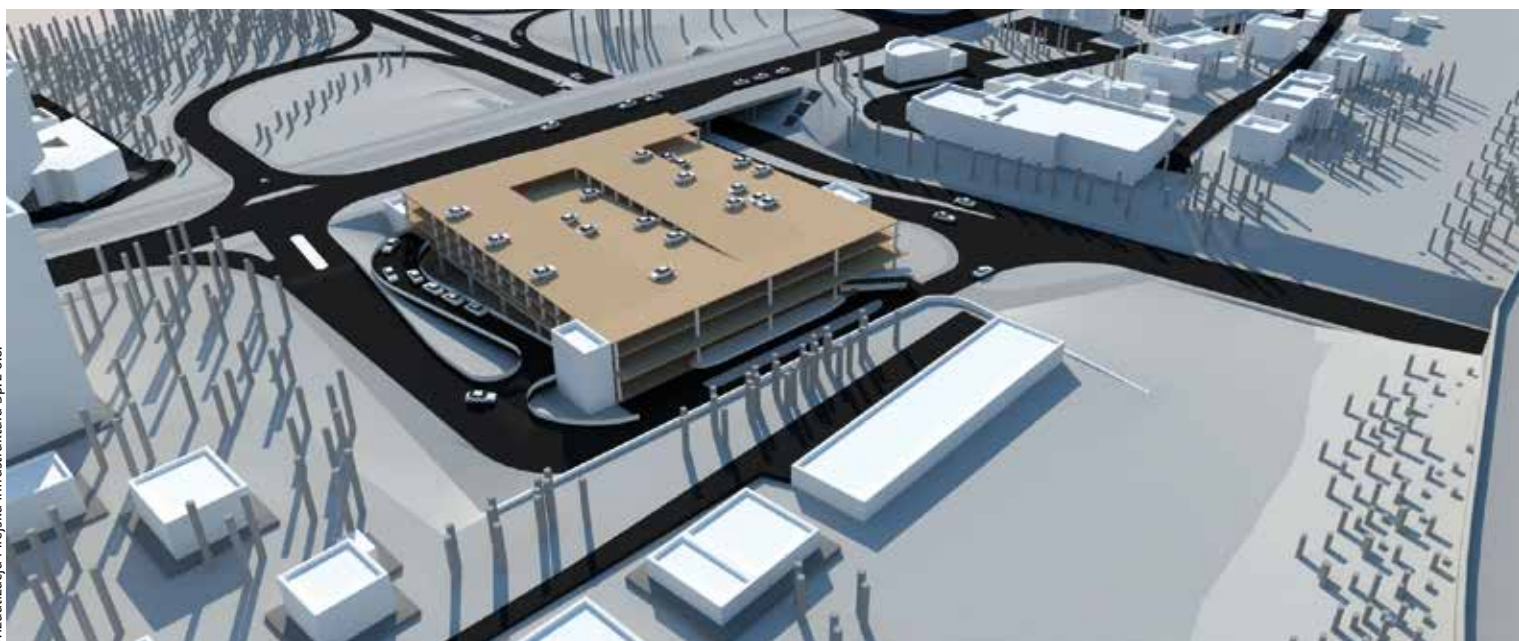
wizualizacja Miejska Infrastruktura Sp. z o.o.

– Jeśli chodzi o podział pieniędzy z UE, po 2020 r. priorytety będą zupełnie inaczej ustawione – na działania innowacyjne, badawcze czy też projekty ogólnoeuropejskie, międzynarodowe pod ogólnym hasłem „smart city”, czyli inteligentne miasto – zauważa dyrektor Biura Funduszy Europejskich. – Kraków też to próbuje robić. To są ważne działania, ale dość wysublimowane dla tych, którzy wciąż uzupełniają braki w podstawowej infrastrukturze.