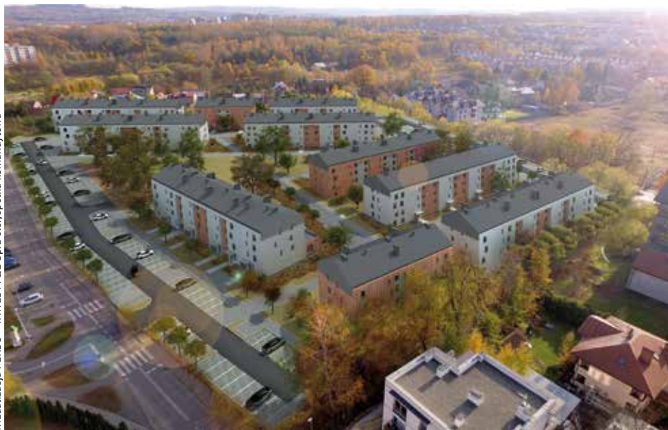
wizualizacja PERBO – INWESTYCJE Sp. z o.o., spółka komandytowa