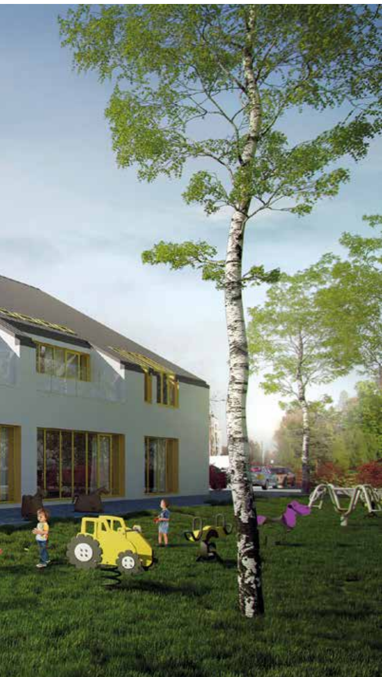
wizualizacja: Joanna Klusak architekt / Złobek przy ul. Lipskiej

S truktura wydatków budżetu miasta Krakowa w 2017 r. związanych z programami inwestycyjnymi doskonale odzwierciedla kierunek polityki inwestycyjnej, jaki Kraków obrał kilka lat temu. Najważ-