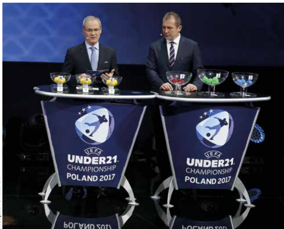
Mistrzostwa Europy w Piłce Nożnej U21 odbędą się w dniach 16–30 czerwca 2017

– Krakowski Festiwal Piłkarski to sposób na promocję EURO U21, który przynosi widoczne korzyści. Zachęcamy dzieci do aktywności sportowej i pomagamy im przetrzeć szlaki w międzynarodowych turniejach – podkreśla doradca prezydenta Krakowa ds. sportu Janusz Kozioł. W ubiegłorocznych imprezach piłkarskich organizowanych w ramach Festiwalu wzięło udział ok. 2,5 tys. dzieci – w tegorocznej edycji będzie ich jeszcze więcej.