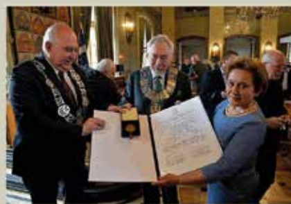
Brązowy Medal Cracoviae Merenti dla Studenckiego Komitetu Solidarności