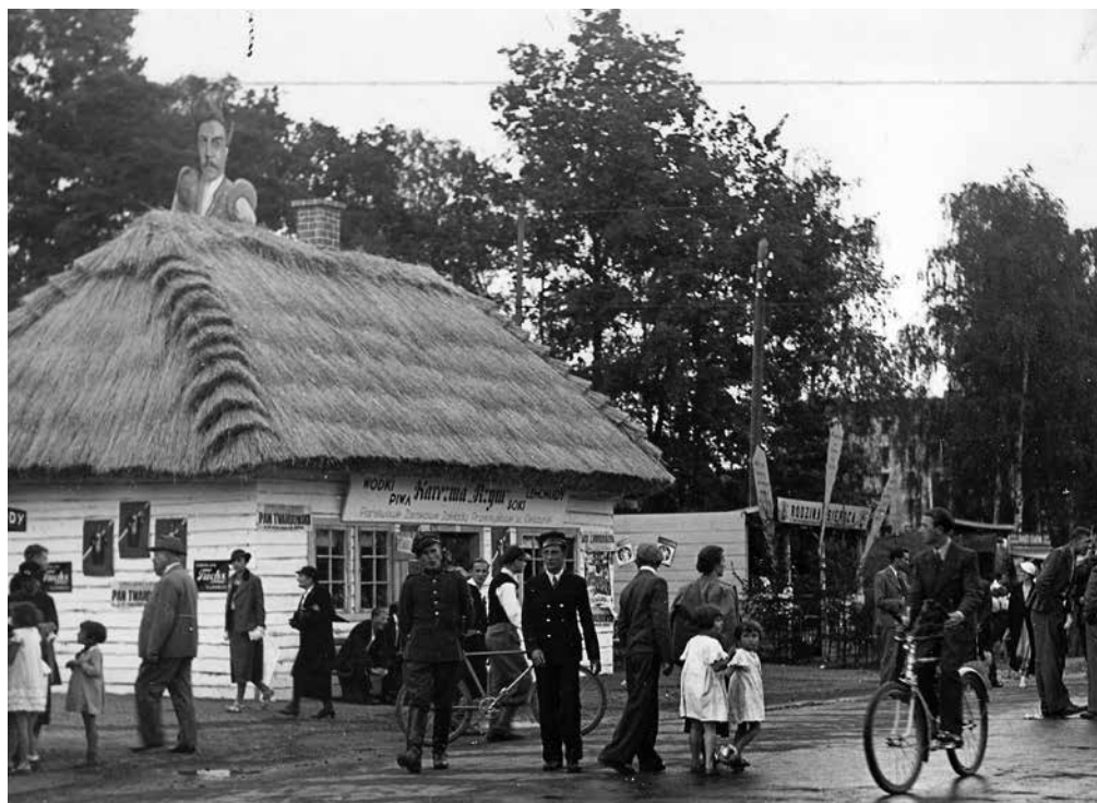
Wesołe miasteczko w parku Jordana – widoczna karczma Rzym z postacią Twardowskiego na dachu, fot. Agencja Fotograficzna „Światowid”, 1936, ze zbiorów MHK

Jednak rzeczywistość zaskrzeczy czasem w najbardziej nieodpowiednim momencie. Otóż we wspomnianym wyżej koncercie nie