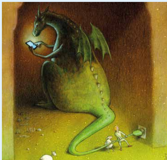
rys. Paweł Kuczyński