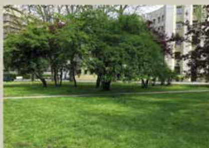
Skwer przy Domu Studenckim Żaczek imienia Studenckiego Komitetu Solidarności