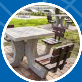
Budowa kącika rekreacyjnego przy al. Focha 39 – 26 000 zł