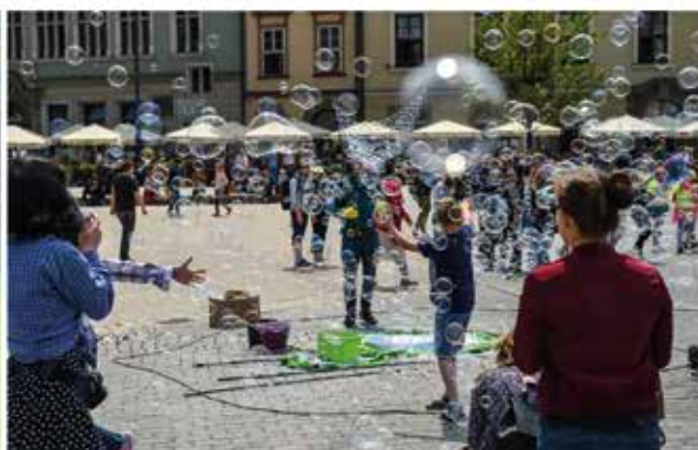
Bąbelkowy zawrót głowy