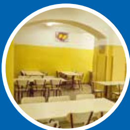
Remont jadalni i kuchni w Szkole Podstawowej nr 72 – 13 500 zł