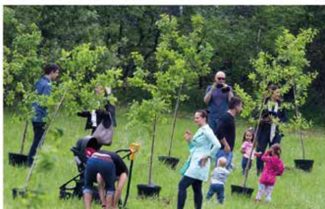
Sadzenie drzew w pierwszym Parku Krakowian