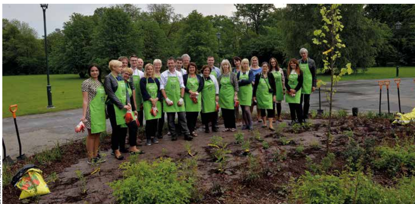
Na zakończenie seminarium jego uczestnicy zasadzili przywiezione przez siebie rośliny na rabacie w parku Jordana

23 maja, na zakończenie seminarium, jego uczestnicy zasadzili przywiezione przez siebie rośliny na rabacie w parku Jordana. Skwer, na pamiątkę tego spotkania nazwany rabatką miast partnerskich, będzie widocznym znakiem naszej współpracy. W jego centrum zasadzona została lipa – jedna ze 100 oryginalnych sadzonek osiemnastowiecznego gatunku z Göteborga, przesłana do Krakowa jako wyraz przyjaźni między miastami. Niech będzie trwała i odporna jak to szwedzkie drzewo.