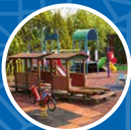
Renowacja ogródka jordanowskiego Przedszkola nr 145 – 67 600 zł