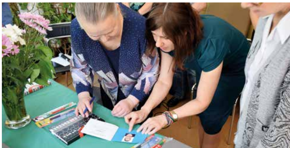
Podpisanie indeksów podczas uroczystości ślubowania

Dom Pomocy Społecznej na os. Szkolnym 28 przeznaczony jest dla 50 par chorujących psychicznie, a w Domu na os. Sportowym, który jest jego filią, mieszka 50 osób chorujących somatycznie. Brawo seniorzy!