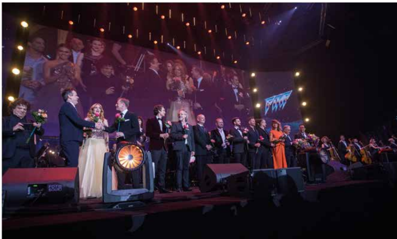
Festiwal Muzyki Filmowej