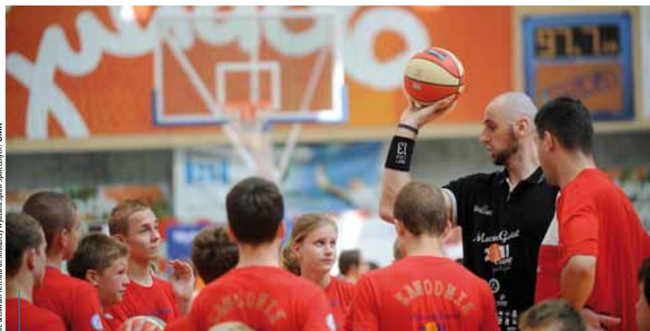
Juliada to tysiące uczestników i sportowe gwiazdy...