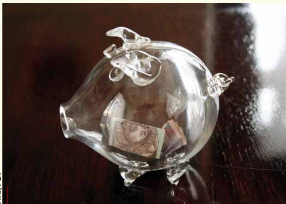
Skarbonka dyscyplinuje radnych podczas sesji

Co się stanie, gdy brzuch szklanego zwierzątka zapełni się gotówką? – Na pewno przekażemy te pieniądze na jakiś zbożny cel. Najprawdopodobniej wesprzemy instytucję działającą na rzecz dzieci – przewiduje przewodnicząca.