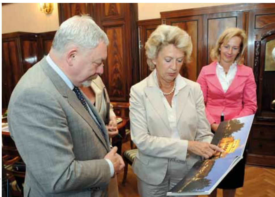
Burmistrz Petra Roth gościła w Krakowie w czerwcu 2011 r. przy okazji obchodów 20-lecia partnerstwa Krakowa i Frankfurtu

Kraków miał okazję gościć burmistrz Petrę Roth w czerwcu 2011 r. Wtedy też, z okazji obchodów 20-lecia partnerstwa Krakowa i Frankfurtu, na murach Wawelu została wyświetlona okolicznościowa polsko-niemiecka projekcja, której towarzyszyła muzyka. Po powrocie do Frankfurtu pani nadburmistrz napisała do prezydenta Jacka Majchrowskiego: „Pańskie piękne, tętniące życiem miasto wywarło na mojej delegacji i na mnie wielkie wrażenie. Autentyczna przyjaźń stała się w nim naszym udziałem”.