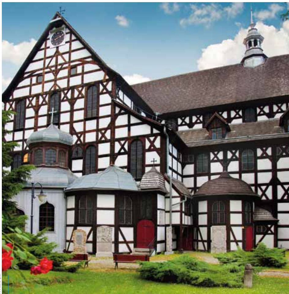
Kościół Pokoju w Świdnicy

– A bary mleczne będziecie jeszcze robić? – takie pytanie wraca do biura Capelli Cracoviensis w ostatnich miesiącach coraz częściej. Czy to dlatego, że idzie lato, a z nim potrzeba zabawy i eksperymentu? W każdym razie odpowiedź brzmi: tak!