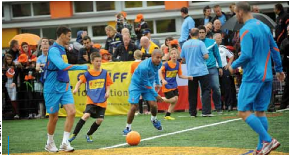
Uczniowie SP nr 93 mogli zagrać w piłkę z najlepszymi zawodnikami drużyny holenderskiej

*rzecznik prasowy Zarządu Infrastruktury Sportowej w Krakowie