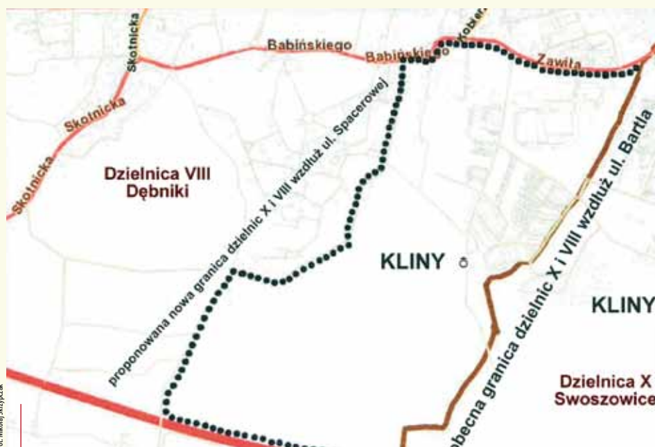
Wizualizacja istniejącej i proponowanej granicy dzielnic VIII i X

Istniejący od 21 lat podział administracyjny jednostek pomocniczych ulegnie zmianom. Trwają konsultacje społeczne. Postanowiliśmy przyrzeć się zapowiadanym korektom i zapytać u źródła, jak wpłyną one na życie mieszkańców miasta.