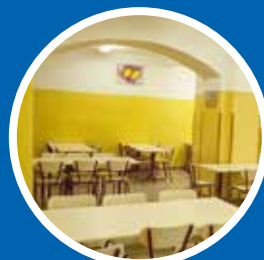
Remont jadalni i kuchni w Szkole Podstawowej nr 72 – 13 500 zł