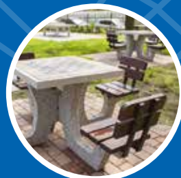
Budowa ławki rekreacyjnej przy al. Focha 39 – 26 000 zł