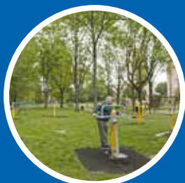
Instalacja urządzeń do ćwiczeń dla dorosłych na terenie Plant Bieńczyckich – 100 000 zł