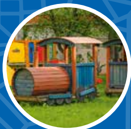
Rewitalizacja ogrodu przy Centrum Młodzieży im. dr. H. Jordana – 60 000 zł