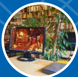
Modernizacja filii nr 20 Podgórskiej Biblioteki Publicznej – 15 000 zł