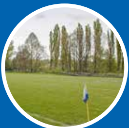
Renowacja boiska nr I w kompleksie Stadionu Miejskiego Hutnik Kraków – 100 000 zł