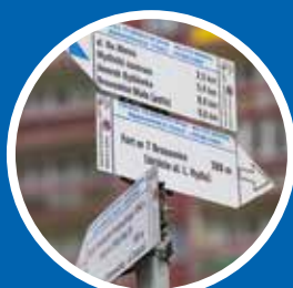
Odnowienie znakowania trasy turystyczno- -kulturowej Bronowice Małe-Mydlniki – 3500 zł