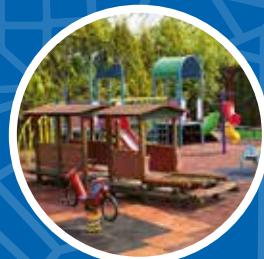
Renowacja ogrodnika jordanowskiego Przedszkola nr 145 – 67 600 zł