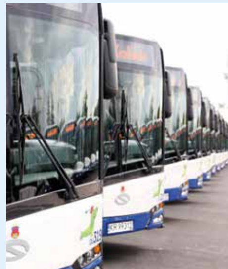
Innowacje w środowisku to m.in. ekologiczne autobusy

Radnych najbardziej zainteresował projekt „Geoplazma”, który rozpoczął się w sierpniu 2016 r. Program zakłada zbadanie potencjału geotermalnego w Krakowie. Po przeprowadzeniu wstępnych badań źródła geotermalne odkryto w Przylasku Rusieckim, jednak okazało się, że znajdująca się w nich woda ma zbyt niską temperaturę, aby móc ją wykorzystać. Mimo to analizy będą jeszcze przeprowadzane w innych częściach miasta, a sam projekt ma trwać do 2019 r.