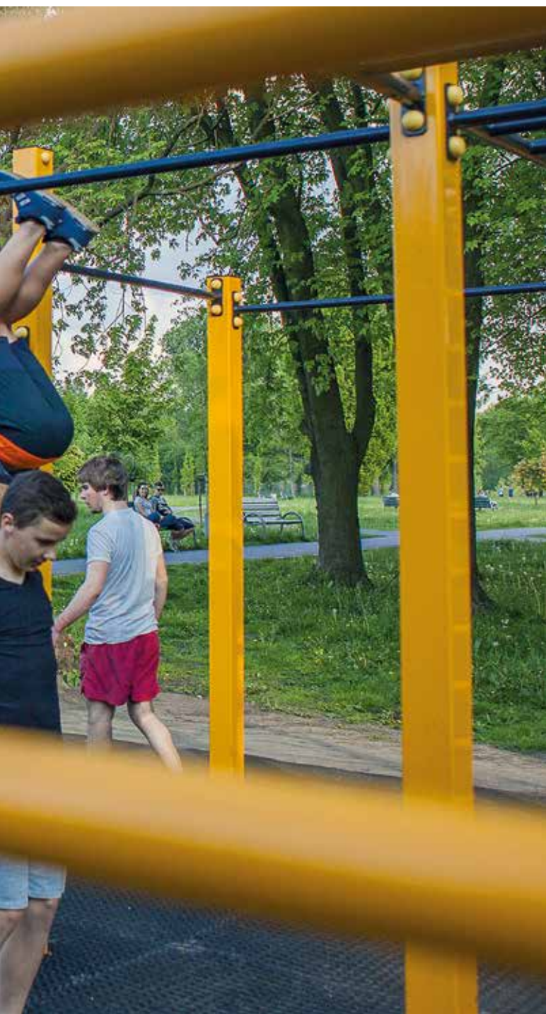
Street workout w parku Lotników Polskich, zwycięski projekt BO w 2014 r.

G ospodarowanie miastem nie może być już prostsze. Od 17 czerwca wszyscy krakowianie mogą głosować na projekty budżetu obywatelskiego, którego efekty coraz częściej widać w dzielnicach Krakowa.