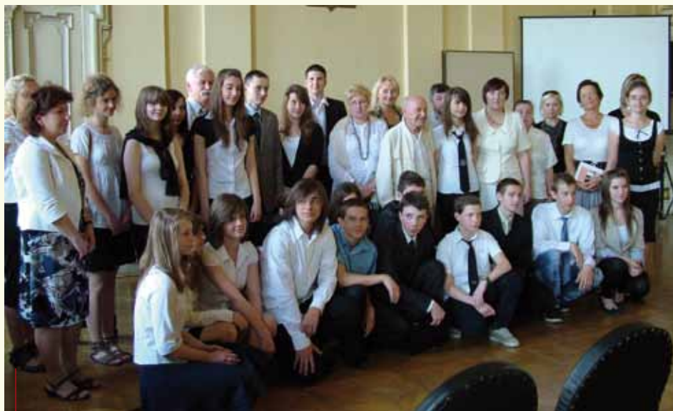
Uczestnicy ubiegłorocznych zmagani z ortografią

dobierany jest tak, by był ciekawy, a jednocześnie dotyczył jakiegoś fragmentu naszej historii. W zeszłym roku gimnazjaliści zajmowali się dwudziestolecie dzielnic, a w tym – historią pl. Bohaterów Getta. Z okazji okrągłej rocznicy organizatorzy konkursu planują wydanie publikacji zbierającej dotychczasowe dyktanda i krzyżówki ortograficzne oraz informacje o kolejnych edycjach imprezy.