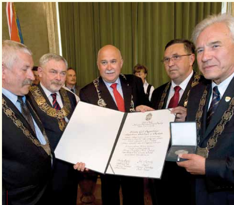
Uroczysta sesja RMK. W roli głównej Małopolski Cech Rzemieślników i Przedsiębiorców Budowlanych w Krakowie

W drugiej części obchodów jubileuszu, po prezentacji krótkiego filmu o pracy i oczekiwaniach rzemieślników oraz przedsiębiorców budowlanych, a także po występie Zespołu Pieśni i Tańca Małe Słowianki, wręczono odznaczenia z okazji jubileuszu 500-lecia Małopolskiego Cechu Rzemieślników i Przedsiębiorców Budowlanych.