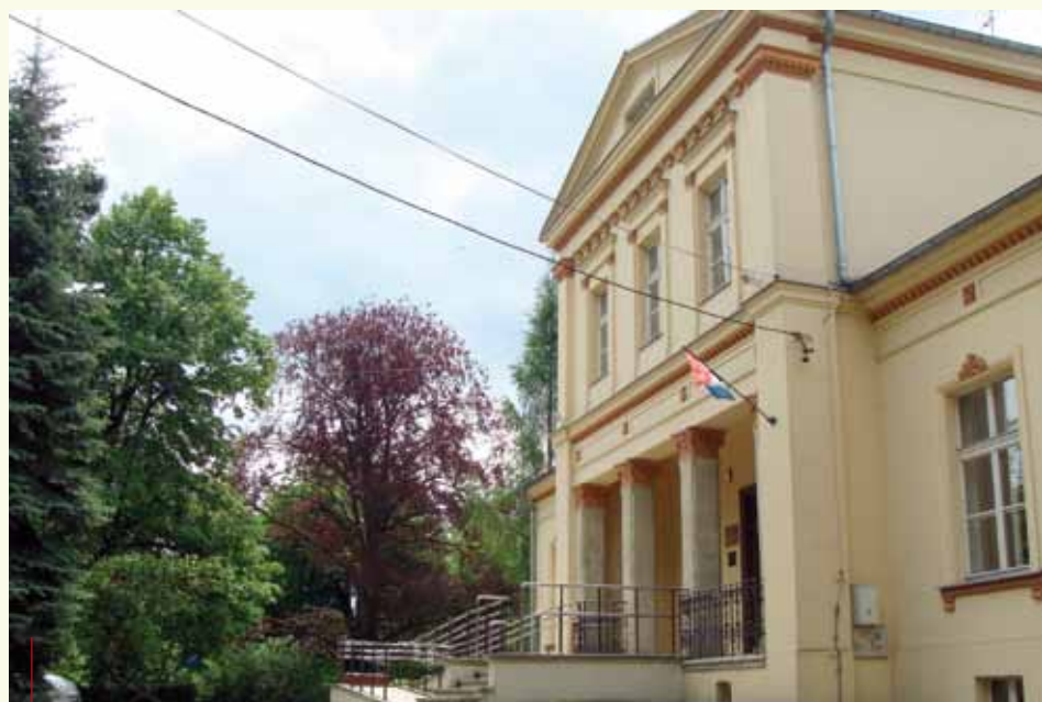
Dwór Czeczów w Starym Bieżanowie

Więcej informacji oraz plan obchodów można znaleźć na stronie http://www.800latbiezanowa.pl .