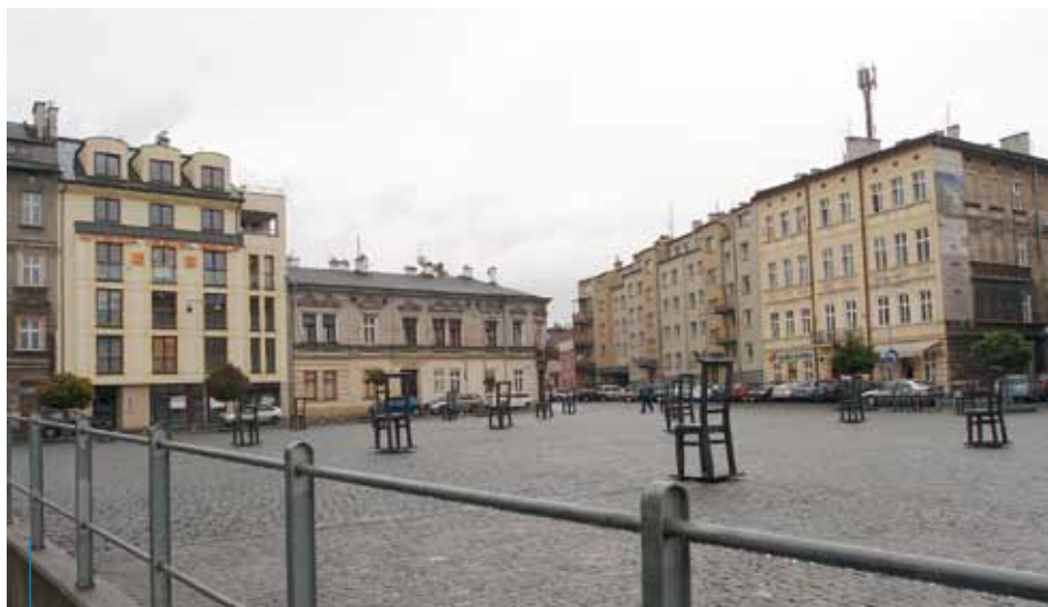
Plac Bohaterów Getta w 2012 r.

dzictwem i czy pamięć czasów Zagłady wnosi pozytywne wartości do naszej terażniejszości i przyszłości, czy też może jest tylko przykrym balastem – zapowiadają organizatorzy wyda-