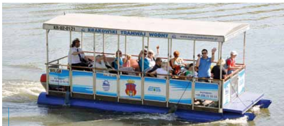
Największym atutem Krakowskiego Tramwaju Wodnego jest stały rozkład rejsów

spod Galerii Kazimierz (Tarasy Wiślane) i Flisackiej. W poniedziałki obsługiwane są wyłącznie grupy zorganizowane, po uprzedniej rezerwacji u operatora, którym po podpisaniu w 2010 r. trzyletniej umowy z Gminą Miejską Kraków jest firma Admirał Krystian Przewłocki Spółka Jawna.