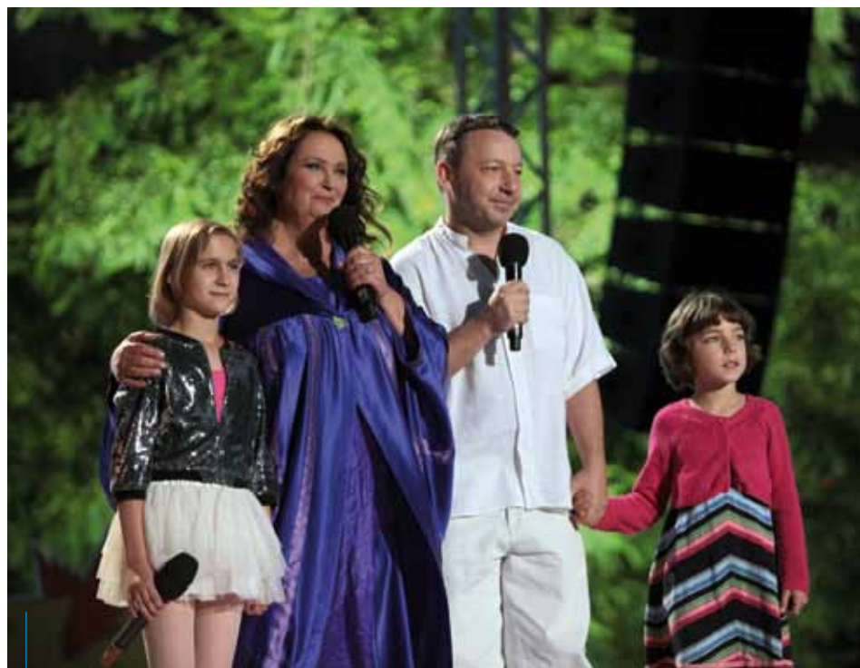
Anna Dymna i Zbigniew Zamachowski z uczestnikami VII edycji Festiwalu Zaczarowanej Piosenki

*specjalista ds. PR Fundacji Anny Dymnej „Mimo Wszystko”