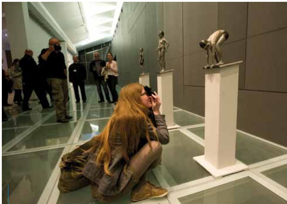
Wystawę „Sport w sztuce” w Muzeum Sztuki Współczesnej MOC-CAK można oglądać do 30 września 2012 r.

W miejsce linii nr 522 uruchomiono tymczasową linię autobusową nr 503, która jedzie po