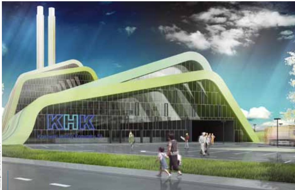
wizualizacja: Manufaktura nr 1

Komisja Europejska podjęła pozytywną decyzję w sprawie finansowania ekospalarni odpadów. „Program gospodarki odpadami komunalnymi w Krakowie” jako pierwszy spośród „projektów spalarnianych” planowanych do realizacji w Polsce otrzymał zapewnienie unijnego wsparcia.