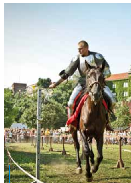
...a także podziwiać sprawność rycerzy

Szczegółowe informacje na temat jarmarku dostępne są na stronie: www.jarmarkswietojański.eu .