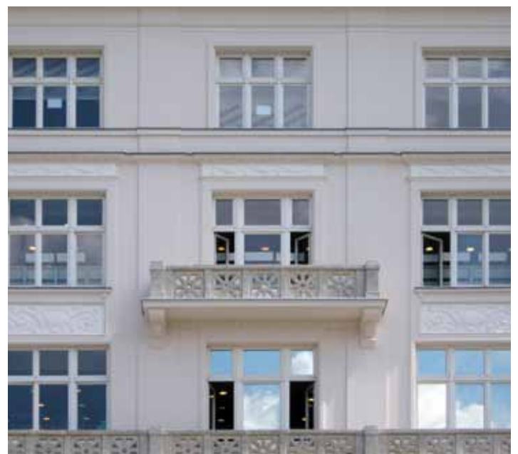
Nawet usunięcie kilku napisów reklamowych zmienia całkowicie wygląd kamienic...