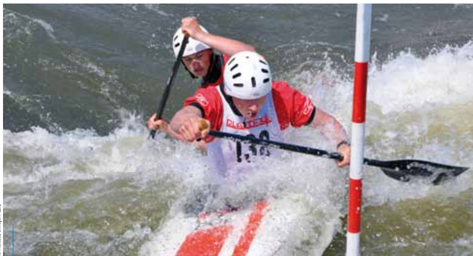
Tor kajakarstwa górskiego przy Kolnej należy do najnowocześniejszych w Europie

Warto pamiętać, że ośrodek przy Kolnej ma dogodne położenie. Bliskość zachodniej obwodnicy Krakowa, autostrady A-4 oraz portu lotniczego w Balicach sprawia, że łatwo tu dojechać nawet z odległych zakątków. W okresie letnim przy torze kajakarstwa zatrzymuje się Krakowski Tramwaj Wodny. Z centrum miasta do ośrodka przy Kolnej prowadzi trasa rowerowa.