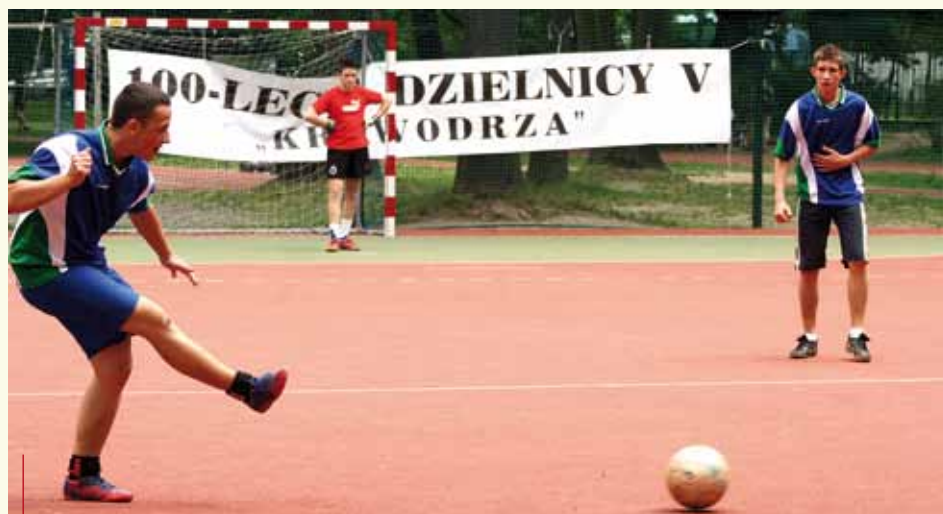
Rozgrywki Krakgola – piłka nożna po krakowsku