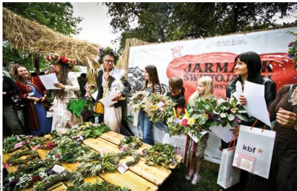
Podczas jarmarku będzie można spróbować plecenia wianków...

Rzemieślnicy i kupcy, pokazy konne, warzelnia soli i jatka solna, ścieżki edukacyjne, kramy i warsztaty rzemieślnicze to tylko część atrakcji tegorocznego Jarmarku Świętojańskiego. Wszystkich, którzy przyjdą na bulwar Czerwieński w dniach od 29 czerwca do 1 lipca, czeka podróż w czasie do średniowiecznego miasteczka.