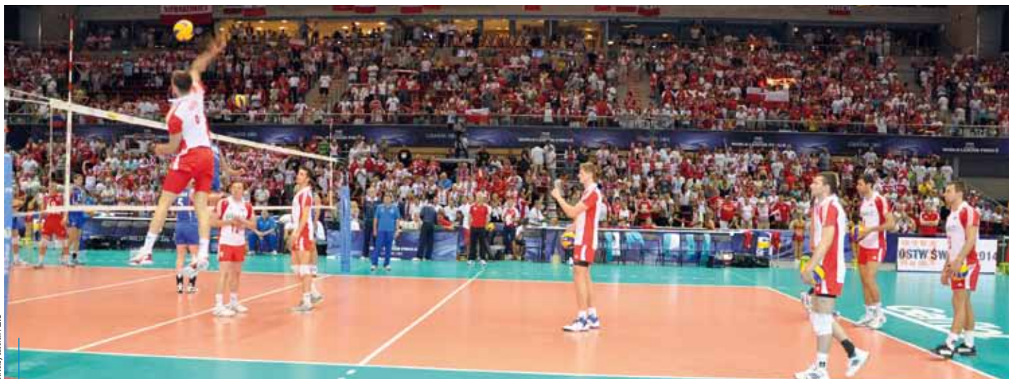
Za dwa lata w Krakowie będą rozgrywane mecze siatkówki na najwyższym poziomie – w ramach Mistrzostw Świata w Piłce Siatkowej 2014

Na 2013 rok zaplanowano dokończenie konstrukcji hali, a także montaż zadaszenia oraz elewacji wraz z ekranem LED. Mają też zostać wykonane roboty wykończeniowe, instalacje elektryczna i wodociągowa oraz kanalizacja sanitarna i opadowa. Planuje się instalację urządzeń gaśniczych wraz z systemem sygnalizacji pożaru i monitoringu konstrukcji. Wykonane zostaną także drogi dojazdowe, place, parkingi i oświetlenie zewnętrzne. W obiekcie będzie można organizować m.in. imprezy kulturalne, widowiskowo-estradowe, sportowo-rekreacyjne, kongresy, wystawy i targi. Znajdzie się tam również 27 sky-boxów, czyli miejsc wynajmowanych przez firmy na organizację przedsięwzięć biznesowych. W hali działaczą będą centrum odnowy biologicznej i zaplecze restauracyjne. Całkowita powierzchnia komercyjna w kompleksie wyniesie ponad 9500 m kw. Planowany termin zakończenia inwestycji to IV kwartał 2013 r.