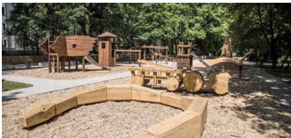
Jedną z atrakcji parku jest nowoczesny plac zabaw

W sobotę 2 czerwca kursowanie rozpocznie Parkobus. Specjalny autobus wystartuje z pętli Nowy Bieżanów, a następnie trasą Bieżanów, Aleksandry, Prokocim, Bieżanowska, Makowa, Bonarka, rondo Matecznego, Centrum Kongresowe, Jubilat, Muzeum Narodowe, Czarnowiejska, dowiezie mieszkańców pod sam park Krakowski. Przejazd Parkobusem jest oczywiście bezpłatny.