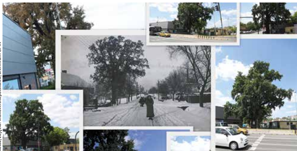
kolaż, zdjęcia: krakowfotopolska.eu, archiwum UMJK

„Henryk” to żywy świadek historii Krakowa sięgającej ponad 240 lat wstecz. To drzewo o wyjątkowych cechach dendrologicznych, jeden z ostatnich potomków prastarej puszczy, który przetrwał niemal cudem, rosnąc w samym sercu miejskiej dżungli, tuż przy jednej z najbardziej ruchliwych arterii drogowych Krakowa. Stanowi dominantę w krajobrazie Borku Fałęckiego i jest znaczącym obiektem edukacji przyrodniczej Krakowa.