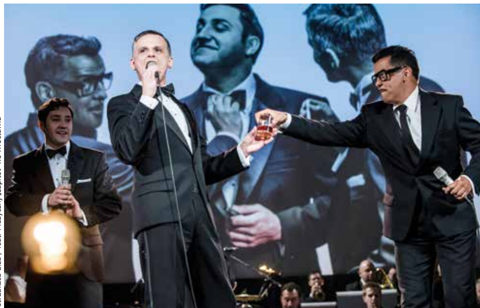
„Rat Pack, czyli Frank Sinatra z kolegami”

Sześć spektakli w sześć dni. Zaczynające się pierwszego lipca IX Krakowskie Miniatury Teatralne będą intensywne i z pewnością wzbudzą emocje. Wybrane spektakle zostaną zaprezentowane w Krakowie premierowo. Po raz pierwszy też w programie znalazł się musical.