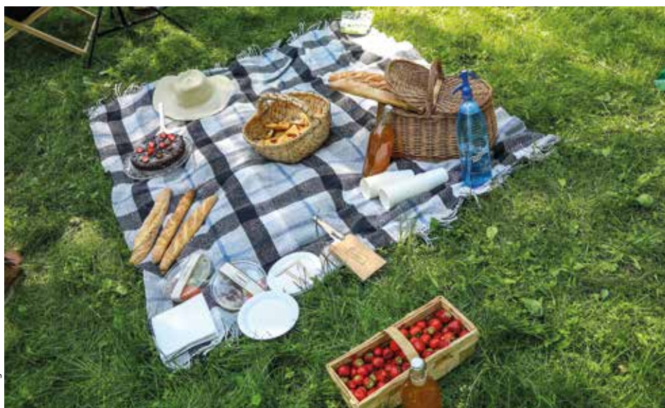
Letnie weekendy najlepiej spędzać na piknikach

Tradycyjnie już Miasto Kraków zaprasza do spędzenia lata na łonie krakowskiej przyrody. Okazją ku temu będą wszystkie akcje organizowane w ramach projektu „Zatrać się w zieleni”.