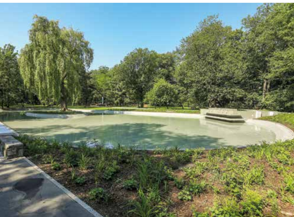
Równo 100 lat temu odbywały się prace przy porządkowaniu zaniedbanego parku Krakowskiego