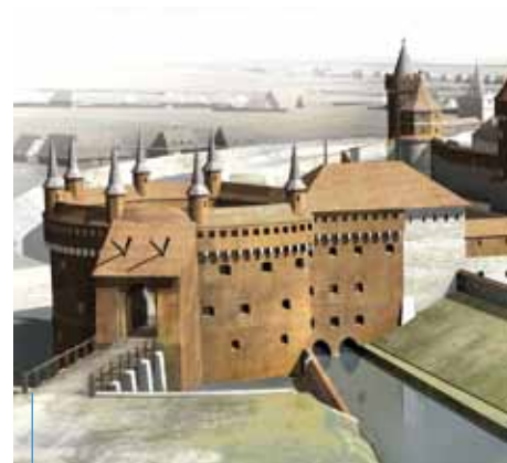
Wystawę „Cracovia 3D. Rekonstrukcje cyfrowe historycznej zabudowy Krakowa” będzie można oglądać w pałacu Krzysztoforów od 5 maja do 14 sierpnia.

Drugą pod względem tematycznym część ekspozycji stanowi rekonstrukcja przemian architektonicznych krakowskiego Rynku następujących w ciągu kolejnych sześciu stuleci, od średniowiecza do końca okresu nowożytnego. Autorzy wystawy stawiają akcent na prezentację już nieistniejących obiektów i zespołów architektury lub zachowanych w stanie prze-