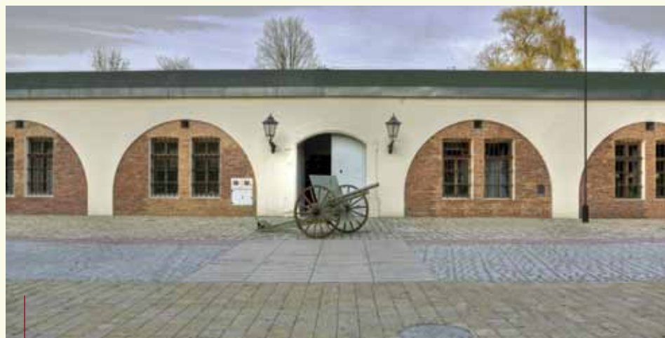
Dziedziniec fortu 49.