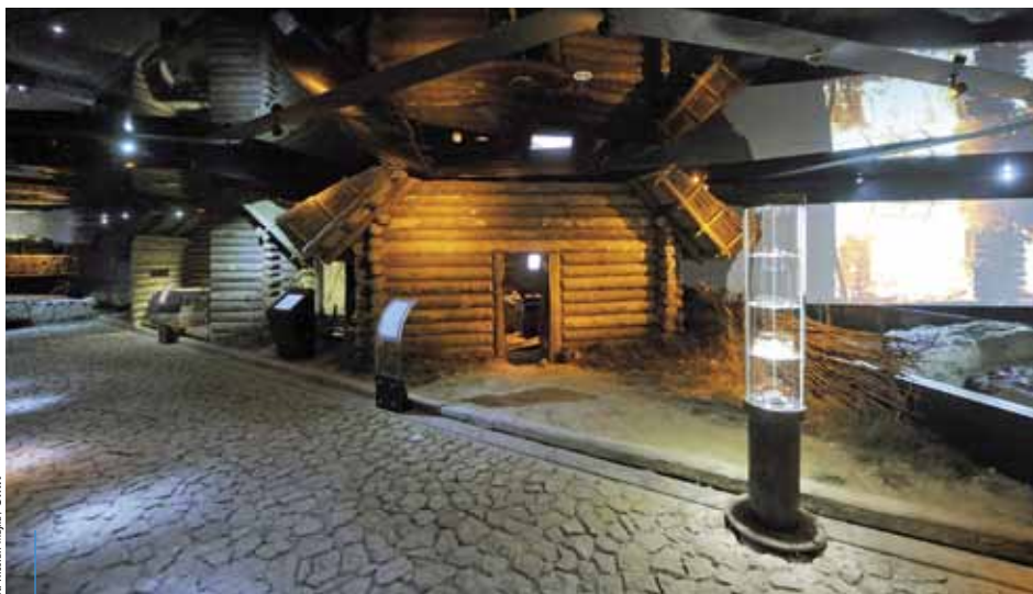
Otwarcie podziemi Rynku Głównego zwyciężyło w plebiscycie na Wydarzenie Historyczne Roku 2010.

Jak podkreślają organizatorzy, celem plebiscytu jest uhonorowanie organizatorów, twórców oraz inicjatorów najciekawszych przedsięwzięć historycznych w Polsce. Każdego roku w całym kraju organizowane są liczne imprezy o charakterze historycznym – plebiscyt pokazuje nie tylko ich różnorodność, ale także popularność wśród Polaków.