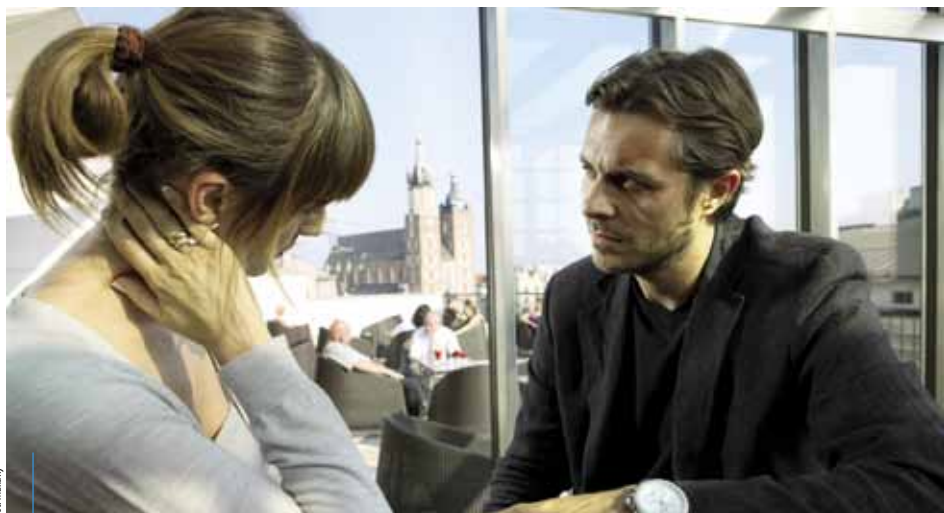
Z początkiem czerwca do kin wejdzie film Jacka Bromskiego „Uwikłanie”, którego akcja rozgrywa się w Krakowie.

„Uwikłanie” to kolejna duża polska produkcja (dystrybutorem jest ITI Cinema) wspierana przez Krakowską Komisję Filmową. KKF zorganizowała miejsca na potrzeby planu zdjęciowego, koordynowała pracę służb miejskich zabezpieczających plan, a także zaplanowała i zrealizowała zmiany w organizacji ruchu na potrzeby planu zdjęciowego. W filmie zobaczymy m.in.: zamek w Przegorzałach, Mały Rynek, hotel Forum, Operę Krakowską, plac Szczepański, bulwary wiślane oraz Planty.