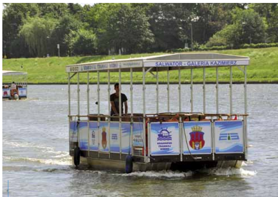
W sobotę 30 kwietnia rozpocznie się trzeci sezon rejsów Krakowskiego Tramwaju Wodnego.

*rzecznik prasowy Zarządu Infrastruktury Sportowej w Krakowie