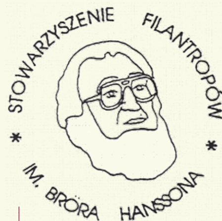
Logo Stowarzyszenia Filantropów im. Bröra Hanssona.