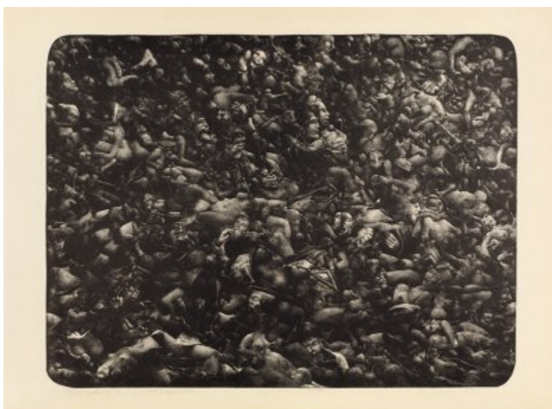
Władysław Winięcki | Kadr 2 | litografia | 100x70 cm | 1976

[miejsce ekspozycji: Międzynarodowe Centrum Sztuk Graficznych, Rynek Główny 29, II p.]