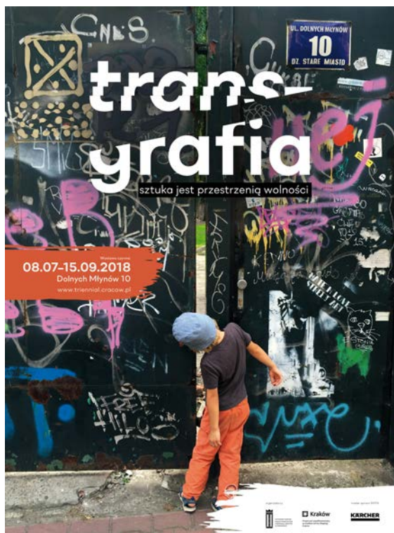
transgrafia 2018 – plakat wizerunkowy proj. Katarzyna Wojtyga

[miejsce ekspozycji: Fundacja Tytano – ul. Dolnych Młynów 10 – Kraków]