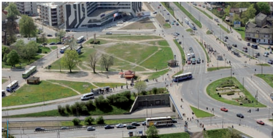
Już w tym roku będziemy obserwować rosnące mury centrum kongresowego.

Nowy dworzec dla autobusów koło ronda Grunwaldzkiego to kwestia kilku lat. Natomiast już w tym roku do użytku oddany zostanie terminal autobusowy u zbiegu ulic Wielickiej i Powstańców Wielkopolskich. Na około 250 metrach kwadratowych terenu znajdzie się kilka zadaszonych stanowisk dla odjazdów i przyjazdów. W obrębie terminalu za-