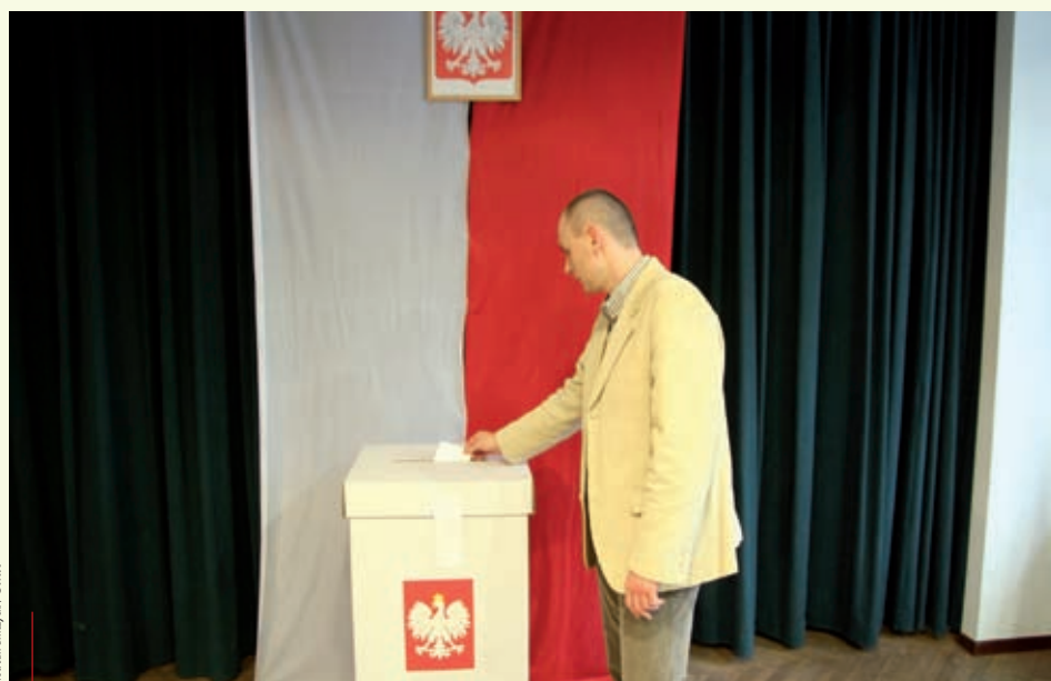
Głosowanie w jednej z krowoderskich komisji.

9 lutego odbyły się wybory do krakowskich rad dzielnic. Frekwencja w całym mieście wyniosła 12,74 % – nieco więcej niż wynikało z pierwotnych przewidywań. Krakowianie w bezpośrednich, jednomandatowych wyborach wybrali swoich przedstawicieli, którym powierzyli sprawy swojego najbliższego otoczenia. Przedstawiamy krótkie podsumowanie wyborów do rad dzielnic wedle informacji przekazanych przez biuro wyborcze 10 stycznia 2010 r.