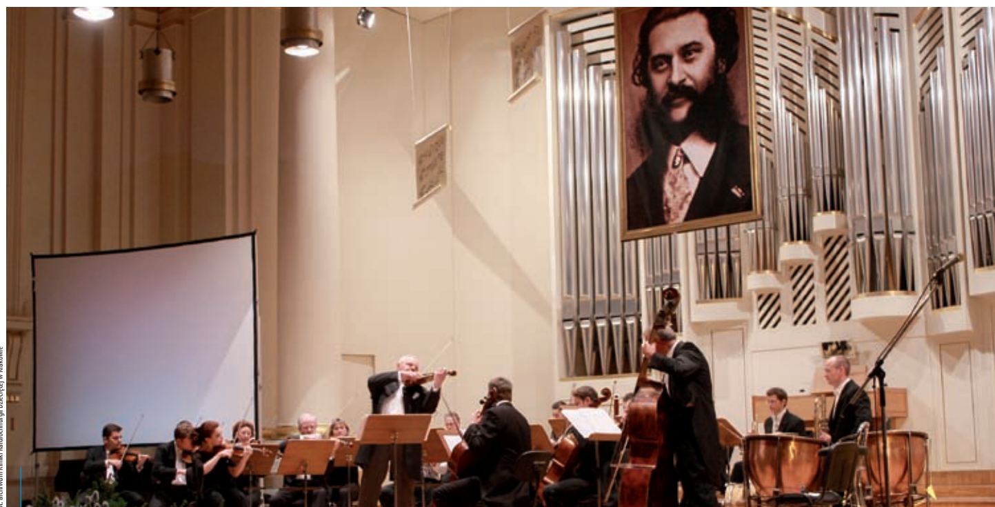
Muzycy z Wiednia zagraли w Krakowie już po raz trzeci.

Dochód z poprzednich koncertów został przeznaczony na cele szkoleniowe, zakup sprzętu medycznego oraz konieczne prace modernizacyjne. Organizatorzy wydarzenia nadal chcą kontynuować zbiórkę pieniędzy na rzecz kliniki, ponieważ kardiochirurgia dziecięca to dziedzina, która wymaga nieustannych nakładów finansowych, ciągłego podnoszenia kwalifikacji personelu i zakupu coraz to nowszych technologicznie urządzeń wykorzystywanych w trakcie operacji bądź też w salach pooperacyjnych.