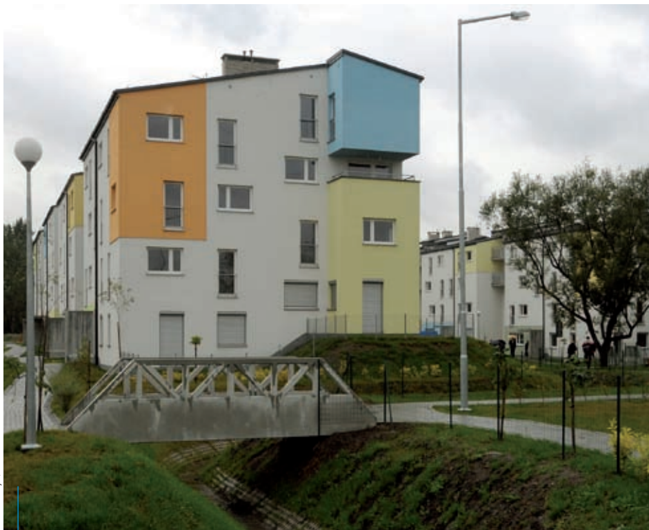
Tak wygląda osiedle bloków komunalnych przy ul. Magnolii. W najbliższych latach podobne osiedla będą powstawały w ramach partnerstwa publiczno-prywatnego.

Kupowanie od deweloperów, budowa bloków komunalnych, remonty pustostanów, a w przyszłości także budowa osiedli w systemie partnerstwa publiczno-prywatnego (PPP) – choć potrzeby są znacznie większe niż możliwości gminy, Kraków stara się, żeby najbardziej potrzebujący mogli zamieszkać w mieszkaniach komunalnych.