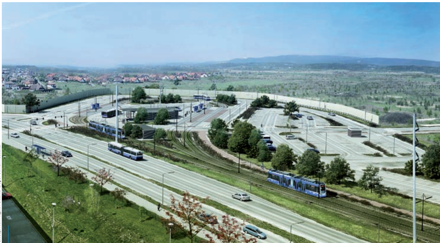
W rejonie pętli tramwajowej przy ul. Czerwone Maki zaplanowano parking park&ride.

Nowy ośrodek pomocy społecznej zaprojektowano w sposób, który ma pomóc w osiągnięciu celów terapeutycznych i profilaktycznych. W budynku przewidziano m.in. sale do terapii grupowej, zajęciowej i indywidualnej, salę