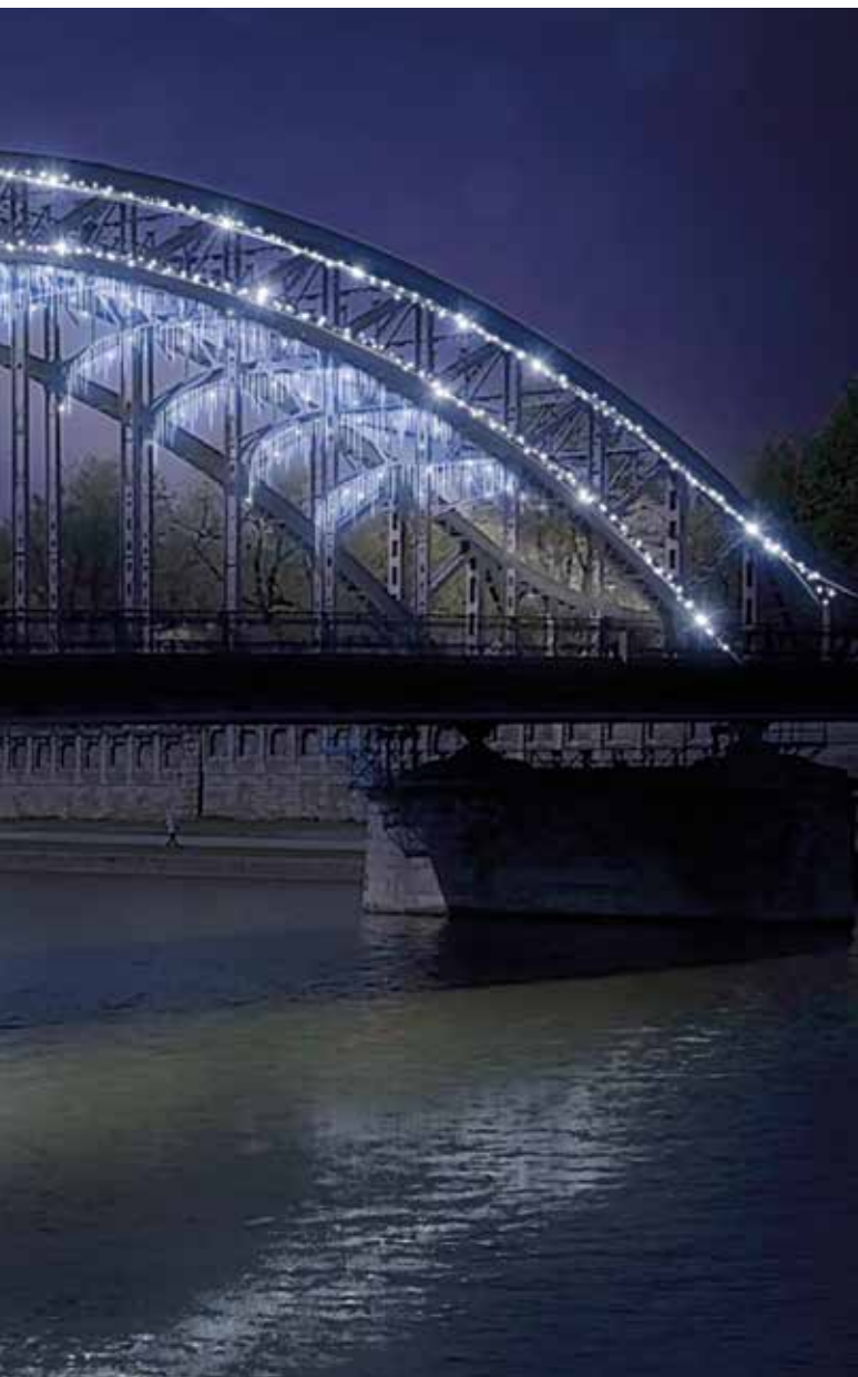
wizualizacja: kooperativa studio

Dekoracje pojawią się na ulicach pod koniec listopada, będzie można je podziwiać do 31 stycznia.