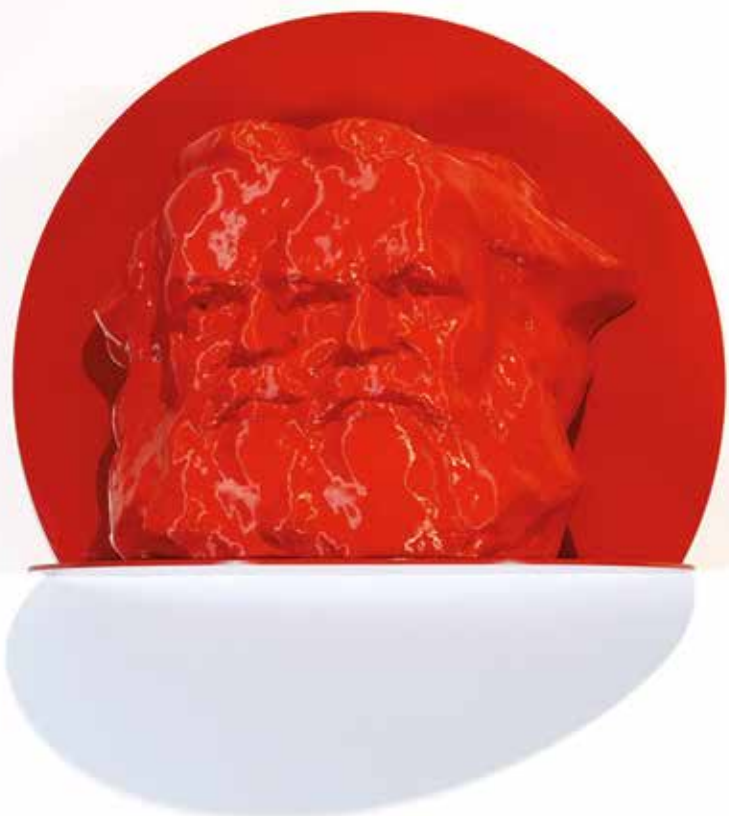
Krzysztof M. Bednarski, Marks trójki , 2017, wydruk 3D, 73 × 76 × 60 cm