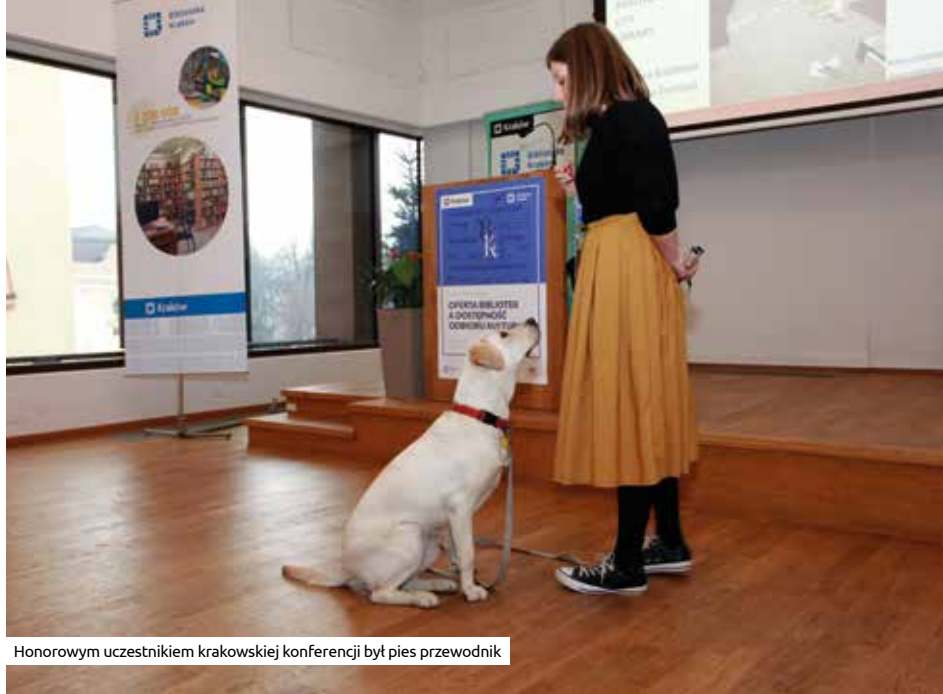
Honorowym uczestnikiem krakowskiej konferencji był pies przewodnik

Bibliotekarze i reprezentanci środowisk działających na rzecz osób z niepełnosprawnością z Polski i zagranicy spotkali się podczas kolejnej międzynarodowej konferencji zorganizowanej przez Bibliotekę Kraków we współpracy z Kancelarią Prezydenta Miasta Krakowa oraz Wydziałem Kultury i Dziedzictwa Narodowego.