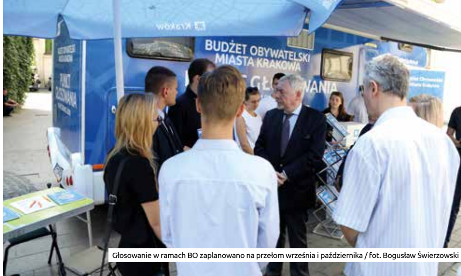
Głosowanie w ramach BO zaplanowano na przełom września i października