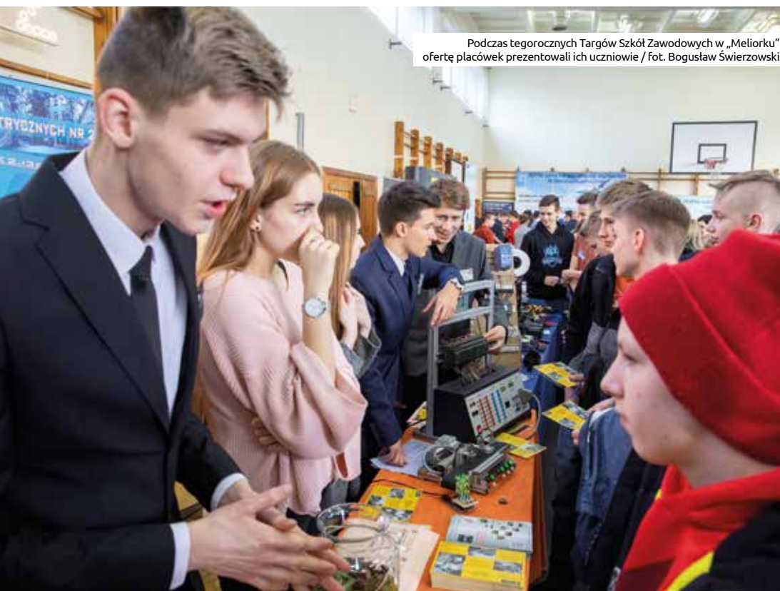
Podczas tegorocznych Targów Szkół Zawodowych w „Meliorku” oferty placówek prezentowali ich uczniowie

Szkoła techniczna zapewnia rzetelne przygotowanie do zawodu i ułatwia zdobycie doświadczenia poprzez praktyki uczniowskie czy kursy doszkolające. Młody człowiek, który kończy edukację szkolną w placówkach technicznych, jest niemal w pełni gotowy do podjęcia pracy w profesjonalnym środowisku. Jest też bardzo cennym i pożądanym pracownikiem na rynku pracy. Późniejszy rozwój kariery może opierać na zdobywaniu coraz większego doświadczenia.