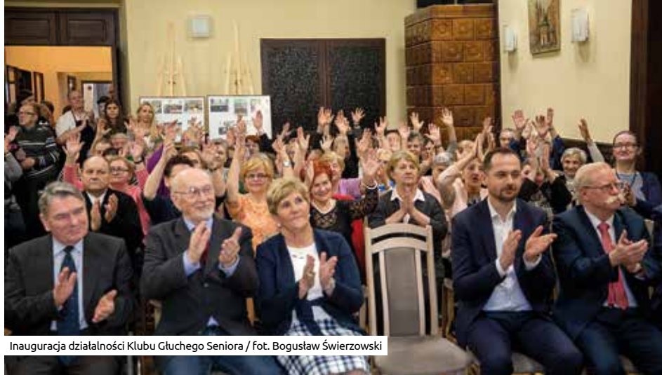
Inauguracja działalności Klubu Głuchego Seniora