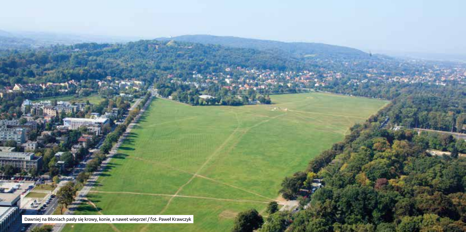
Dawniej na Błoniach pasty się krowy, konie, a nawet wieprze!