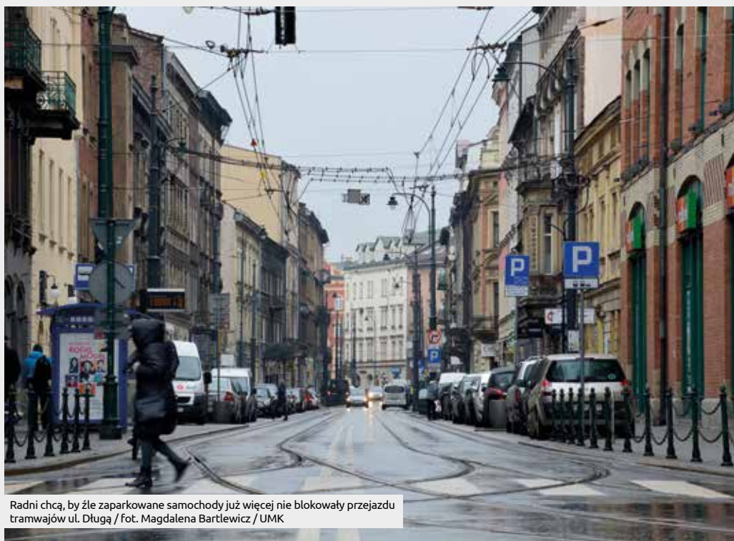
Radni chcą, by źle zaparkowane samochody już więcej nie blokowały przejazdu tramwajów ul. Długą