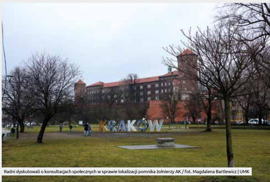
Radni dyskutowali o konsultacjach społecznych w sprawie lokalizacji pomnika żołnierzy AK