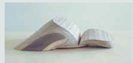
Praca Zbigniewa Sałaja