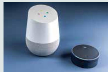
Komputerowy asystent Alexa (Amazon)

Cricoteka, ul. Nadwiślańska 2–4 Nowe technologie nie tylko ułatwiają nam komunikację, ale same zaczynają aktywnie brać w niej udział. Wystawa „Język maszyn” będzie okazją do roz- mowy z chatbotami oraz zapoznaniem się z różnymi formami literacki- mi generowanymi przez algorytmy. Programy takie jak Pretext (tworzący dzieła literackie) czy E.L.I.Z.A. (pro- wadząca rozmowę psychoanalityczną z potencjalnym pacjentem) spróbują pokazać nam, że język nie musi być domeną wyłącznie ludzką.