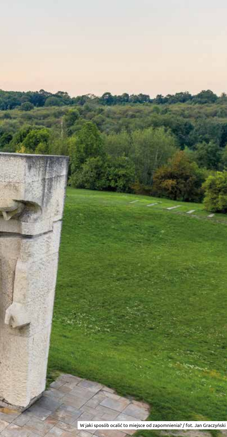
W jaki sposób ocalić to miejsce od zapomnienia?

16 września odbędzie się spotkanie poświęcone układowi komunikacyjnemu wokół terenu Muzeum – Miejsca Pamięci, które ma powstać na terenie byłego obozu KL Plaszow. Będzie to kolejna okazja, aby porozmawiać o tym, w jaki sposób ocalić od zapomnienia i zadbać o miejsce śmierci kilku tysięcy Żydów i Polaków, w tym wielu krakowian, którzy ginęli tu z rąk niemieckich okupantów w latach 1942–1945.