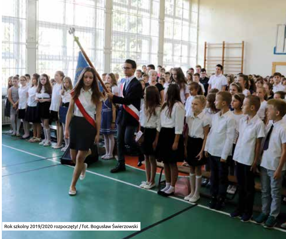
Rok szkolny 2019/2020 rozpoczęty!