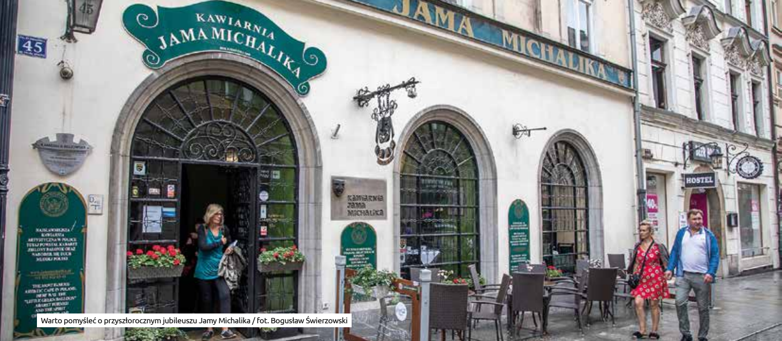
Warto pomyśleć o przyszłorocznym jubileuszu Jamy Michalika