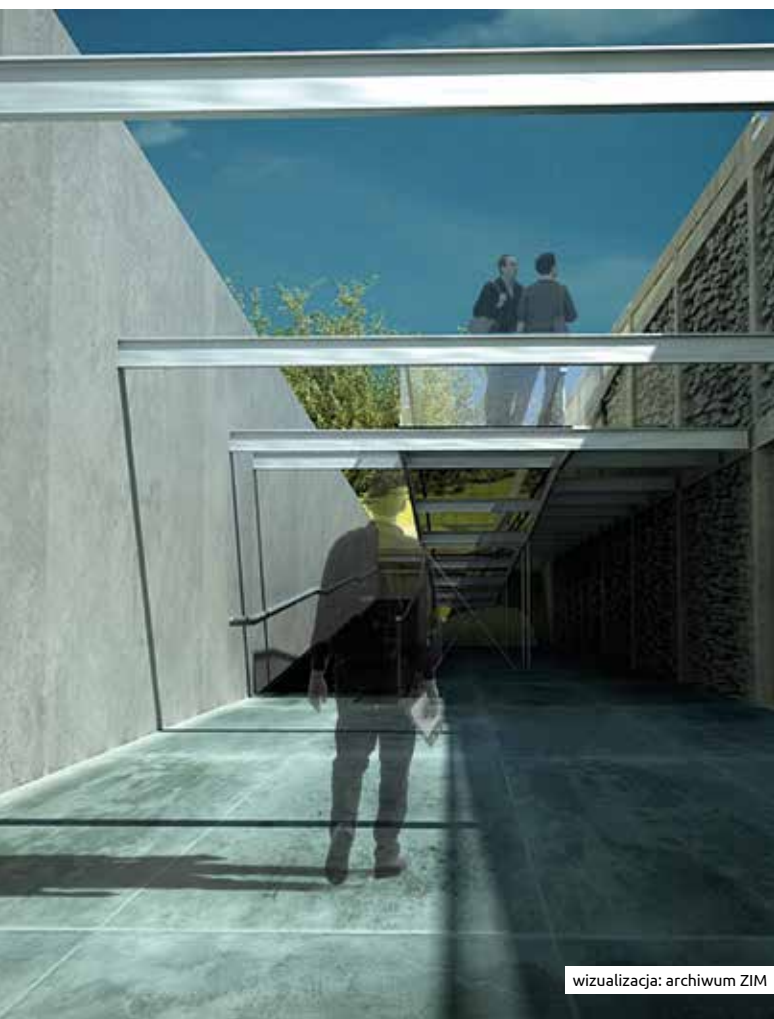
wizualizacja: archiwum ZIM

Dawny obóz jest częścią opowiadającej o II wojnie światowej Trasy Pamięci Muzeum Krakowa, w skład której wchodzi również Fabryka Emalia Oskara Schindlera, Apteka pod Ortem i Ulica Pomorska, dawna siedziba gestapo.