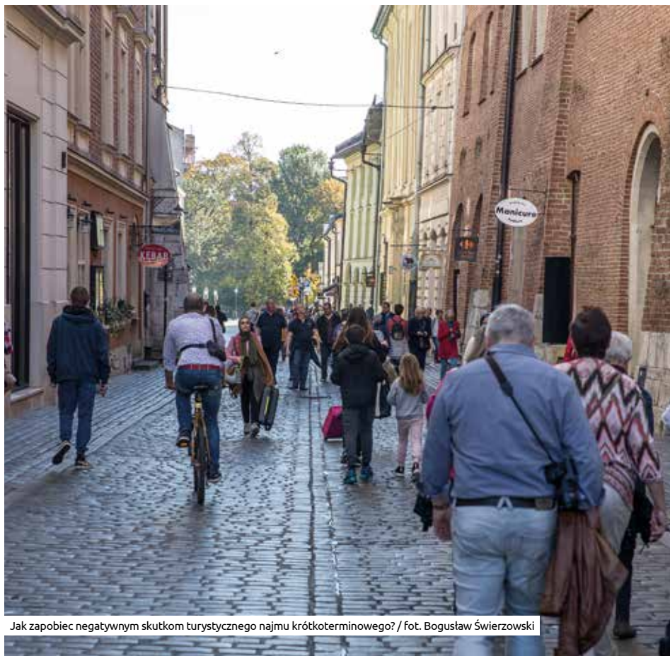
Jak zapobiec negatywnym skutkom turystycznego najmu krótkoterminowego?

Najem krótkoterminowy sprawia miastom sporo kłopotów, choć trudno z nim walczyć, bo samo to pojęcie nie ma jeszcze swojej definicji prawnej. Można jednak ogólnie założyć, że zjawisko to przeważnie polega na świadczeniu usług hotelarskich, czyli wynajmowaniu turystom lokali w budynkach niebędących hotelami.