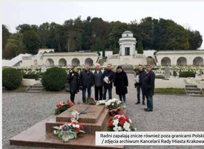
Radni zapalają znicze również poza granicami Polski