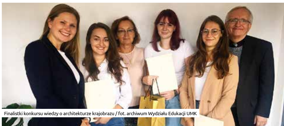
Finalistki konkursu wiedzy o architekturze krajobrazu

jedyne z Małopolski zostałyśmy zaproszone do Gdańska, gdzie mogłyśmy go zaprezentować. W kolejnym etapie konkursu