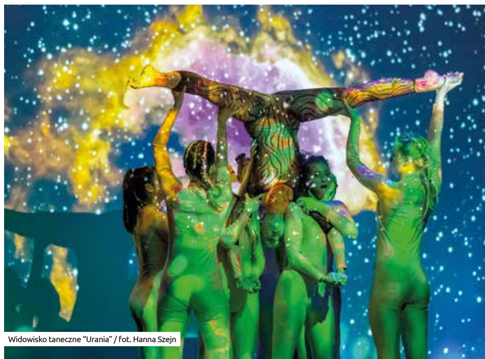
Widowisko taneczne „Urania”