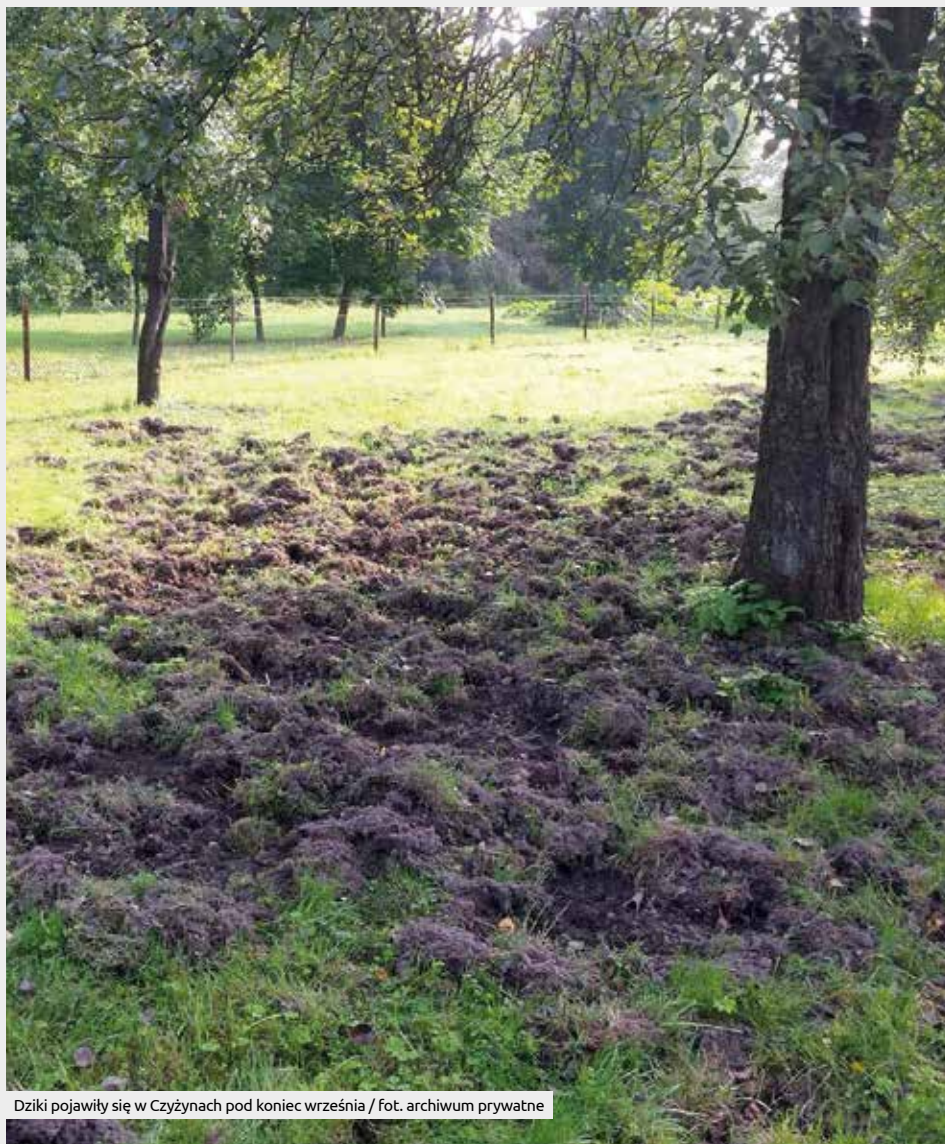
Dziki pojawiły się w Czyżynach pod koniec września