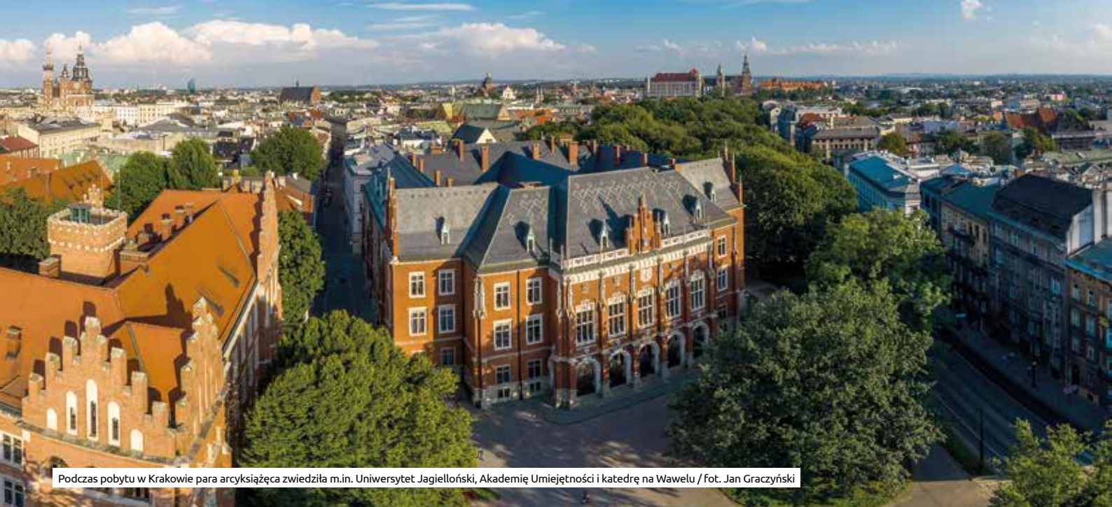
Podczas pobytu w Krakowie para arcyksiążęca zwiedziła m.in. Uniwersytet Jagielloński, Akademię Umiejętności i katedrę na Wawelu