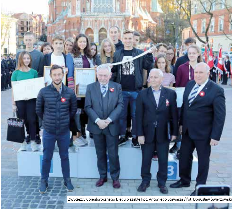
Zwycięzcy ubiegłorocznego Biegu o szablę kpt. Antoniego Stawarza

Niepodległa Polska narodziła się w Krakowie – często używamy tego sformułowania, bo taka jest prawda. Możemy te słowa doprecyzować, że narodziła się w Podgórzu 31 października 1918 r.