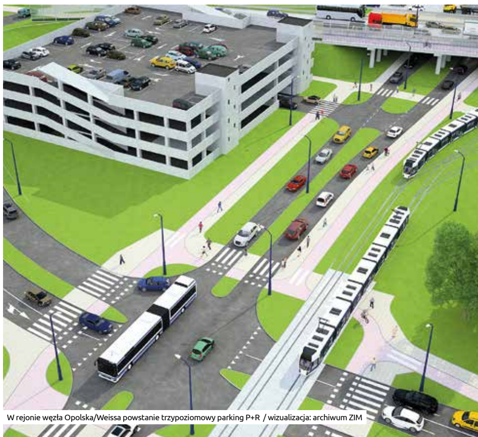
W rejonie węzła Opolska/Weissa powstanie trzypoziomowy parking P+R