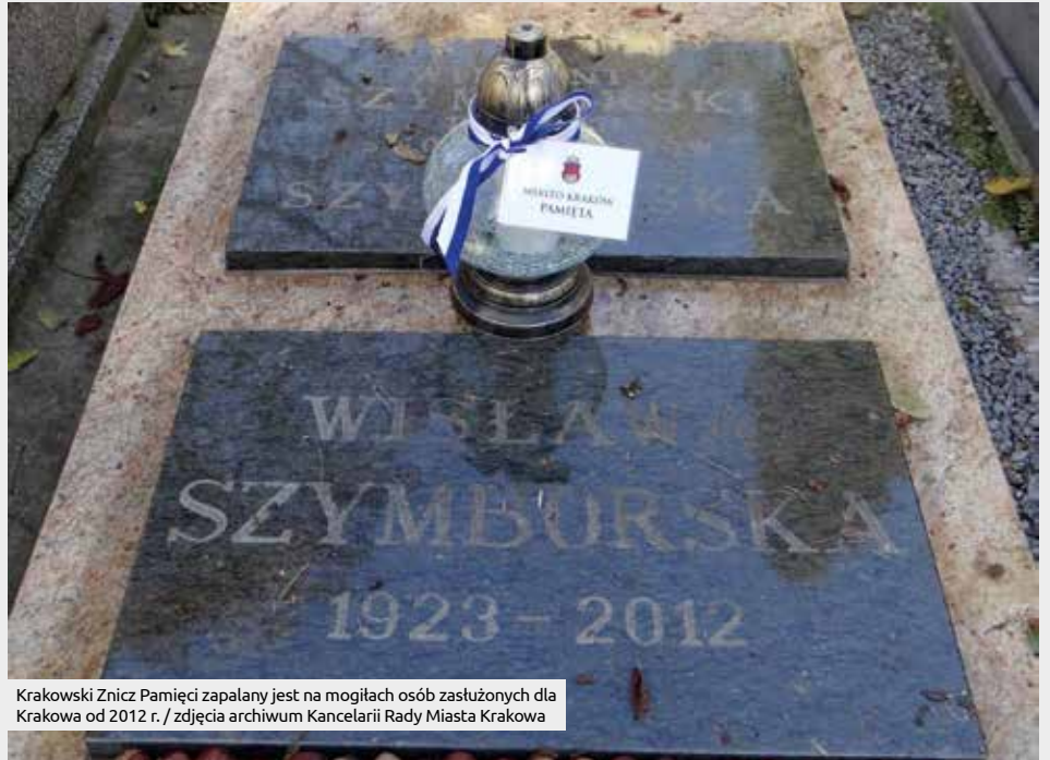
Krakowski Znicz Pamięci zapalany jest na mogiłach osób zasłużonych dla Krakowa od 2012 r.