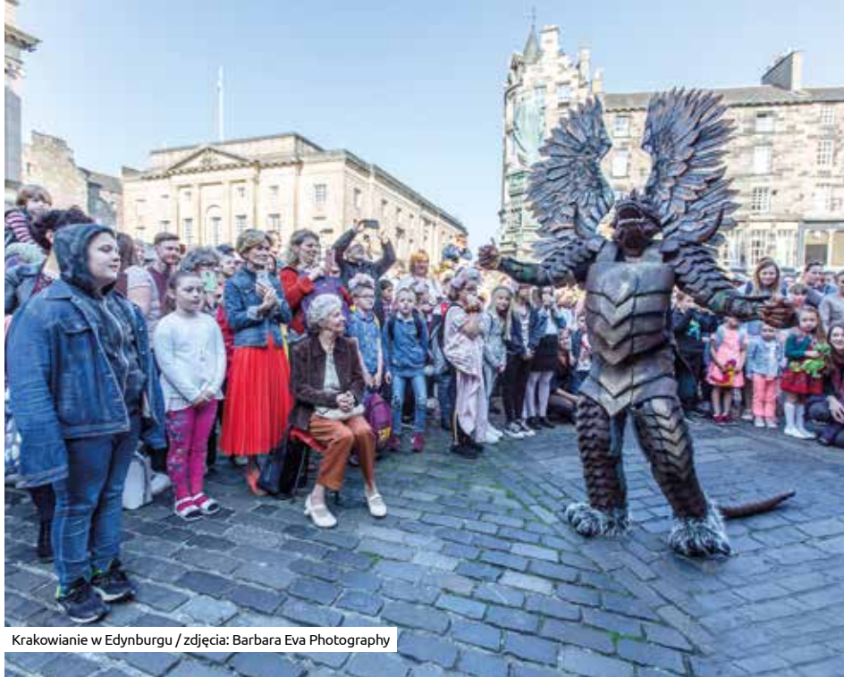
Krakowianie w Edynburgu