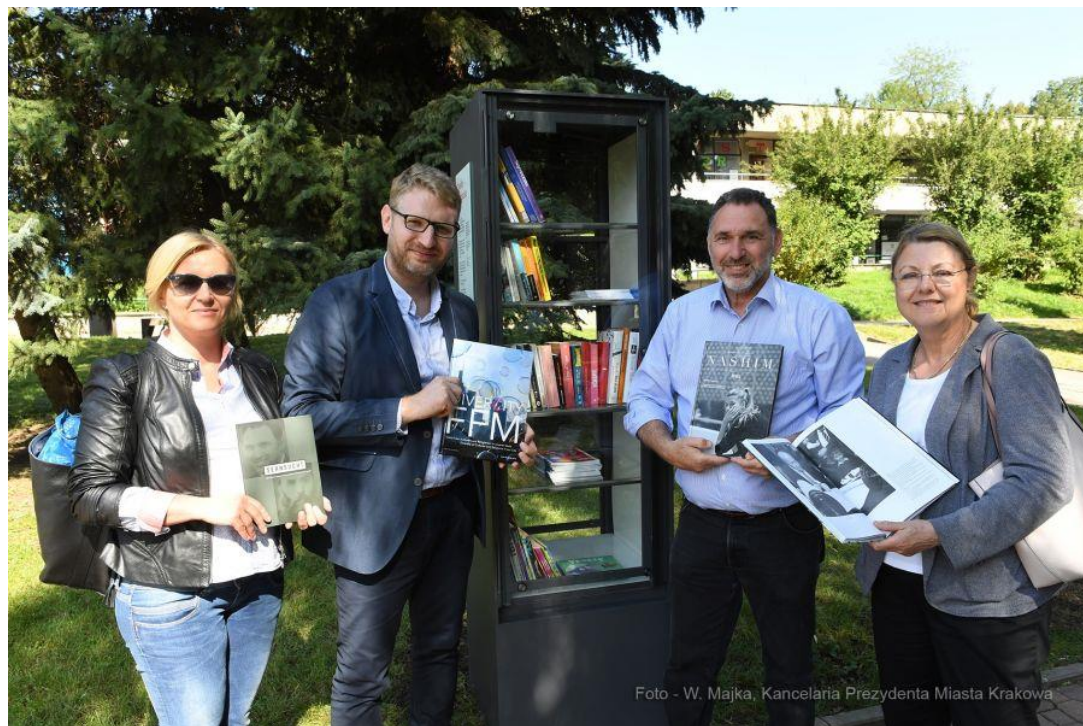
Biblioteczka z Frankfurtu