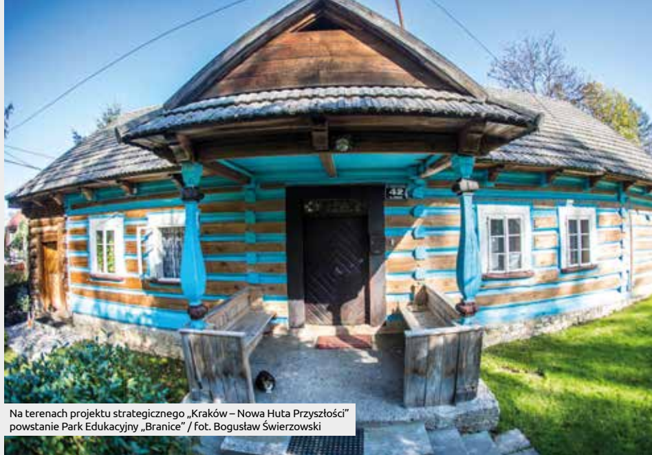
Na terenach projektu strategicznego „Kraków – Nowa Huta Przyszłości” powstanie Park Edukacyjny „Branice”

Na terenach projektu strategicznego „Kraków – Nowa Huta Przyszłości” powstanie Park Edukacyjny „Branice”. Na obszarze 5,5 ha postawionych zostanie 11 zabytkowych budynków z Krakowa i okolic, w tym karczma i kościół. Z atrakcji skorzystamy najwcześniej za cztery lata.