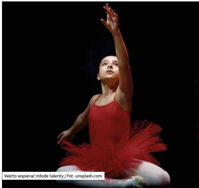
Warto wspierać młode talenty