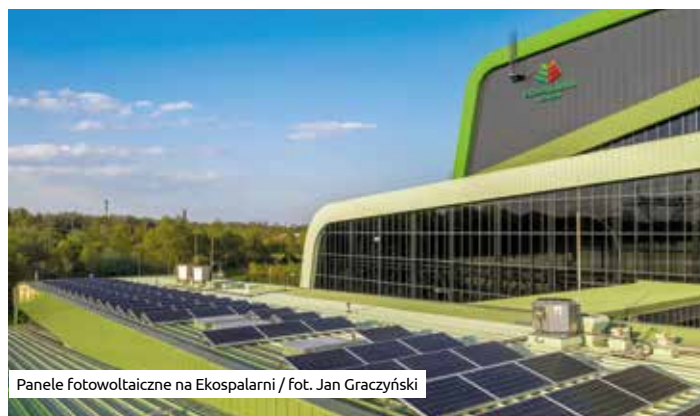
Panele fotowoltaiczne na Ekospalarni