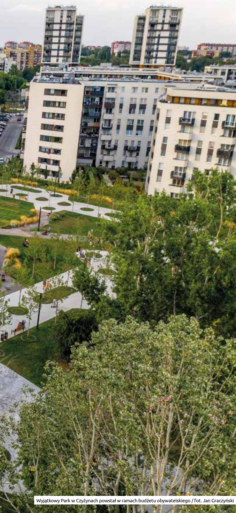
Wyjątkowy Park w Czyżynach powstał w ramach budżetu obywatelskiego

Konsultacje to rozmowy urzędników z mieszkańcami, które mają pomóc Miastu w podjęciu najlepszej dla krakowian decyzji. Celem konsultacji jest wypracowanie rozwiązań, które będą uwzględniały głos mieszkańców – często oznacza to zmianę początkowych projektów i pomysłów. Właściwie prowadzone konsultacje społeczne to przede wszystkim przemyślane i zaplanowane od samego początku proces zapewniający możliwość ▶