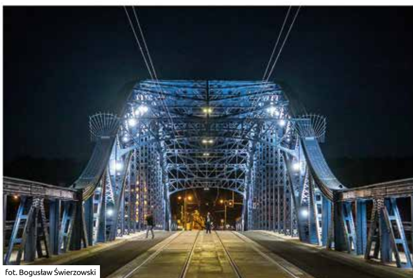
fol. Bogusław Świerzowski