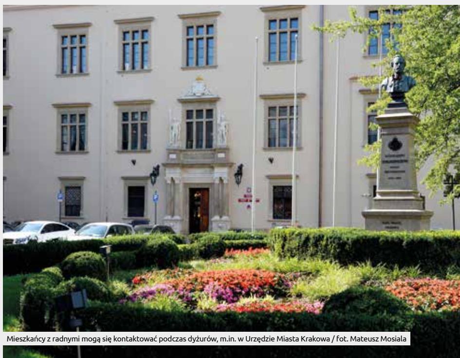
Mieszkańcy z radnymi mogą się kontaktować podczas dyżurów, m.in. w Urzędzie Miasta Krakowa

Ograniczenia związane z epidemią koronawirusa wpłynęły na pracę Rady Miasta Krakowa. Sesje odbywają się z zachowaniem reżimu sanitarnego, część posiedzeń komisji odbywa się zdalnie. A co z dyżurami? Te ze względu na zagrożenie epidemiczne zostały ograniczone. Nie jest to jednak jedyny sposób na kontakt z radnymi.