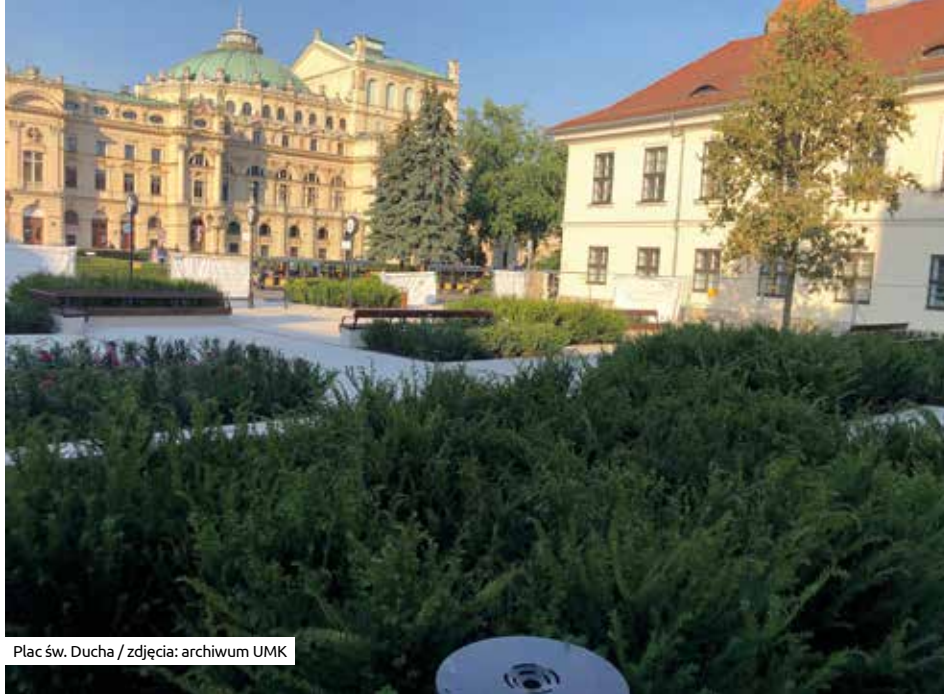
Plac św. Ducha