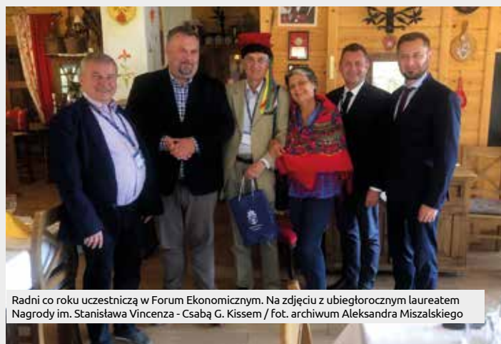
Radni co roku uczestniczą w Forum Ekonomicznym. Na zdjęciu z ubiegłorocznym laureatem Nagrody im. Stanisława Vincenza - Csabą G. Kissem