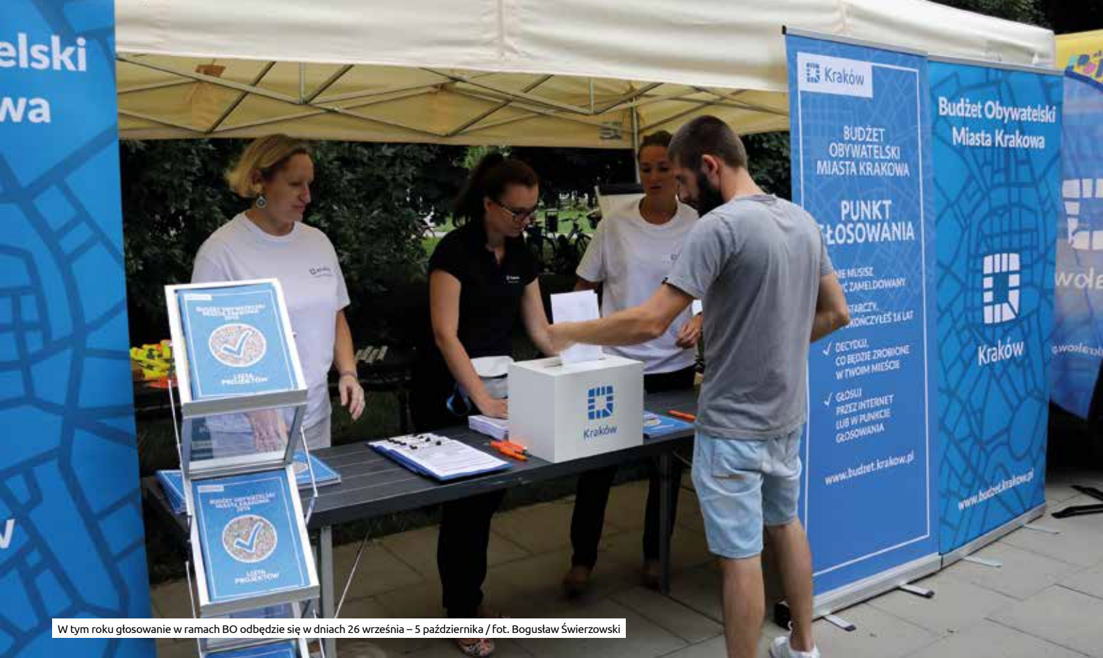
W tym roku głosowanie w ramach BO odbędzie się w dniach 26 września – 5 października