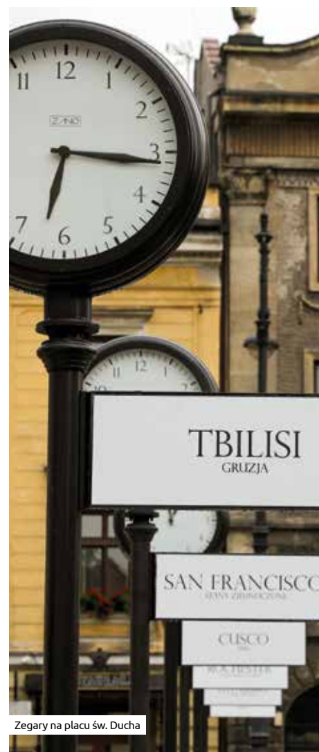
Zegary na placu św. Ducha