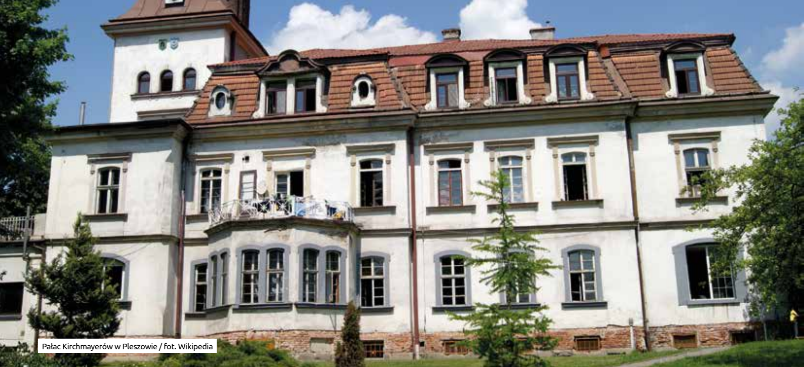
Pałac Kirchmayerów w Pleszowie