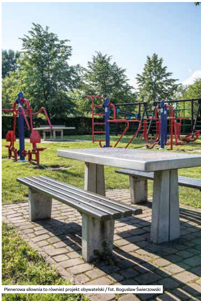
Plenerowa siłownia to również projekt obywatelski

Opis wszystkich zrealizowanych inicjatyw oraz informacje dotyczące tego, jak je zgłaszać, są zamieszczone na specjalnie stworzonej stronie internetowej, która stanowi kompendium wiedzy na temat wszystkich narzędzi demokracji bezpośredniej: www.dialoguj.pl . W tym serwisie prowadzone są też bezpłatne szkolenia e-learningowe dla mieszkańców poświęcone efektywnemu uczestnictwu w zarządzaniu miastem. Warto z nich skorzystać, by skutecznie decydować o rozwoju najbliższej okolicy.