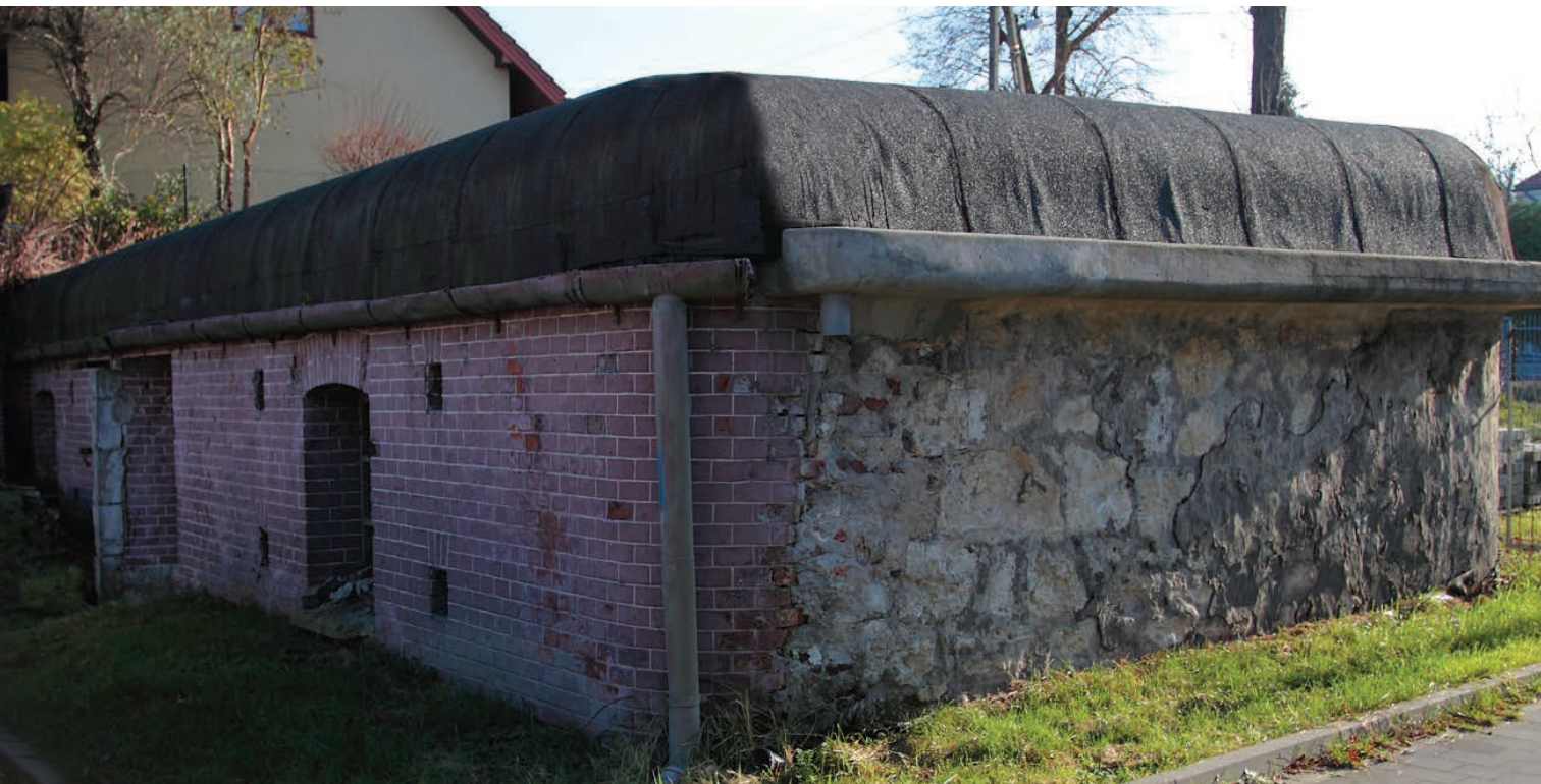
Abri à munitions

Le soufre de Swoszowice était utilisé dans l'artillerie et pour la production de la poudre à tir. Les clients du soufre local étaient au 19 ème siècle les usines de production de soda, les fabricants d'allumettes et surtout l'armée. Jusqu'en 1864 l'artillerie achetait annuellement 1120 quintaux métriques - du minerai de soufre en quintaux métriques [1 quintal métrique = 50 kg] pour la production de la poudre à tir. Le journal des entrées des années 1807/8 marque souvent la correspondance avec la Direction Militaire Impériale et Royale. La poudre noire se composait d'éléments suivants réduits en poussière : soufre, charbon de bois et nitrate de potassium (salpêtre de potassium, \text{KNO}_3 ).