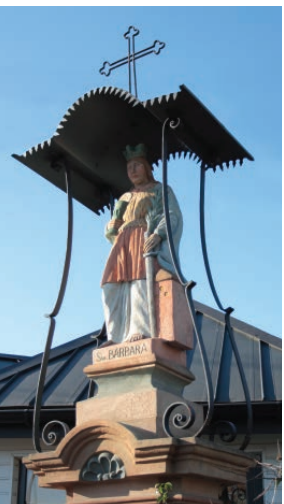
Chapelle Sainte-Barbara à proximité de la paroisse Eglise de la Paroisse de Wróblowice

Barbe est la patronne des mineurs et des fondeurs, entre autres, intercesseuse pendant la tempête et l'incendie. Sainte Barbe est aussi la patronne de l'Académie des Mines de Cracovie. Son souvenir liturgique est célébré par l'Eglise catholique le 4 décembre. Ce jour-là les mineurs célèbrent la Sainte Barbe, fête traditionnelle des mineurs.