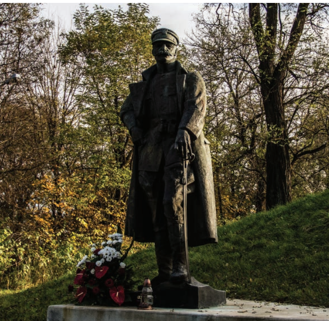
Monument en l'honneur du maréchal Piłsudski au musée des affaires militaires

En 1884 furent fermées les mines et les usines de traitement du minerai. En 1917 fut instaurée pour peu de temps la société Établissements du Soufre Polonais de Swoszowice, mais en fin de compte l'extraction fut cessée car l'exploitation se révéla trop coûteuse. Au cours des cinq siècles d'histoire de l'extraction du soufre ou de „l'or”, comme le désignaient les alchimistes, furent creusés à Swoszowice plus de 600 puits. D'après les sources historiques, il y eut des périodes pendant lesquelles l'extraction du soufre de Swoszowice faisait travailler plus de 600 personnes, ce qui constituait un grand potentiel pour Cracovie et les alentours. Dans la première moitié du 19ème siècle ce fut la plus grande mine de soufre en Europe. Elle satisfaisait à 90% la demande de l'empire d'Autriche et exportait le soufre aussi vers d'autres pays. La surface du champ de la mine (de 3 champs en principe) entre 1807 et 1881 fut similaire et s'élevait à 170 toises plus ou moins c'est-à-dire à plus de 308 ha avec les 95 ha complémentaires dans les alentours, loués par les autorités autrichiennes qui souhaitaient protéger la mine de l'éventuelle concurrence. La mine fonctionnait sur trois horizons, elle comptait environ 30 puits, la profondeur maximale d'un puits ayant été de 60 mètres. Il est estimé que les mines de Swoszowice donnèrent pendant leur vie une extraction totale d'environ 200 mille tonnes de soufre.