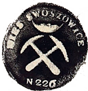
Timbre minier de Swoszowice

A l'heure actuelle sont balisées les routes touristiques suivantes : Sur les traces de Jean-Paul II, Route royale, Route royale pour touristes handicapés, Route universitaire, Route de Saint Stanislas, Route des monuments juifs, Route de l'histoire de Podgórze, Ghetto – Sentier de Mémoire 1941-1943, Route de Nowa Huta, Route des Monuments Techniques, Route des anciennes fortifications de Cracovie, Route des saints de Cracovie, et, aussi deux itinéraires touristico-culturels dans les quartiers de Bronowice et Swoszowice.