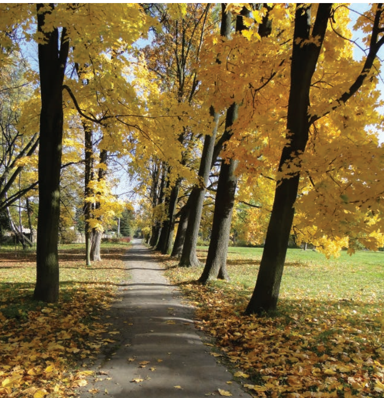
◀ Sentier sur le parcours à côté des puits Elżbieta et Piotr