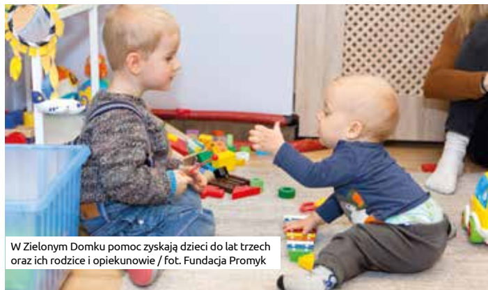
W Zielonym Domku pomoc zyskują dzieci do lat trzech oraz ich rodzice i opiekunowie

Kobiety, które niedawno zostały matkami, wychodząc z domowej izolacji i samotności – potencjalnego źródła depresji poporodowej – mogą w Zielonym Domku wymieniać się doświadczeniami i korzystać z porad innych matek. Ojcowie, często niepewni własnych kompetencji rodzicielskich, mogą je rozwijać i udoskonalać, obserwując zachowania innych rodziców. I dzieci, i rodzice trenują w Zielonym Domku stopniowe, fizyczne oddalanie się od siebie, przygotowując się do bezstresowego przejęcia opieki nad dzieckiem przez osobę trzecią, żłobek czy przedszkole.