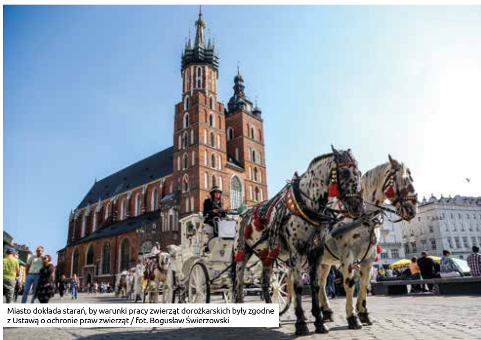
Miasto dokłada starań, by warunki pracy zwierząt dorożkarskich były zgodne z Ustawą o ochronie praw zwierząt

Wszelkie interwencje w sprawie dorożek należy zgłaszać do Wydziału Spraw Administracyjnych, Referatu Handlu i Usług, al. Powstania Warszawskiego 10, pokój 813, tel.: 12 616-92-48.