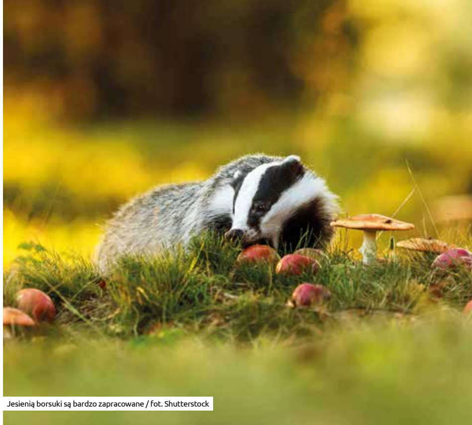
Jesienią borsuki są bardzo zapracowane

Do Lasu Wolskiego właśnie wkroczyła jesień, krzewy i drzewa zaczęły gubić liście. Te, które pozostają na gałęziach, zmieniają swoje barwy na ciepłe pomarańcze, czerwienie i żółcenie na przekór temperaturze powietrza, która znacznie się obniżyła, czemu towarzyszą coraz częstsze opady deszczu.