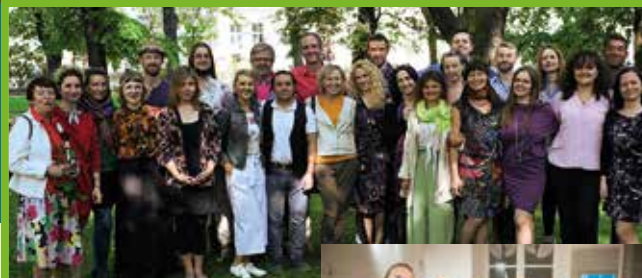
Chór w Kontakcie