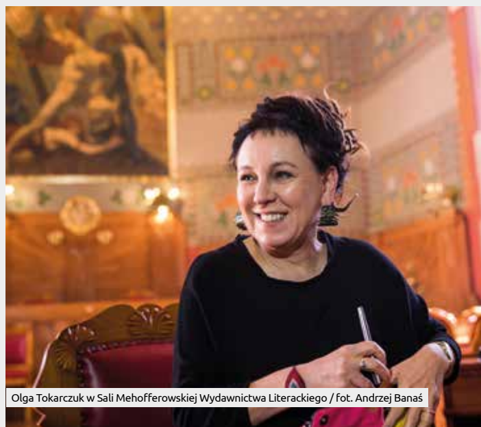
Olga Tokarczuk w Sali Mehofferowskiej Wydawnictwa Literackiego

Olga Tokarczuk urodziła się 29 stycznia 1962 r. w Sulechowie. Na jej twórczość składa się kilkanaście powieści: „Miasta w lustrach”, „Podróż ludzi Księgi”, „E.E.”, „Prawiek i inne czasy”, „Szafa”, „Dom dzienny, dom nocny”, „Opowieści wigilijne”, „Lalka i perła”, „Gra na wielu bębenkach”, „Ostatnie historie”, „Anna In w grobowcach świata”, „Bieguni”, „Prowadź ptug swój przez kości