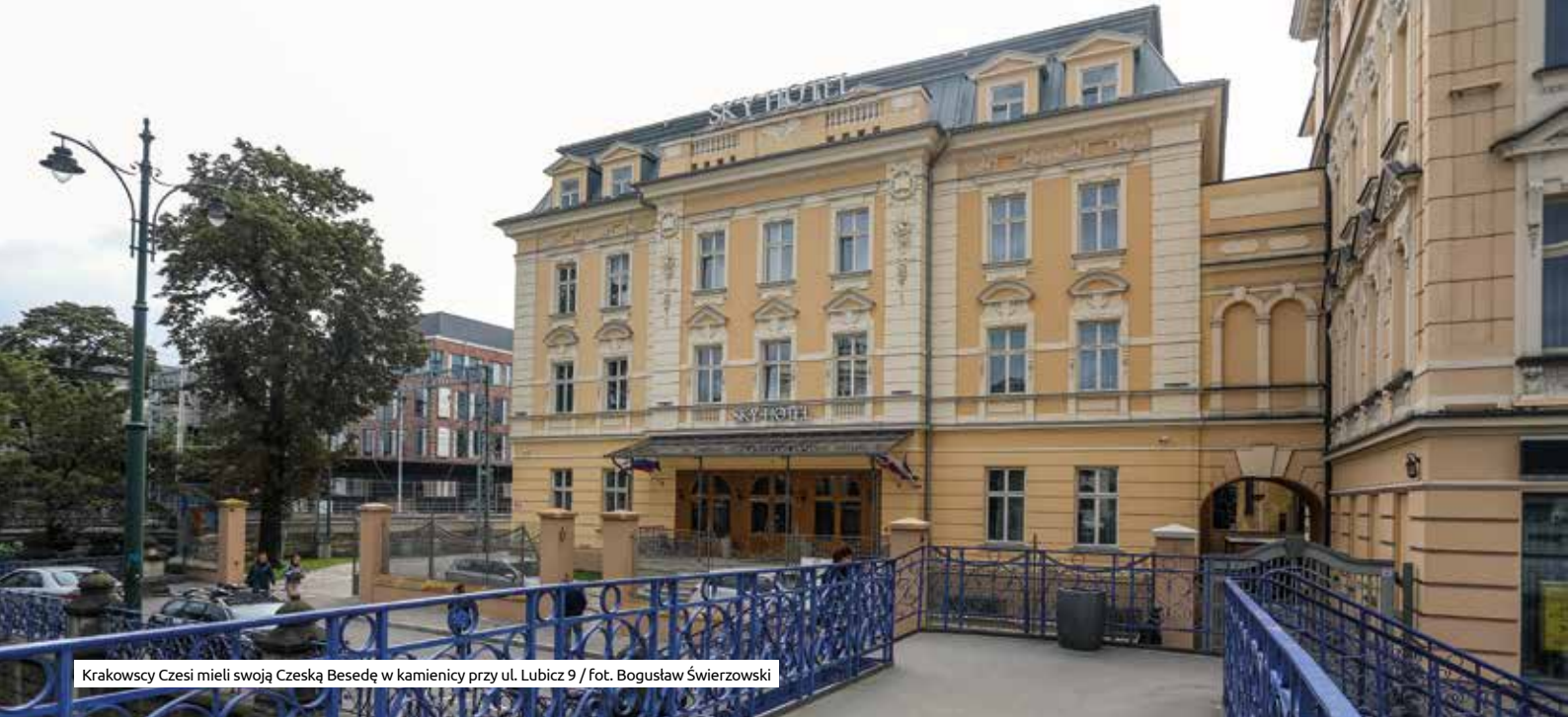
Krakowscy Czesi mieli swoją Czeską Besedę w kamienicy przy ul. Lubicz 9