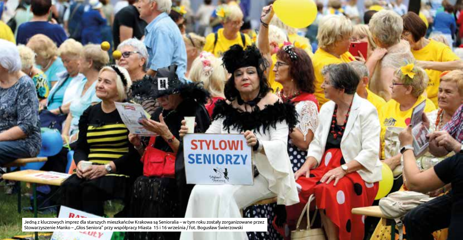
Jedną z kluczowych imprez dla starszych mieszkańców Krakowa są Senioralia – w tym roku zostały zorganizowane przez Stowarzyszenie Manko – „Głos Seniora” przy współpracy Miasta 15 i 16 września