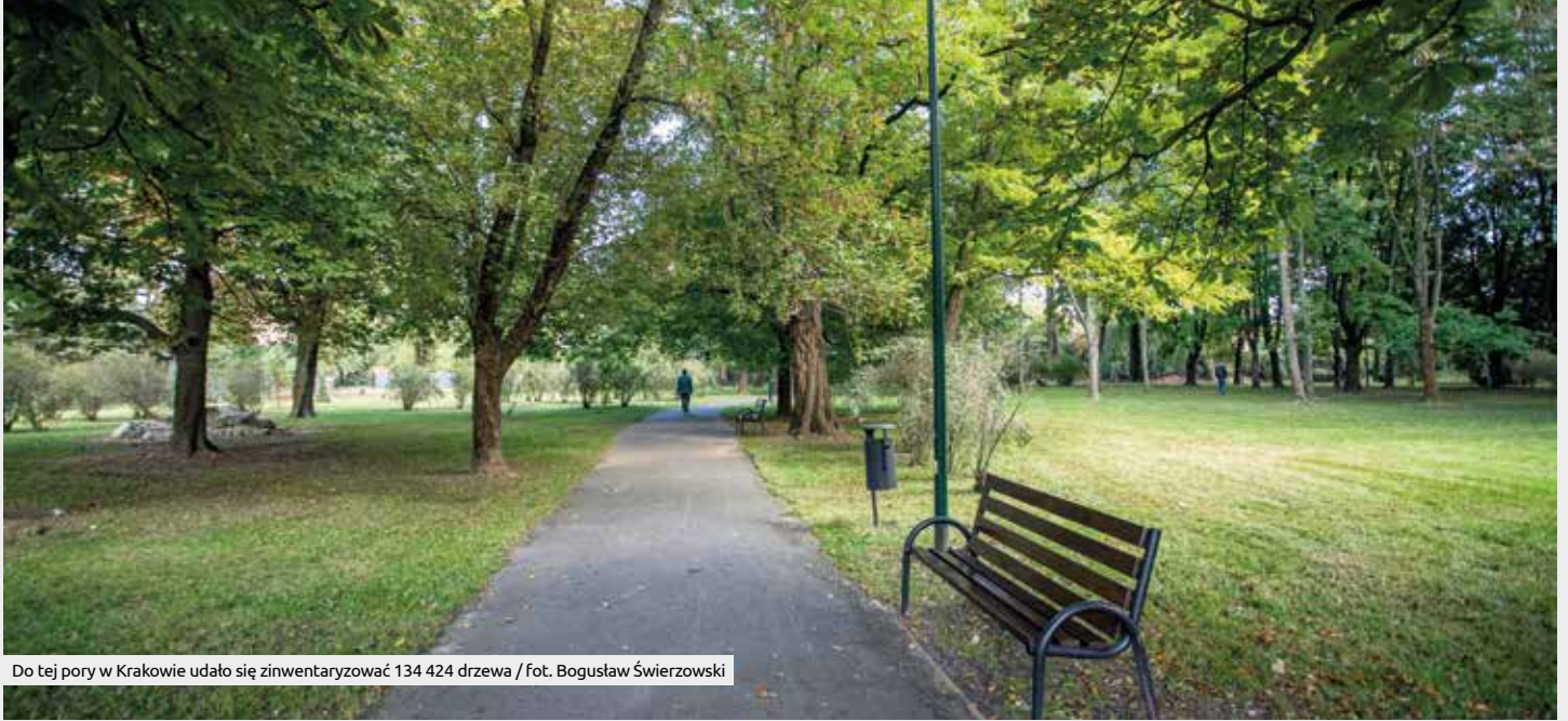
Do tej pory w Krakowie udało się zinventaryzować 134 424 drzewa