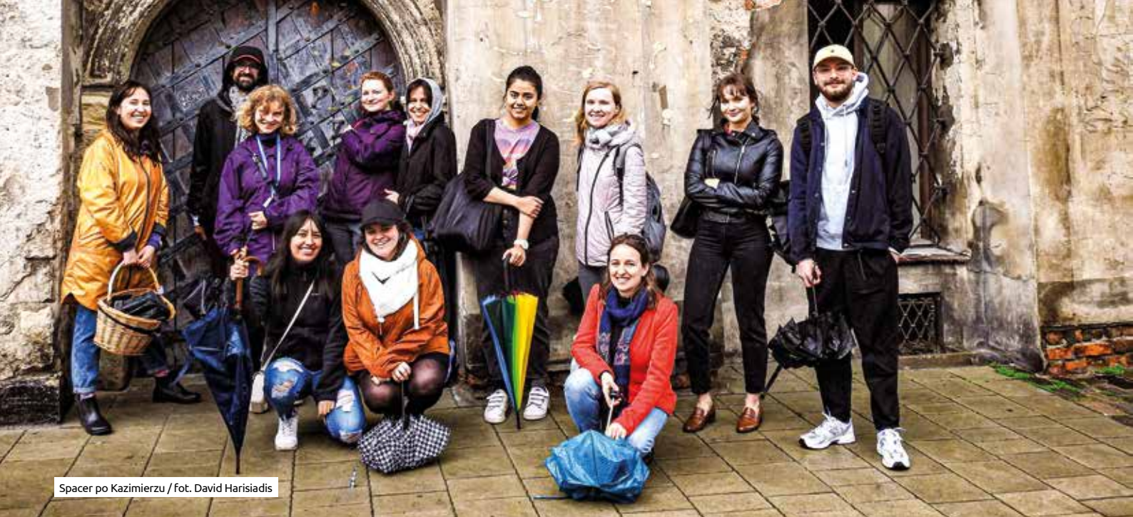
Spacer po Kazimierzu