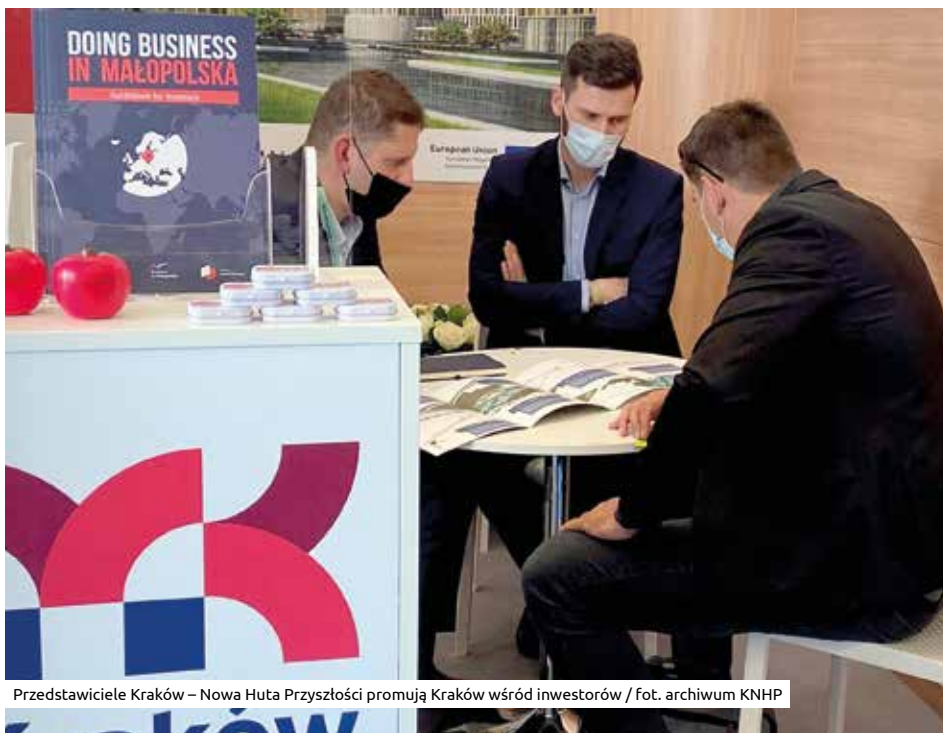
Przedstawiciele Kraków – Nowa Huta Przyszłości promują Kraków wśród inwestorów