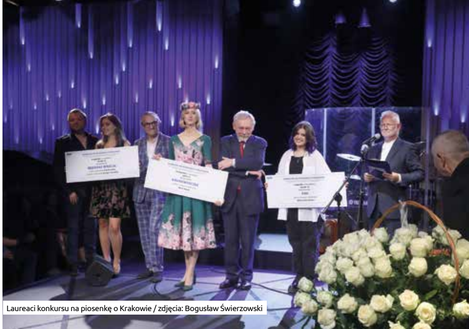
Laureaci konkursu na piosenkę o Krakowie