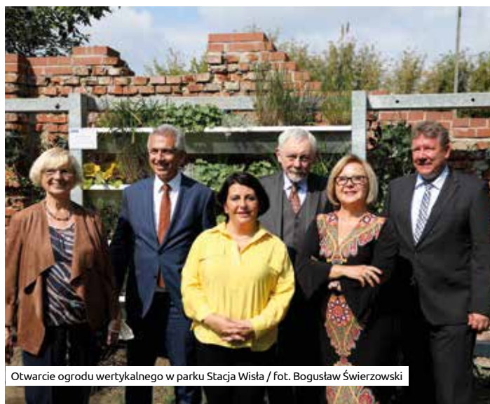
Otwarcie ogrodu wertykalnego w parku Stacja Wiśta