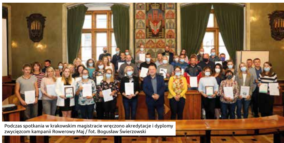
Podczas spotkania w krakowskim magistracie wręczono akredytacje i dyplomy zwycięzcom kampanii Rowerowy Maj