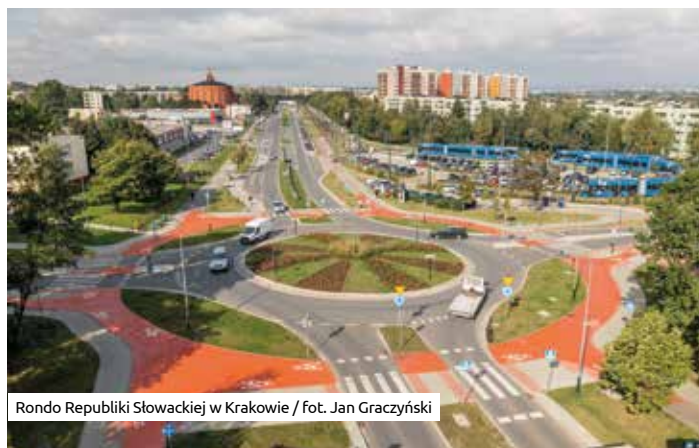
Rondo Republiki Słowackiej w Krakowie

Określenie to przychodzi na myśl także w kontekście nowych patronów krakowskich skwerów. Pierwszy z nich – Ozjasz Thon – był wybitnym polskim rabinem, kaznodzieją postępowej synagogi Tempel, publicystą, fundatorem żydowskiej biblioteki „Ezra”,