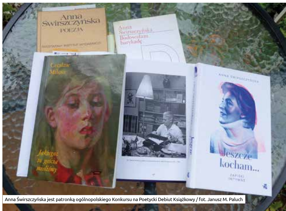
Anna Świrszczyńska jest patronką ogólnopolskiego Konkursu na Poetycki Debiut Książkowy

Anna Świrszczyńska zmarła w Krakowie 30 września 1984 r. Pochowana została na cmentarzu Rakowickim. Pozostawiła po sobie wiersze, których przestanie jest wciąż aktualne.