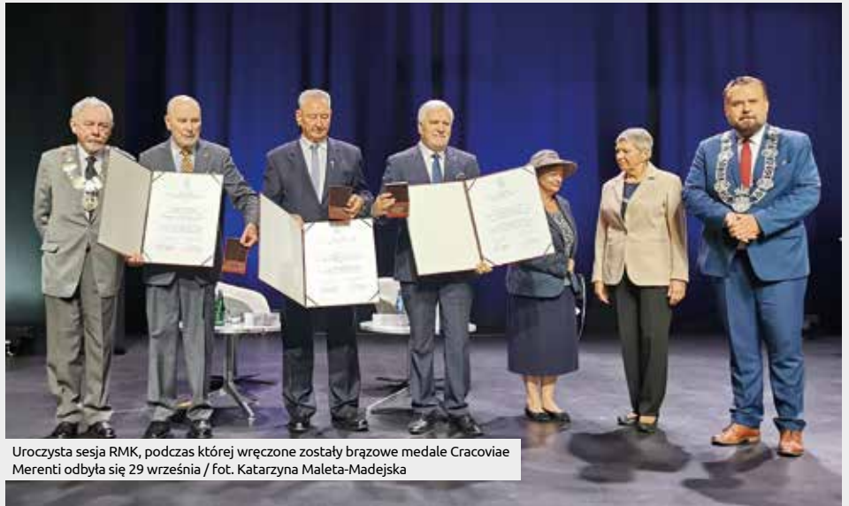
Uroczysta sesja RMK, podczas której wręczone zostały brązowe medale Cracoviae Merenti odbyła się 29 września