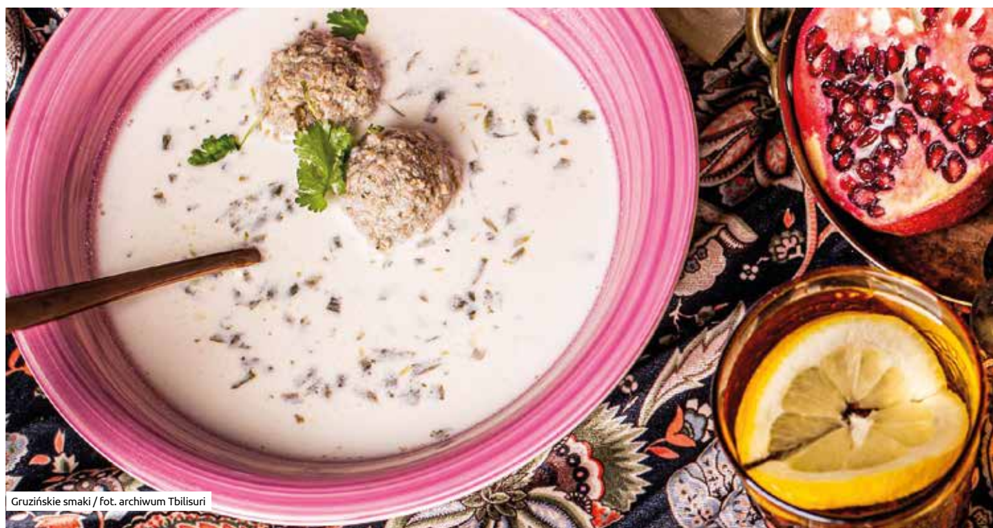
Gruzińskie smaki