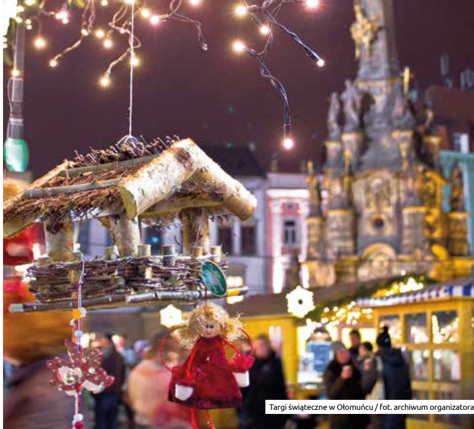
Targi świąteczne w Ołomuńcu

Kilkadziesiąt dni oczekiwania, pół kilo wystanych kartek, dobry tydzień sprzątanania i gotowania, a na koniec – szczypta magii. W każdym domu przepis na udane święta jest nieco inny, ale jego nieodłącznym składnikiem jest potrzeba wspólnej kontemplacji i zabawy. To dlatego jedną z najstarszych i najpiękniejszych miejskich tradycji są targi bożonarodzeniowe.