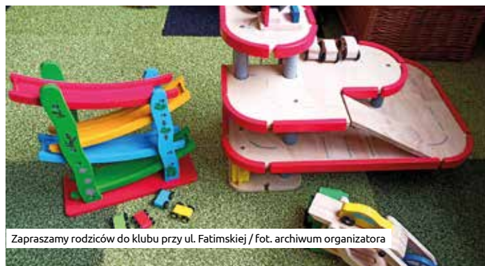
Zapraszamy rodziców do klubu przy ul. Fatimskiej

Na krakowską sieć prężnie działających Klubów Rodziców składają się łącznie 44 placówki, w tym 13 prowadzonych jest przez organizacje pozarządowe, a 31 przez miejskie jednostki kultury oraz MOPS. W nowym Klubie Rodziców przy ul. Fatimskiej organizowane są ciekawe wykłady oraz zajęcia, spotkania ze specjalistami, a także rodzinne warsztaty wzmacniające kompetencje rodziców i więzi rodzinne. Działalność Klubu jest współfinansowana ze środków Miasta Krakowa, dzięki czemu mieszkańcy mogą korzystać z jego oferty nieodpłatnie.