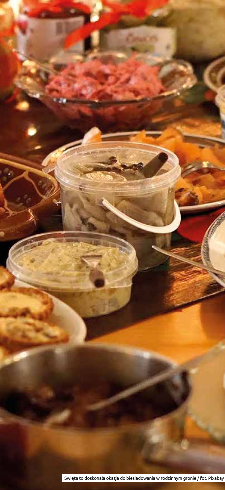
Święta to doskonała okazja do biesiadowania w rodzinnym gronie

Która typowo polska potrawa z makaronem zaskoczyła włoskiego mistrza kuchni? Jak archeolog z Krakowa wpłynął na sałata serwowane w ukraińskiej restauracji? I dlaczego Palestyńczyk mieszkający od 30 lat w stolicy Małopolski ceni sklep studenta z Wietnamu? W okresie przedświątecznym, czasie spotkań i szukania inspiracji kulinarnych, przy naszym redakcyjnym stole siadamy z tymi, którzy kształtują smaki mieszkańców Krakowa i równocześnie są ambasadorami miasta za granicą.