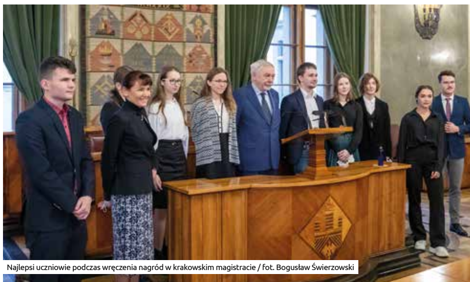
Najlepsi uczniowie podczas wręczenia nagród w krakowskim magistracie