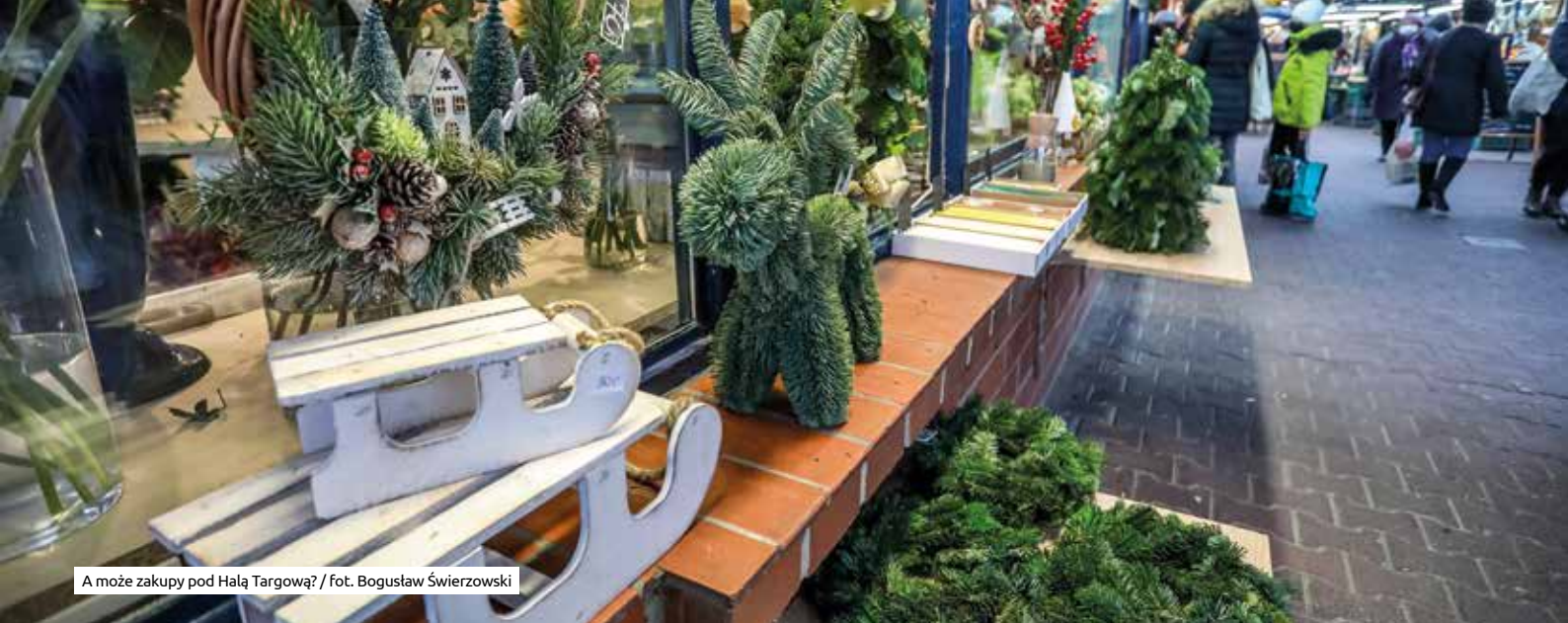
A może zakupy pod Halą Targową?