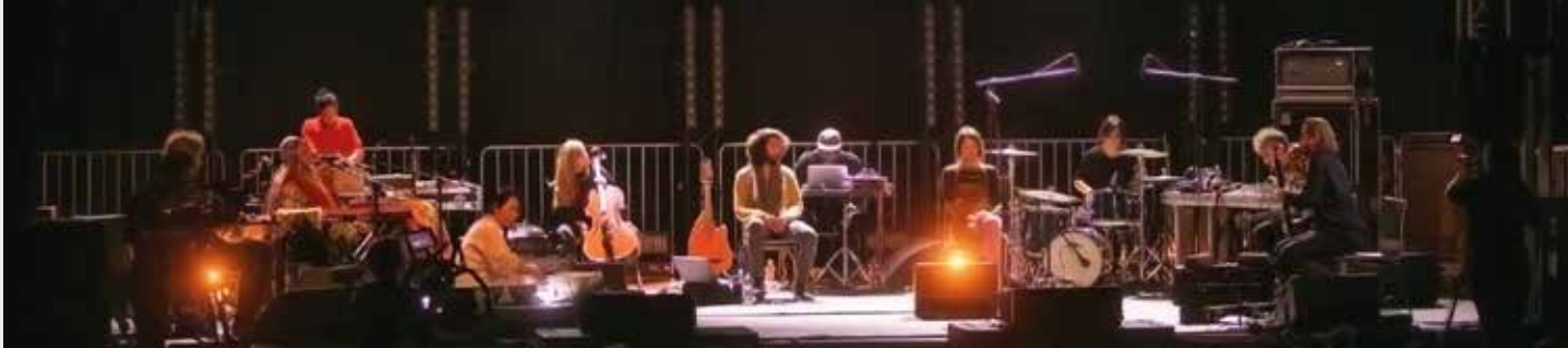
Festiwal Unsound to festiwal muzyczny odbywający się w Krakowie, który prezentuje różnorodne formy muzyki elektronicznej i eksperymentalnej