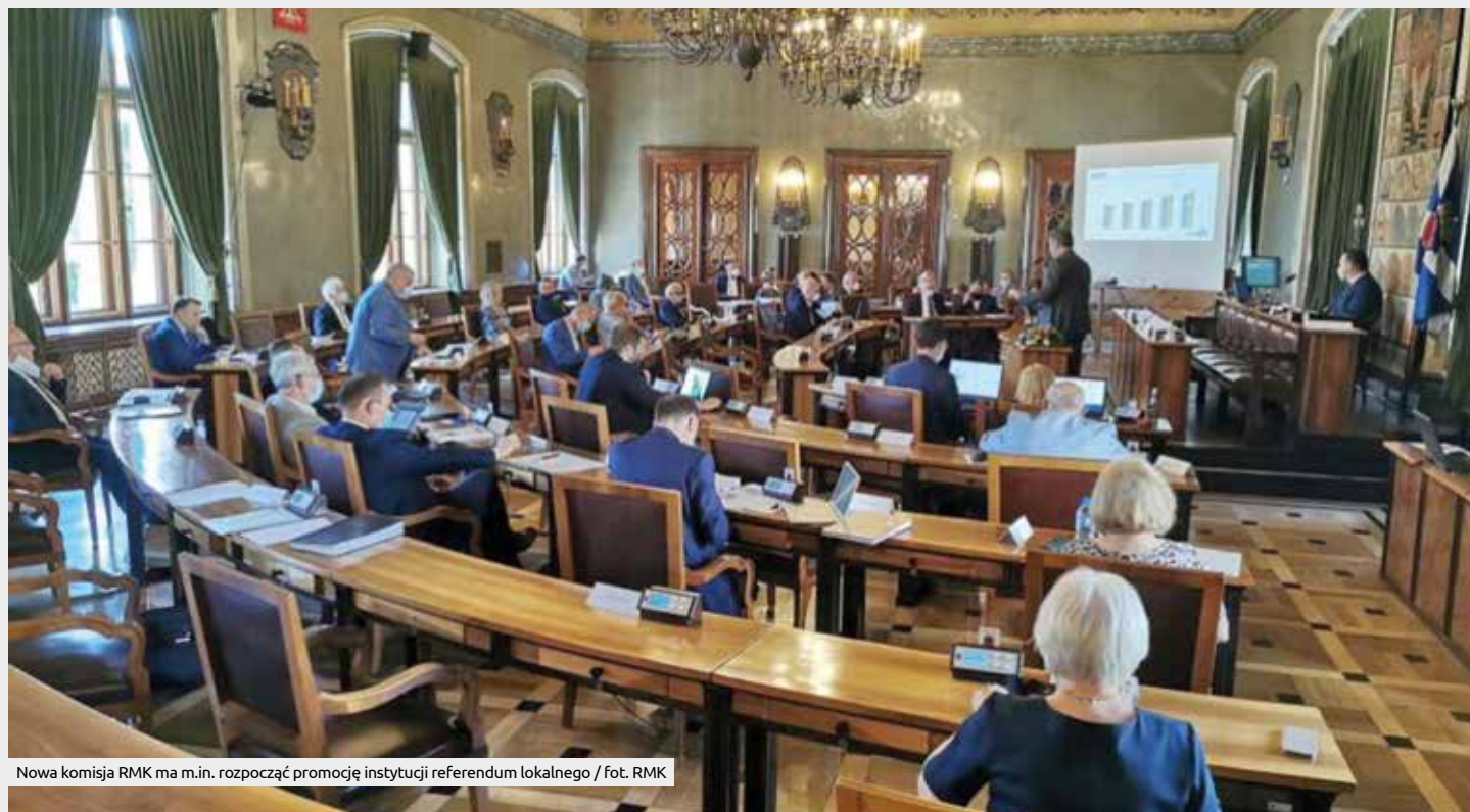
Nowa komisja RMK ma m.in. rozpocząć promocję instytucji referendum lokalnego