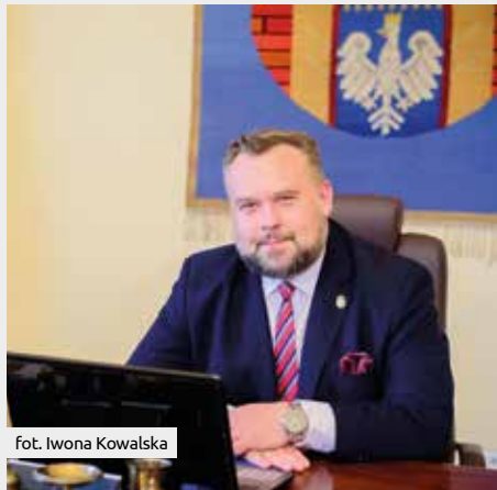
Fot. Iwona Kowalska