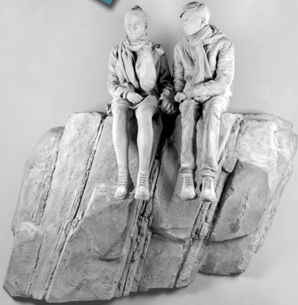
HANS OP DE BEECK, THE CLIFF (WALL PIECE), 2019, RZEźBA, 230 x 212 x 116 CM, KOLEKCJA MOCAK-U