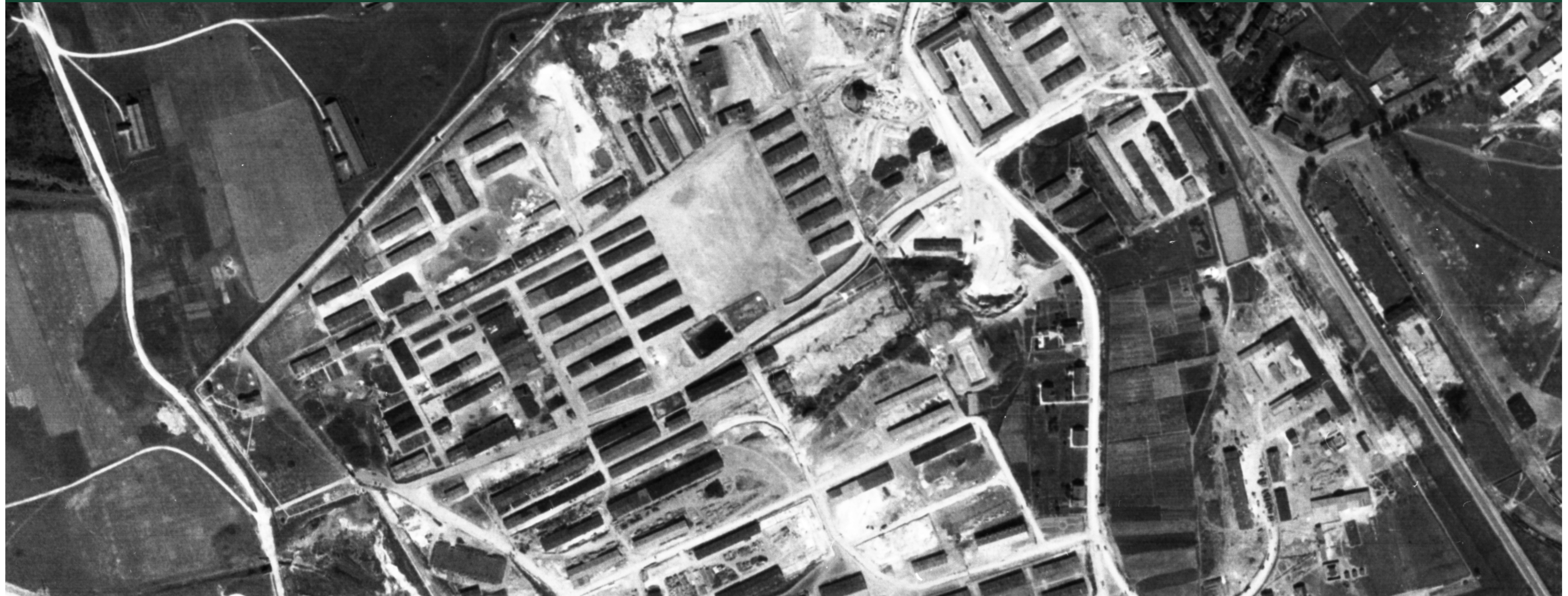
OBÓZ KONCENTRACYJNY PLASZÓW | zdjęcie lotnicze z sierpnia 1944 r.