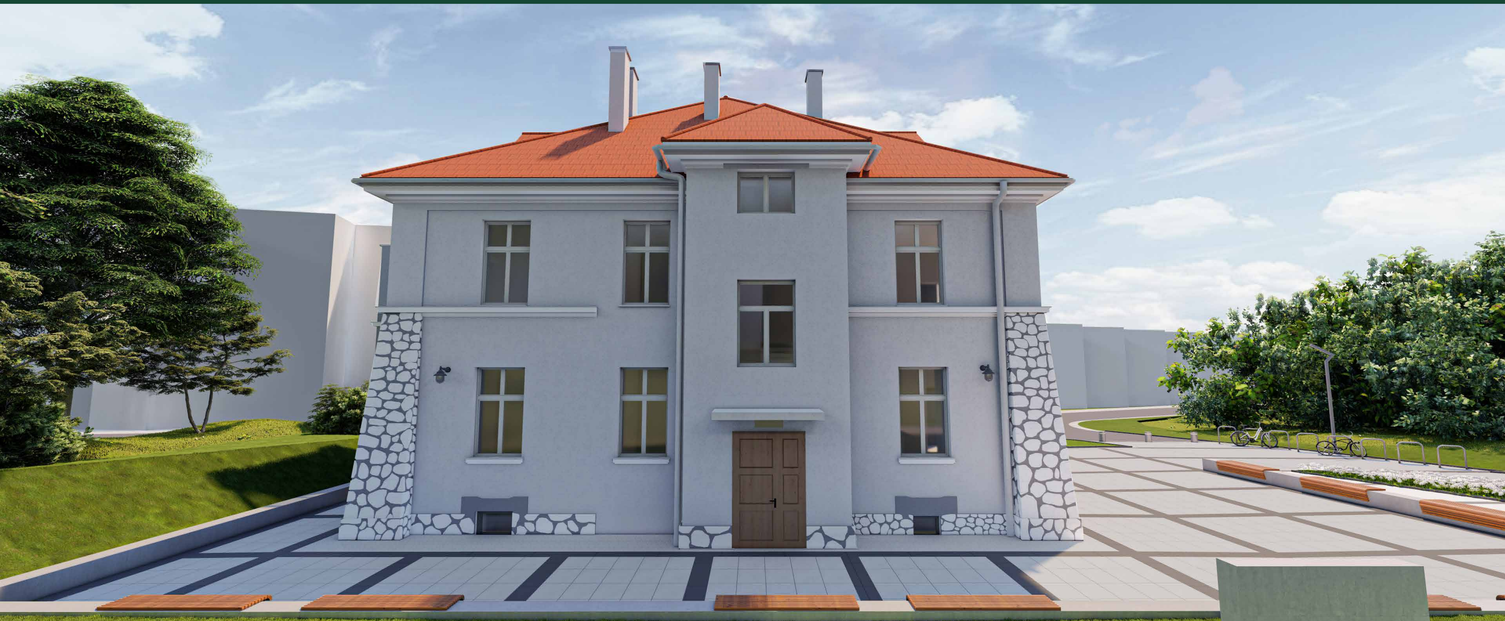
SZARY DOM | wizualizacja – wejście główne