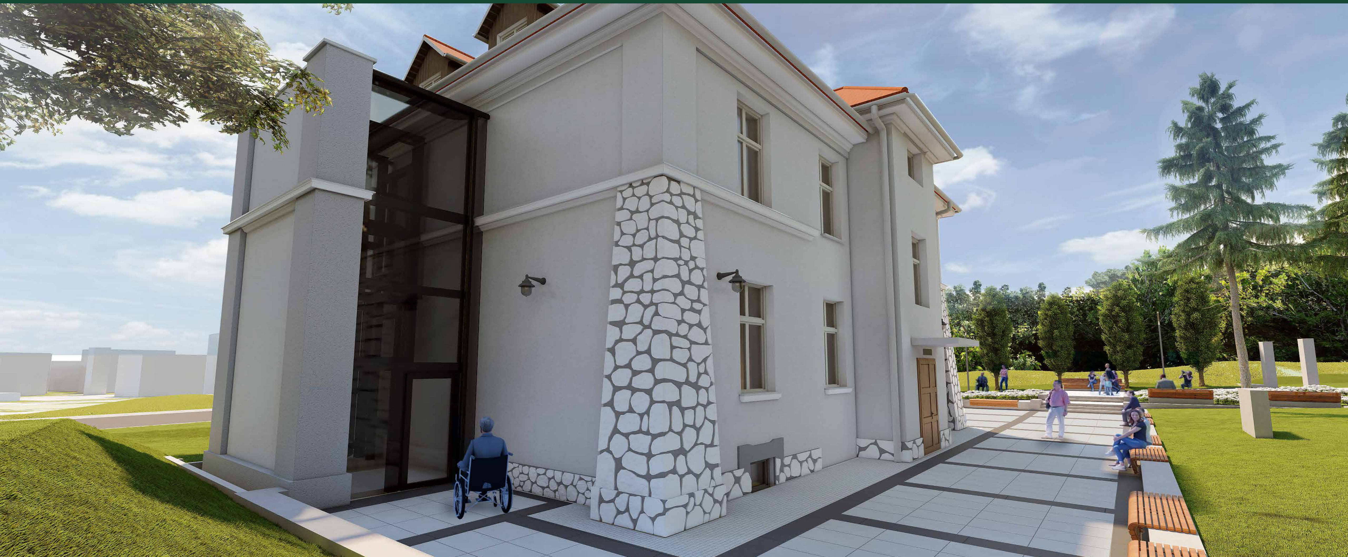
SZARY DOM | wizualizacja – wejście od północy z planowanym szybem windy