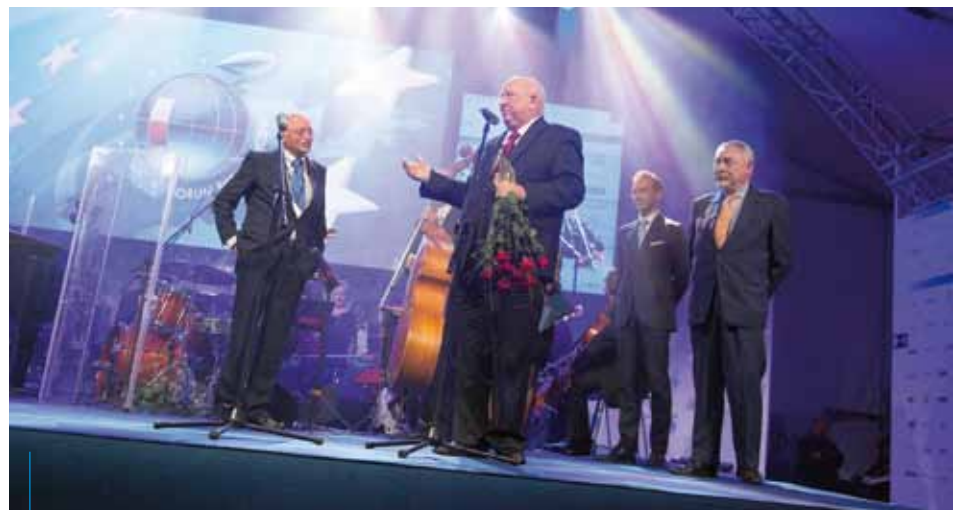
Prezydent Jacek Majchrowski oraz były komisarz UE Guenter Verheugen wręczyli nagrodę specjalną XXIII Forum Ekonomicznego byłemu premierowi Józefowi Oleksemu

Co roku odwiedza je ponad 2 tys. gości z 60 krajów, którzy w ciągu kilku dni obrad uczestniczą w ponad 150 panelach dyskusyjnych. Wydarzenie komentowane jest przez niemal 400 akredytowanych dziennikarzy polskich i zagranicznych.