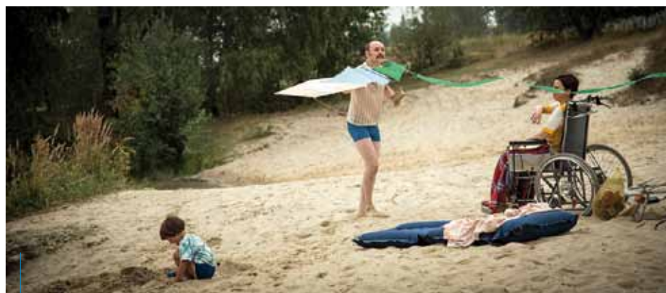
Kadr z filmu „Pani z przedszkola”

opowieści pozwoli mi zaprezentować pełną paletę emocji granej przez mnie postaci, także jej komediowe elementy – mówi aktorka.