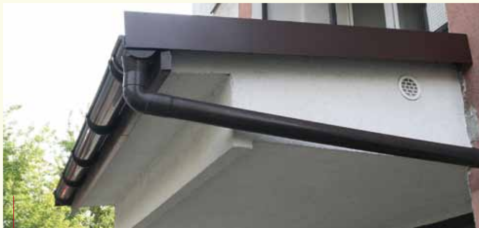
Kraków będzie dopłacał do zebranej deszczówki

ten cel 0,5 mln zł. Ale to nie wszystko. Kraków będzie też starał się o dofinansowanie w wysokości 500 tys. zł na program małej retencji z Wo-