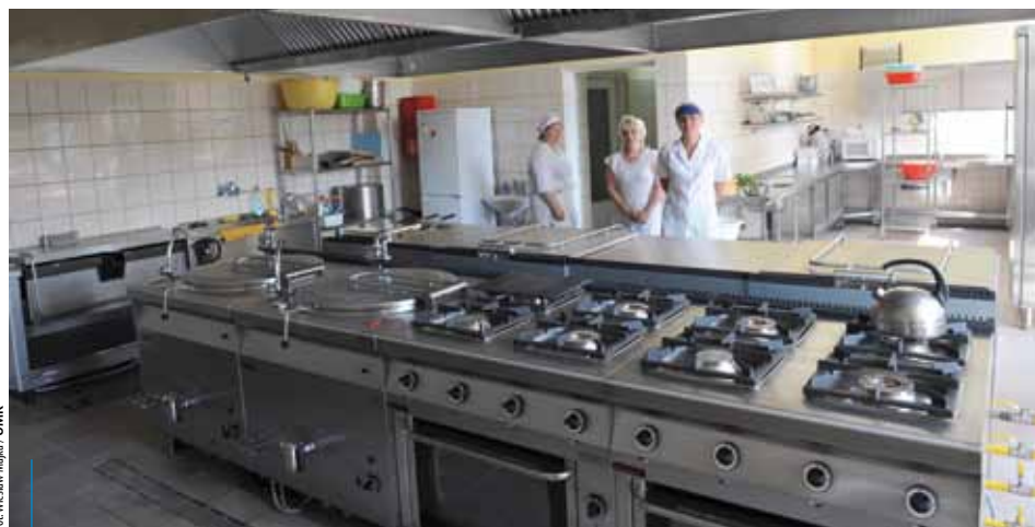
Pomimo obaw szkolne stołówki nadal oferują smaczne i pełnowartościowe posiłki