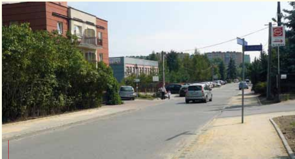
Dzięki współpracy dwóch dzielnic: VIII i IX udało się wyremontować chodnik łączący ulice Miłkowskiego i Strąkową