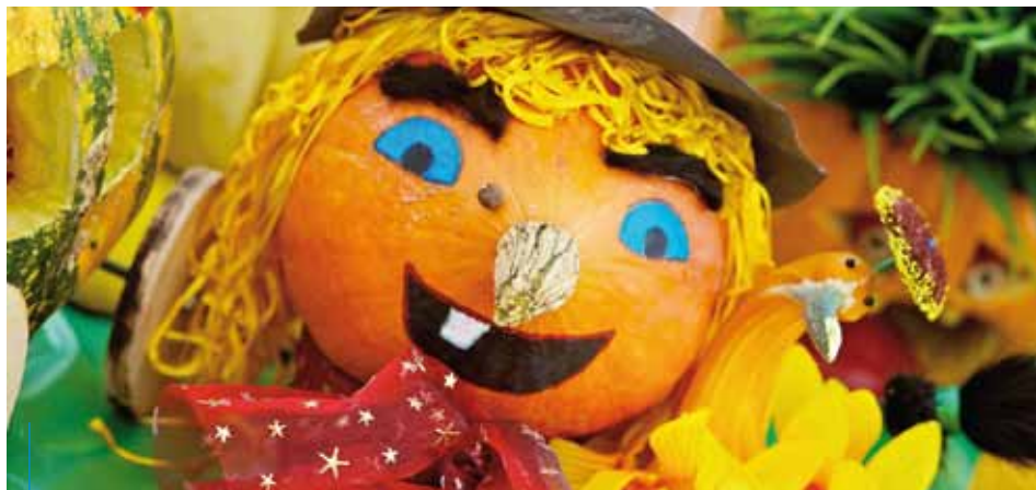
Dynia jaka jest, każdy widzi...

Najwięcej dyniowych atrakcji czeka na osoby, które 22 września (niedziela) wezmą udział w imprezie finałowej festiwalu. W godzinach 14.00–18.00 na terenie zielonym przy os. Centrum E w Krakowie królować będzie dynia. Na przybyłych czekać będą dyniowe warsztaty dla dzieci i młodzieży, rękodzieło artystyczne dla dorosłych i seniorów, dyniowy kącik gier i zabaw rodzinnych, czytanie z dynią w tle, dyniowe malowanie twarzy, degustacje dyniowych potraw oraz wiele innych atrakcji. Wstęp wolny!