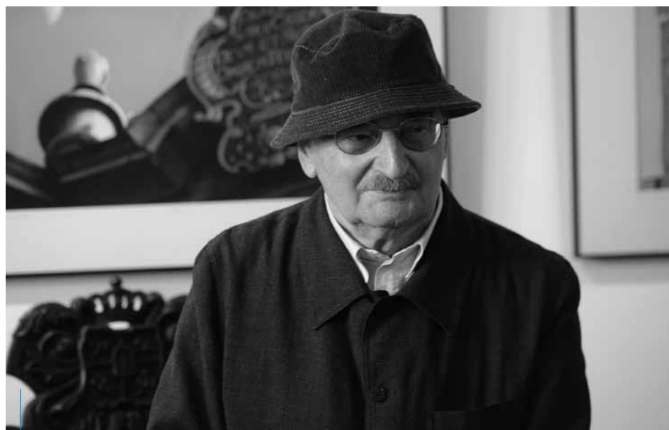
Sławomir Mrożek (1930–2013)

Przewidywane są zmiany w organizacji ruchu w miejscach, w których odbędą się uroczystości – szczegóły dostępne będą na stronie: www.krakow.pl .